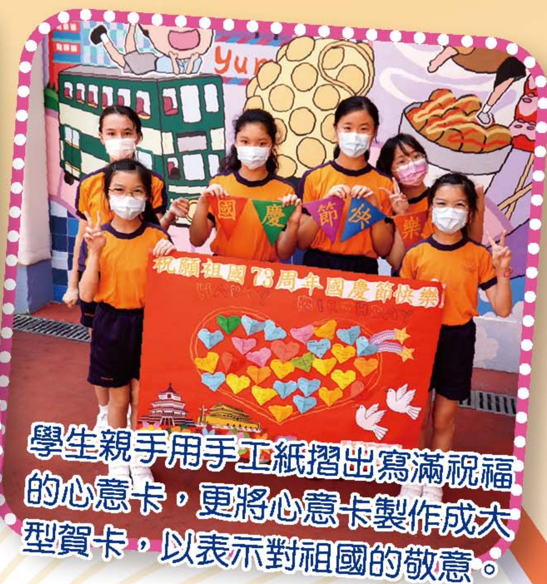
學生親手用手工紙摺出寫滿祝福的心意卡，更將心意卡製作成大型賀卡，以表示對祖國的敬意。