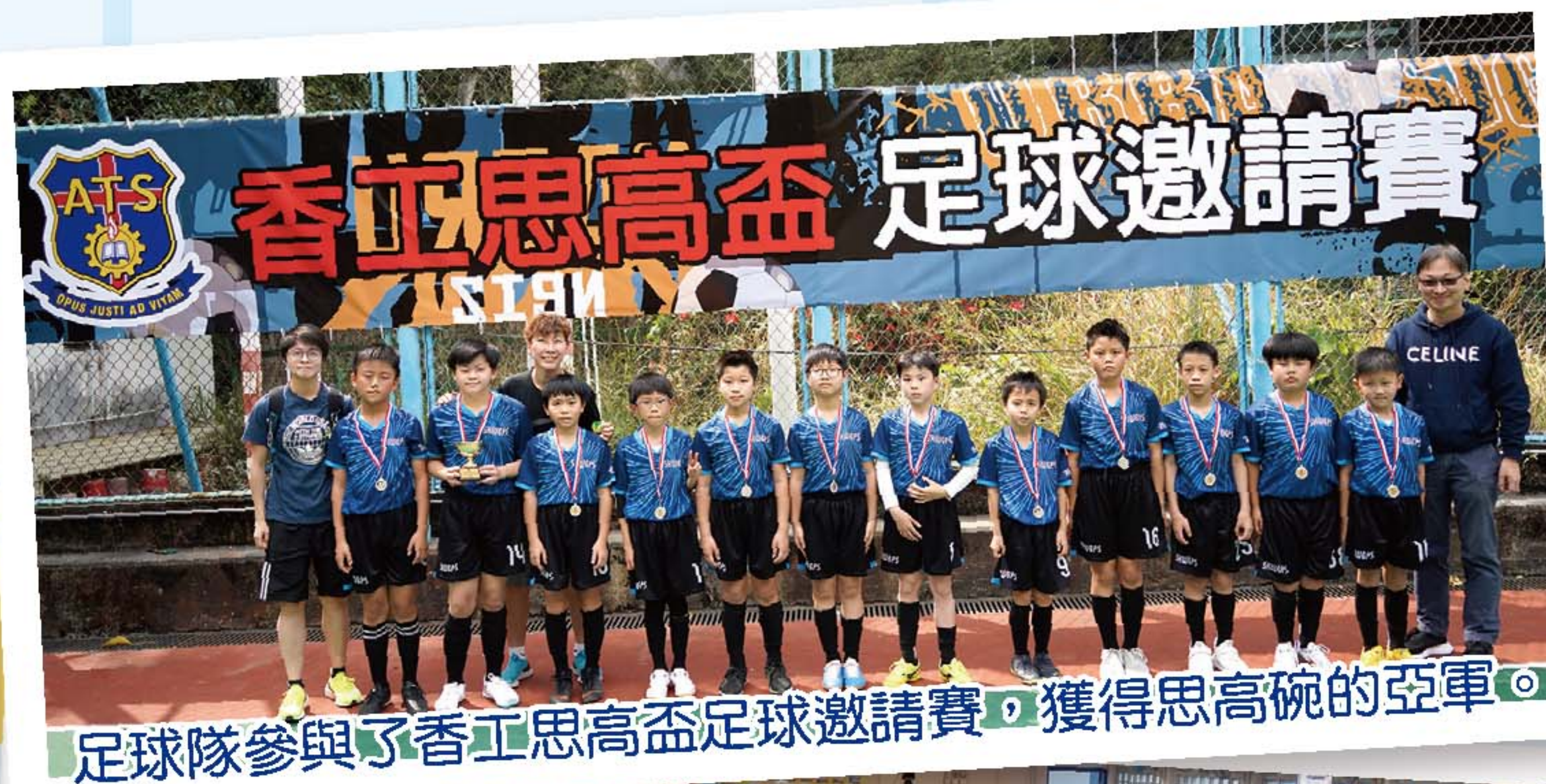
足球隊參與了香工思高盃足球邀請賽，獲得思高碗的亞軍。