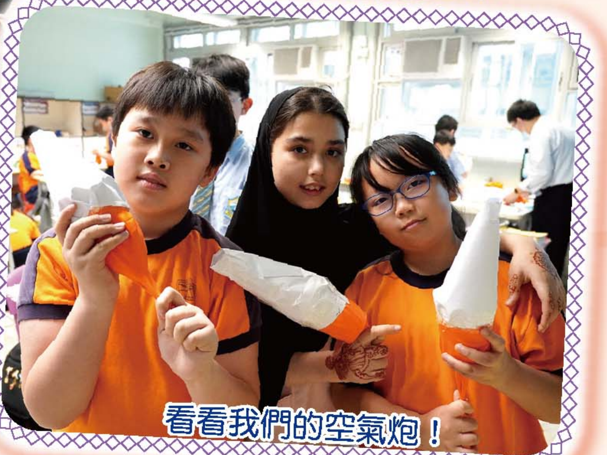
看看我們的空氣炮！