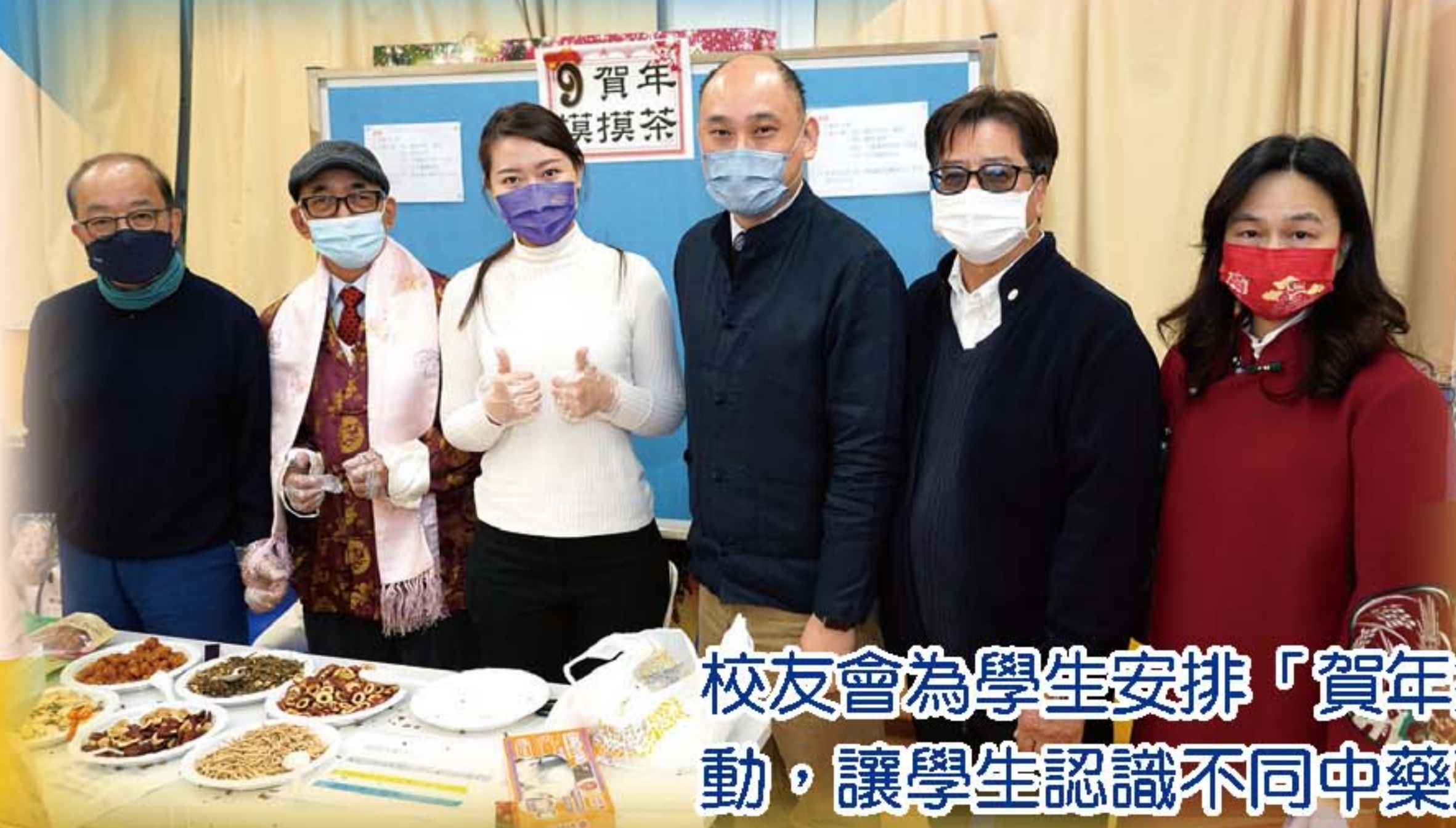
校友會為學生安排「賀年摸摸茶」攤位活動，讓學生認識不同中藥及食材的優點