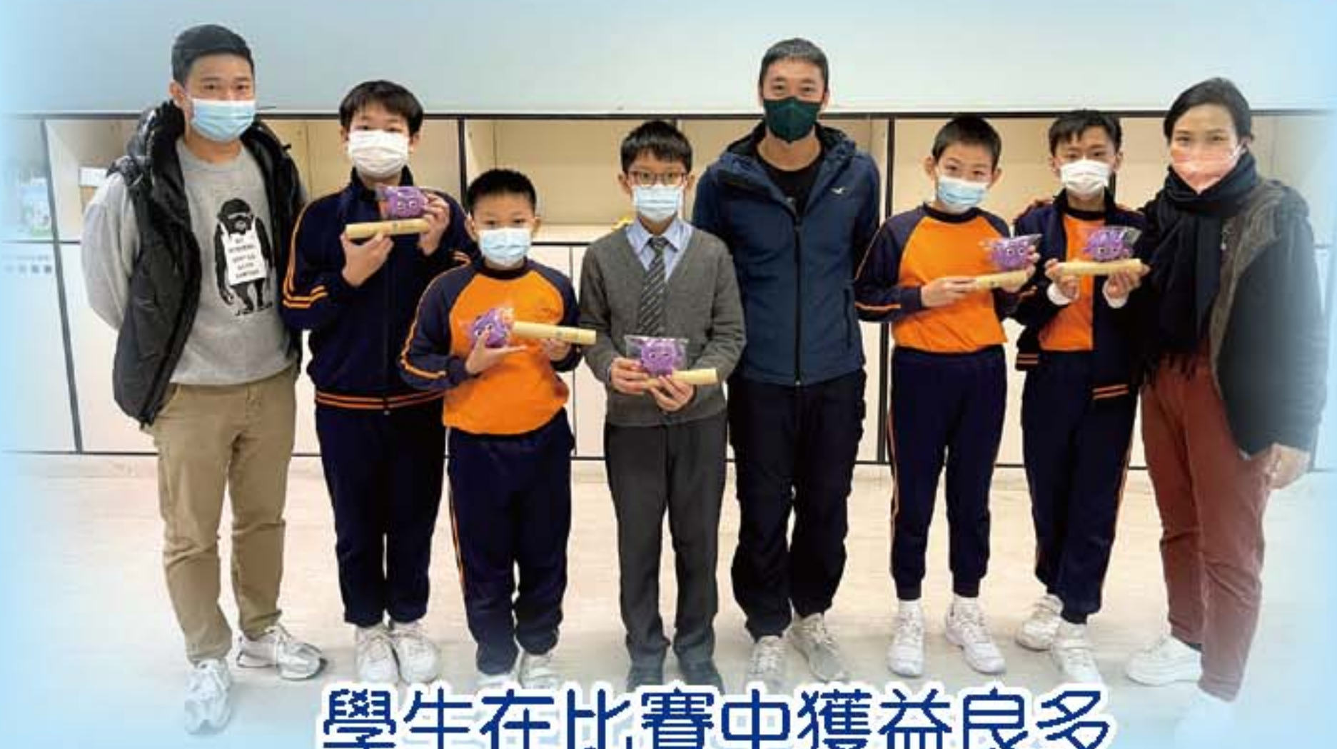
學生在比賽中獲益良多

本校幼童軍定期集會，透過考取進度性獎章，體現幼童軍誓詞和規律的精神。團員藉小隊編制，合作完成各項挑戰任務，展現團隊協作精神。幼童軍們亦不時進行戶外活動，親親大自然之餘，亦從體驗中學習。