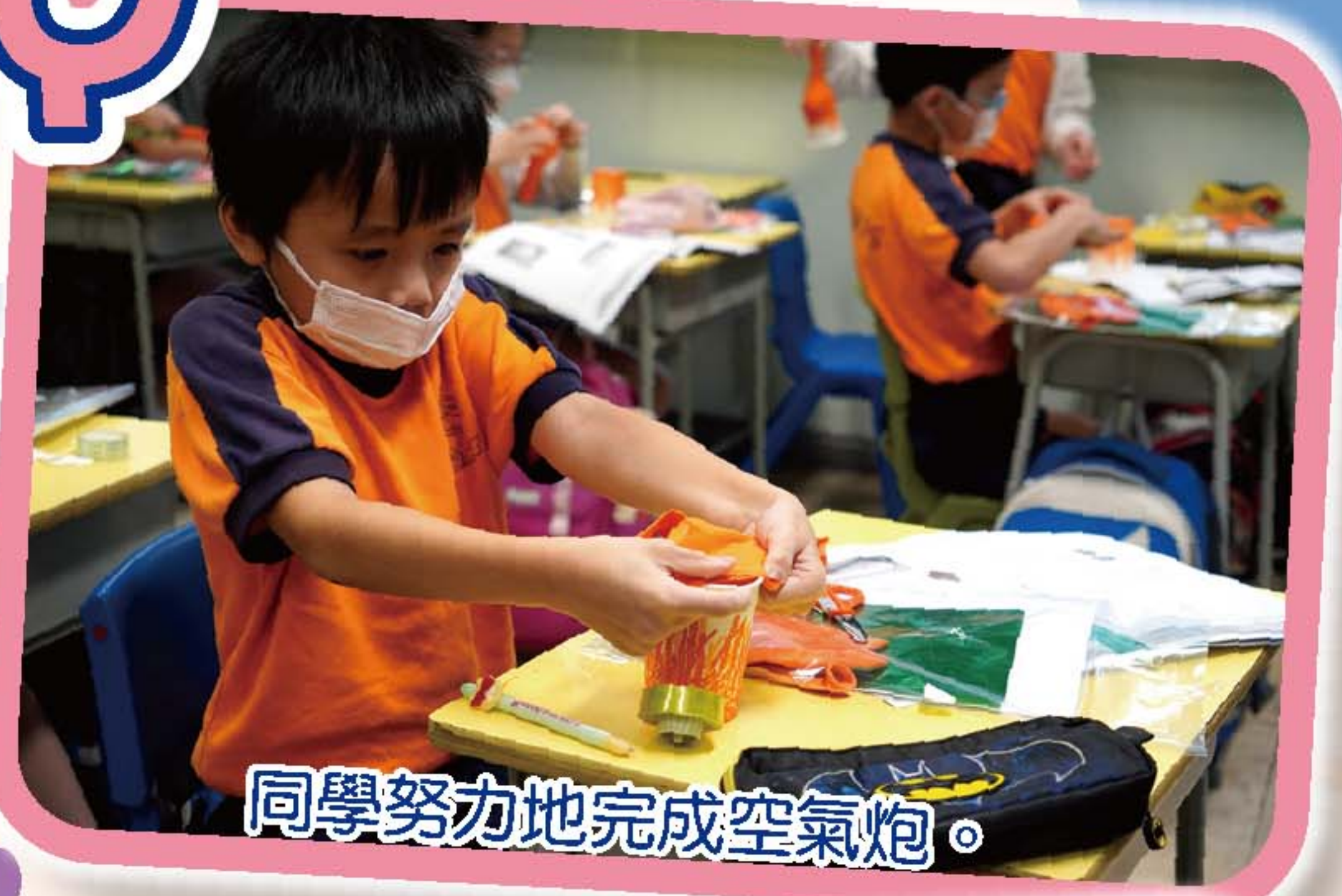
同學努力地完成空氣炮。

各級學生利用課堂中學會了的科學原理進行科學探究活動。當天同學表現非常投入和專注。主題包括：一年級——製作高效吸水拖把，二年級——製作太陽能小夜燈，三年級——製作磁遊全中國，四年級——製作空氣炮，五年級——製作橡皮放影機，六年級——製作輕盈大力士。是次活動不單讓學生對STEM有更深入的認識，更重要的是推動學生自主學習，培養學生的創新思維及提升學生對科學和科技的興趣。