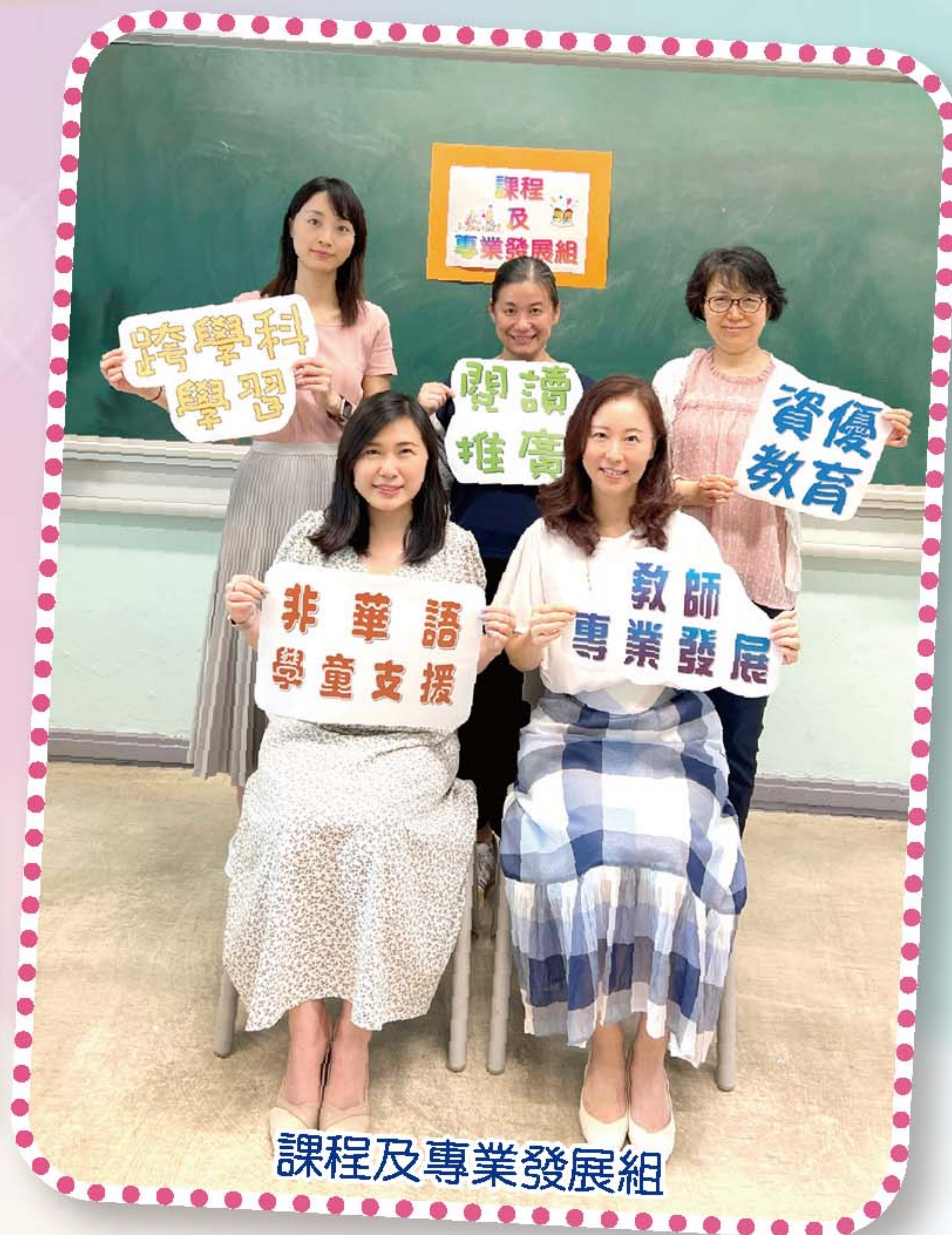
課程及專業發展組