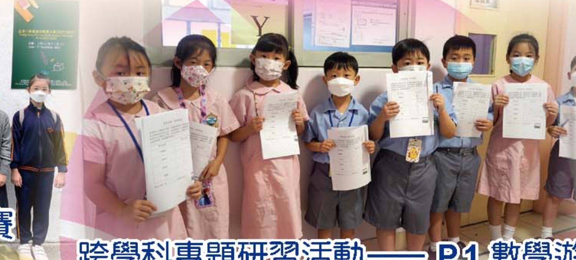
跨學科專題研習活動——P.1 數學遊蹤