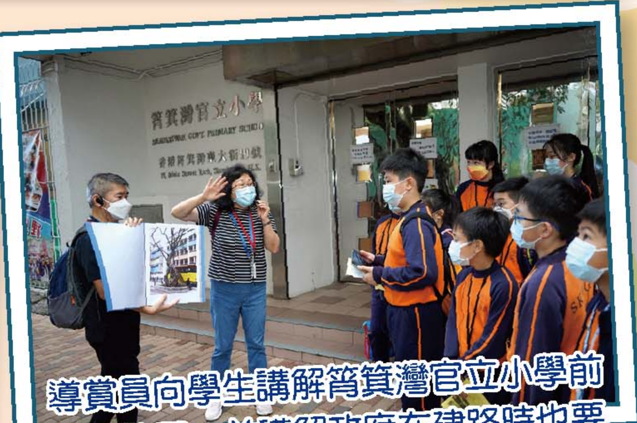
導賞員向學生講解筲箕灣官立小學前身是警署，並講解政府在建路時也要為校門前的百年老樹而稍作繞路