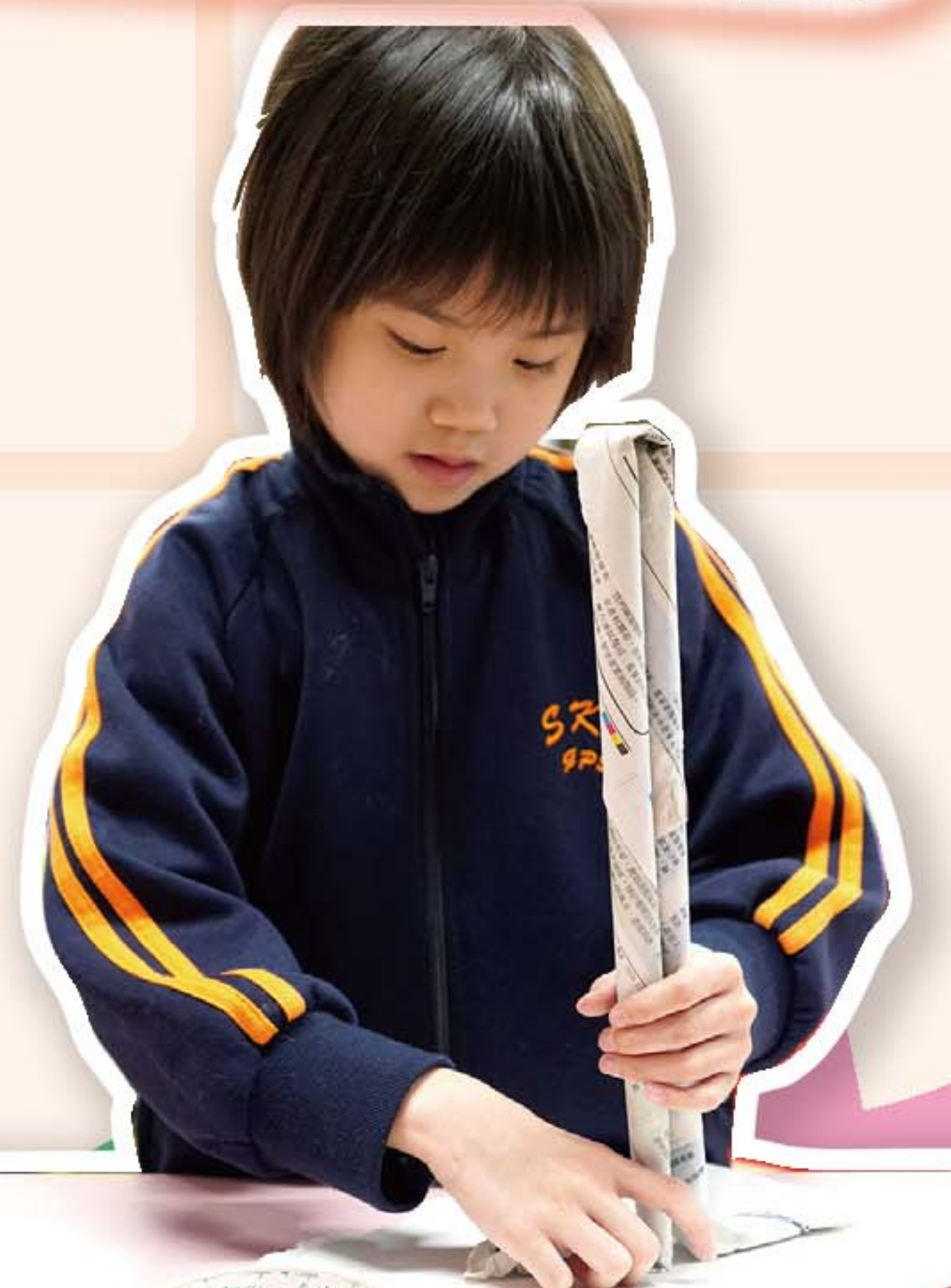
同學聚精會神地製作屬於自己的拖把。