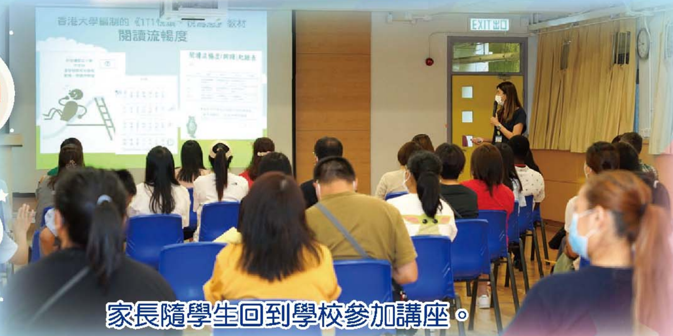
家長隨學生回到學校參加講座。