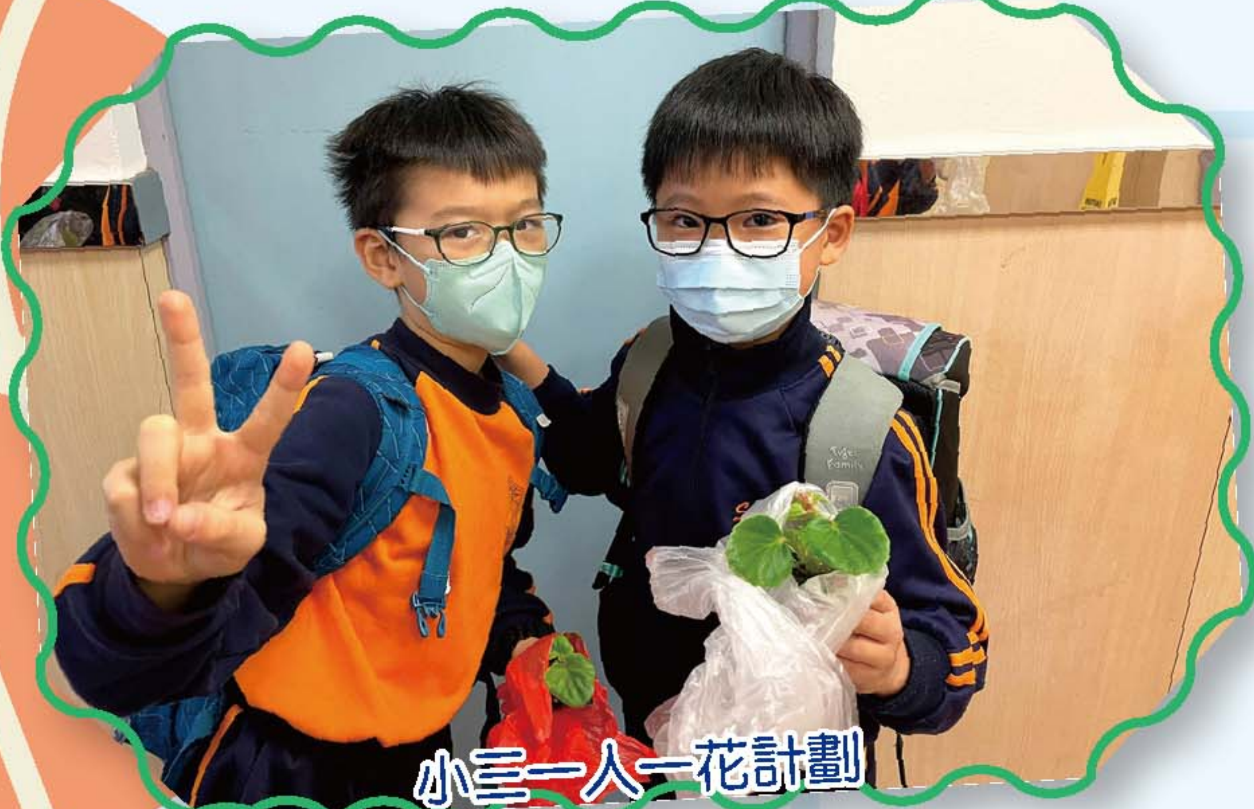
小三一人一花計劃