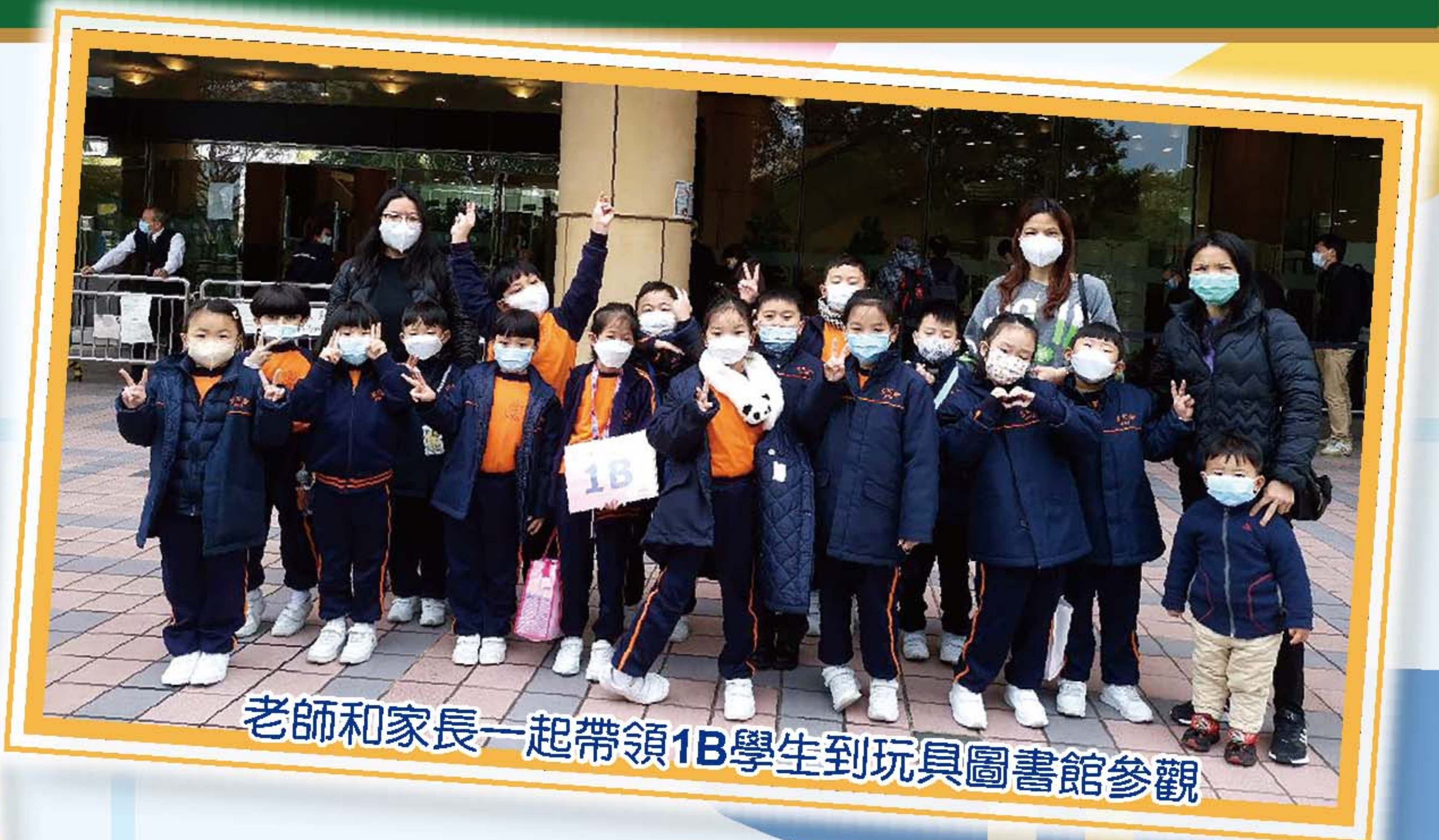
老師和家長一起帶領1B學生到玩具圖書館參觀