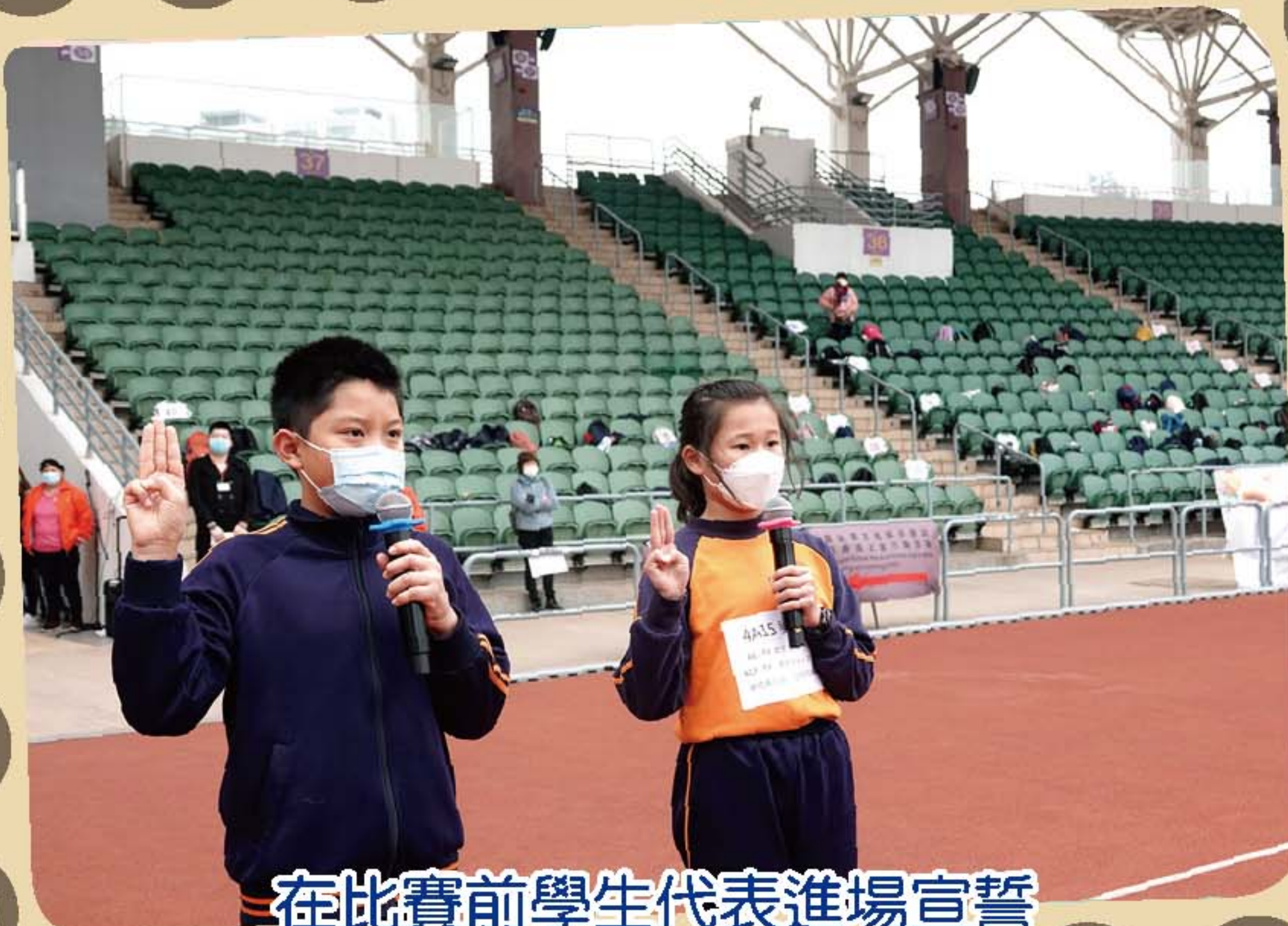
在比賽前學生代表進場宣誓