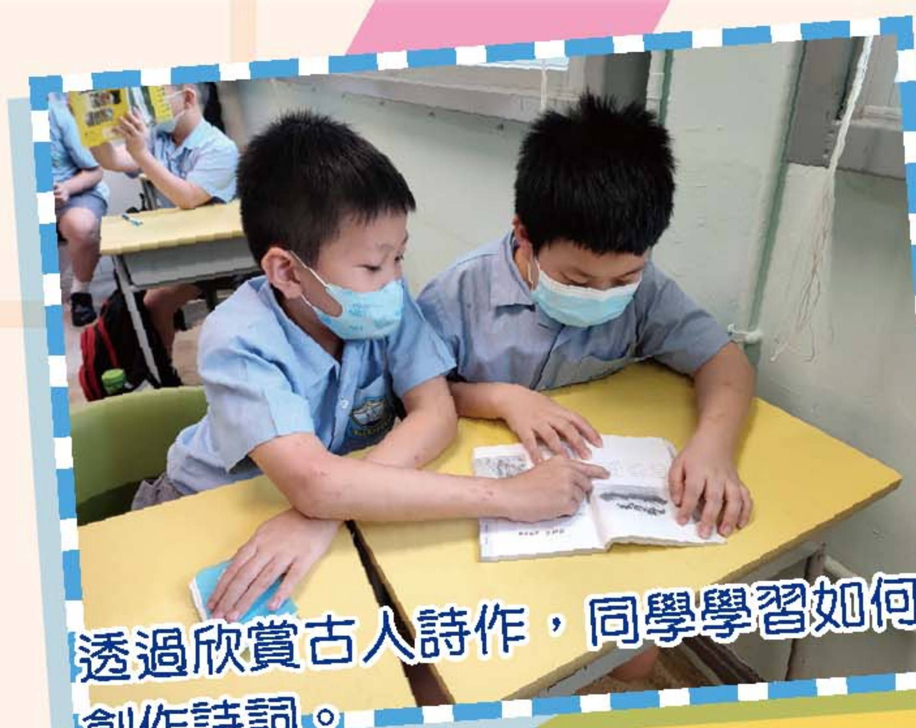
透過欣賞古人詩作，同學學習如何創作詩詞。

五年級以「探索中國」為主題，除了課堂的學習外，本校安排學生參觀香港文化博物館，讓學生認識中國不同年代的生活文化及特色。