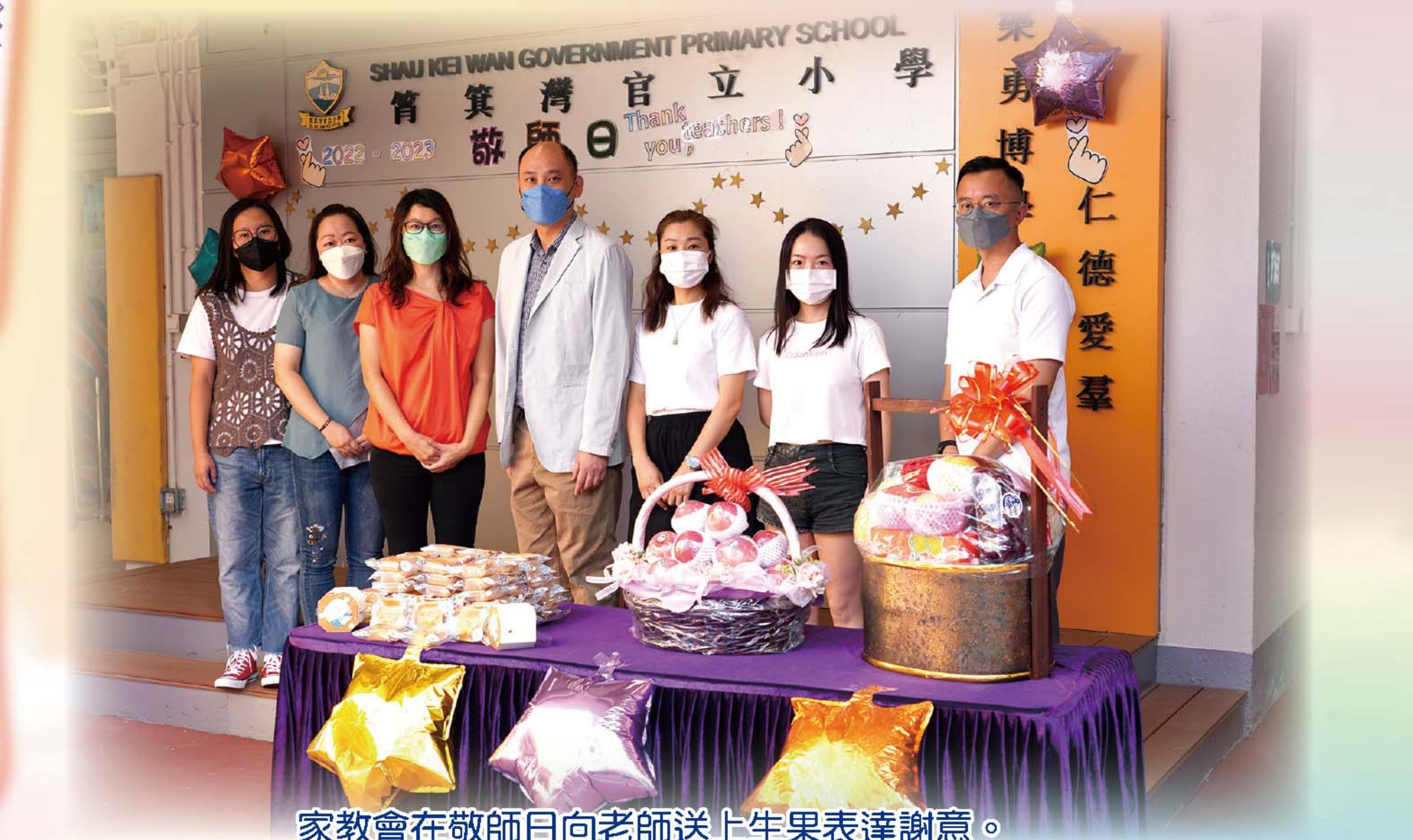
家教會在敬師日向老師送上生果表達謝意。