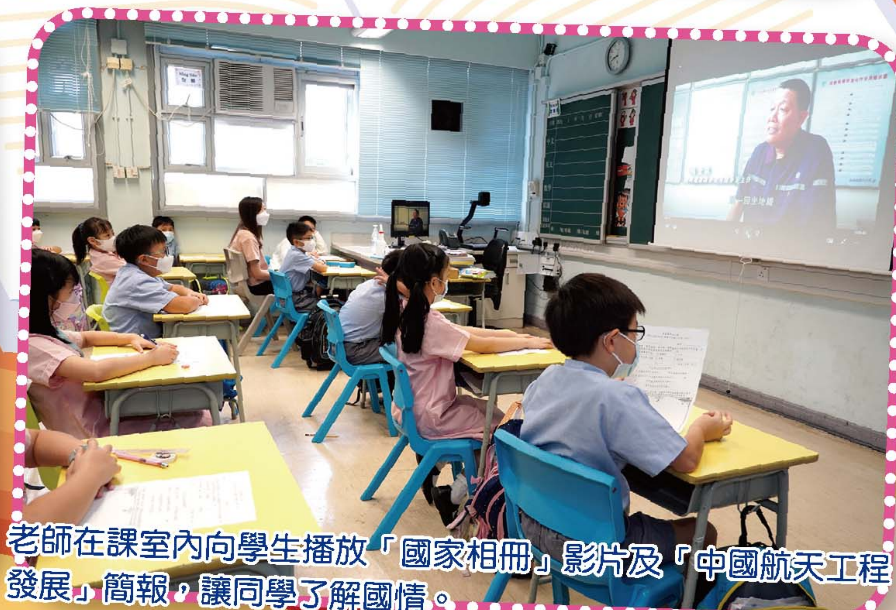
老師在課室內向學生播放「國家相冊」影片及「中國航天工程發展」簡報，讓同學了解國情。