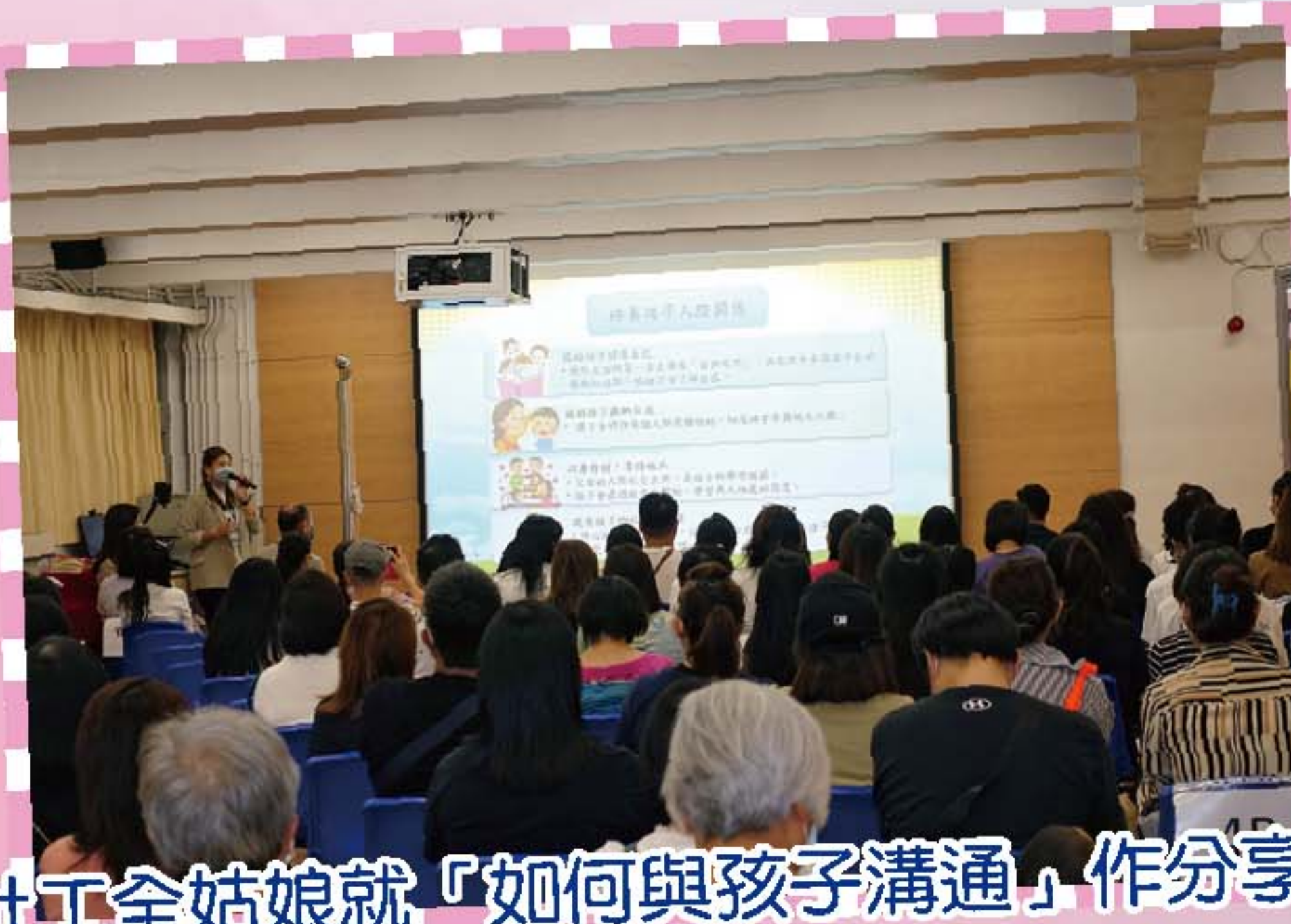
社工全姑娘就「如何與孩子溝通」作分享