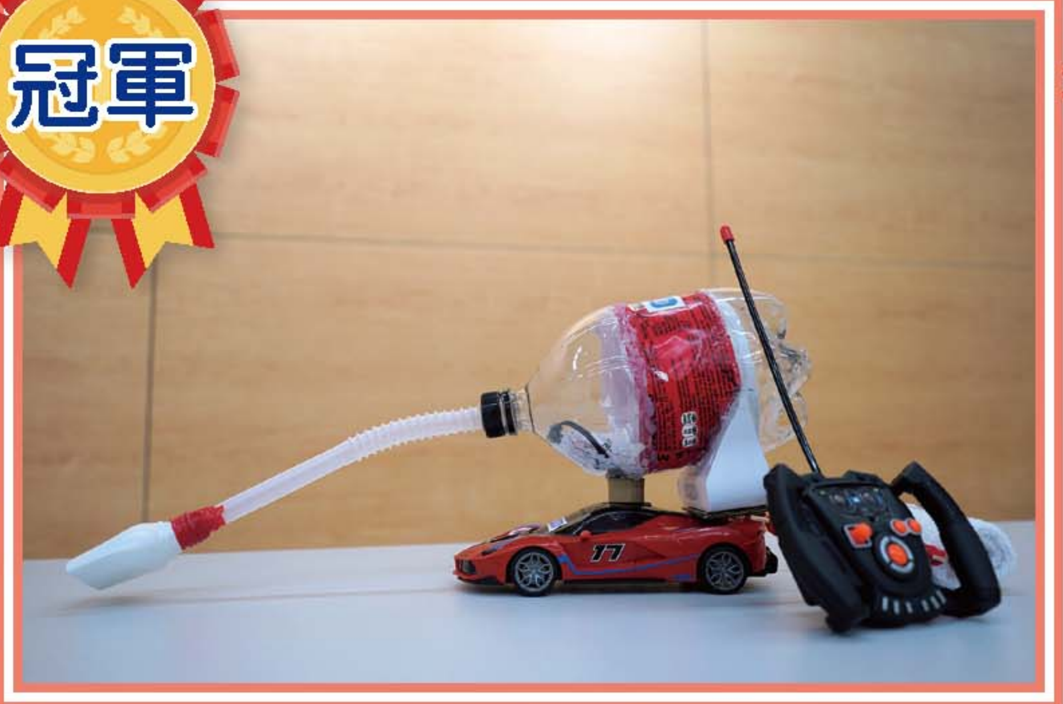
抹地、吸塵2合1遙控車 (4A 楊晞南)