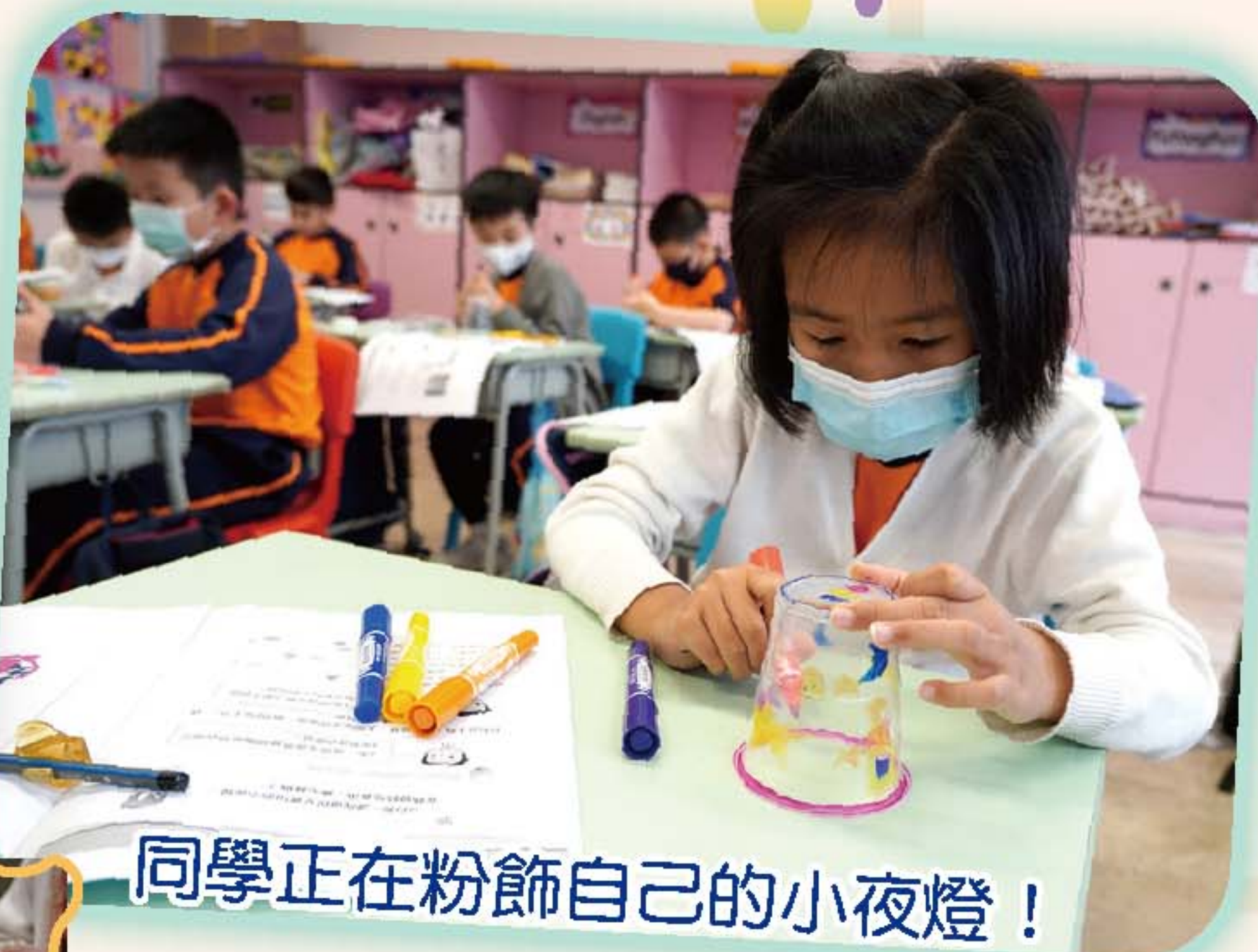
同學正在粉飾自己的小夜燈！