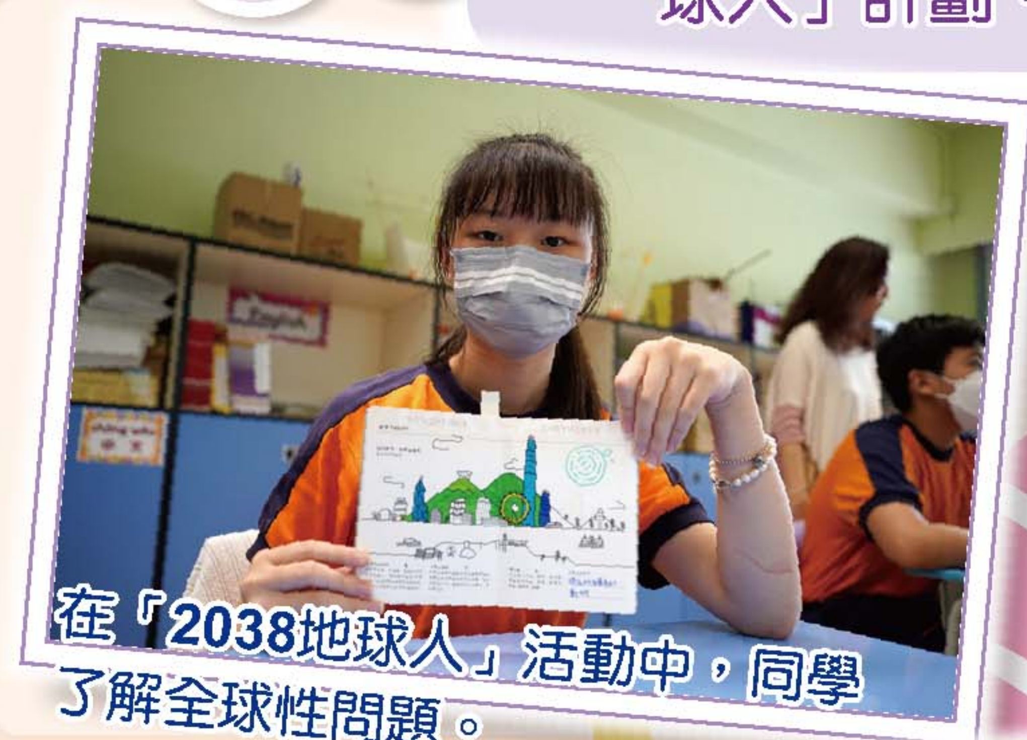
在「2038地球人」活動中，同學了解全球性問題。

六年級的主題為「放眼世界」，同學會進行旅遊推廣，透過介紹不同地方的旅遊景點，除了讓他們了解各地的文化特色外，亦可培訓學生介紹說明的技巧，以及加強協作能力。同時，為配合可持續發展的教育目標，學校參與了「2038地球人」計劃，讓學生認識全球性的問題，培養良好的消費意識。