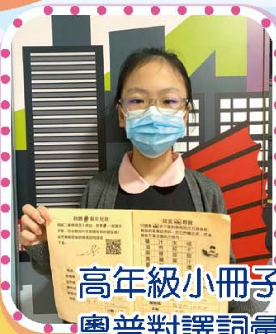
高年級小冊子以「粵普對譯 (春節篇)」、「粵普對譯 (端午節篇)」及「語法」為題，同學可以學習有關節目的粵普對譯詞彙外，亦可加深對語法的認識。