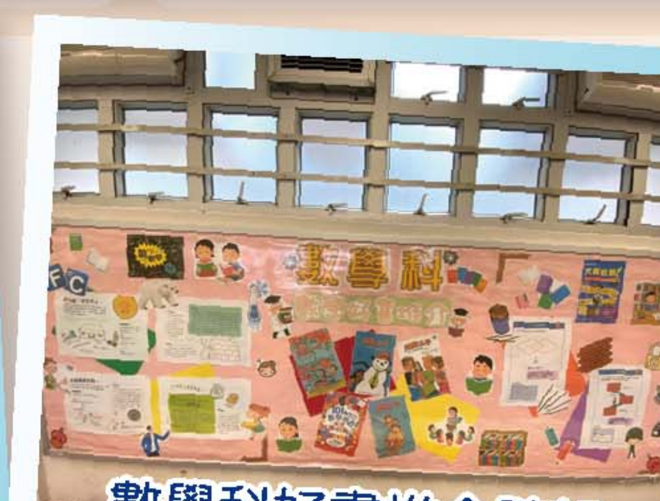
數學科好書推介壁報