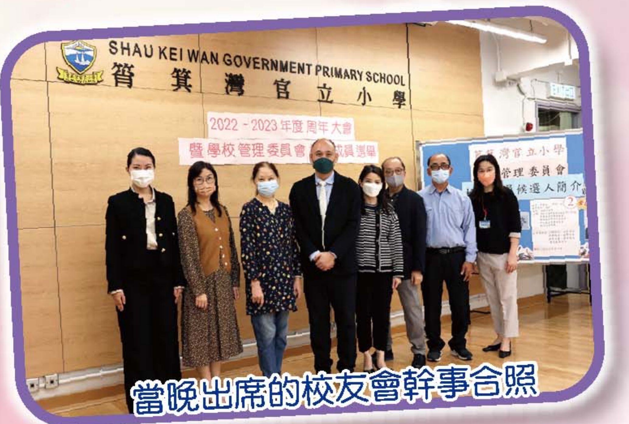
當晚出席的校友會幹事合照