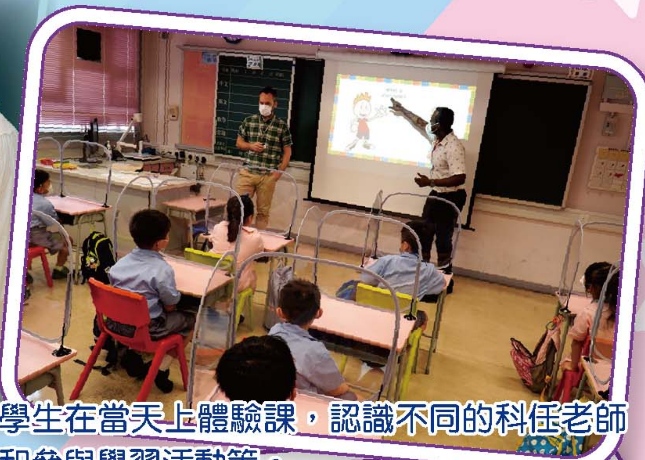
學生在當天上體驗課，認識不同的科任老師和參與學習活動等。