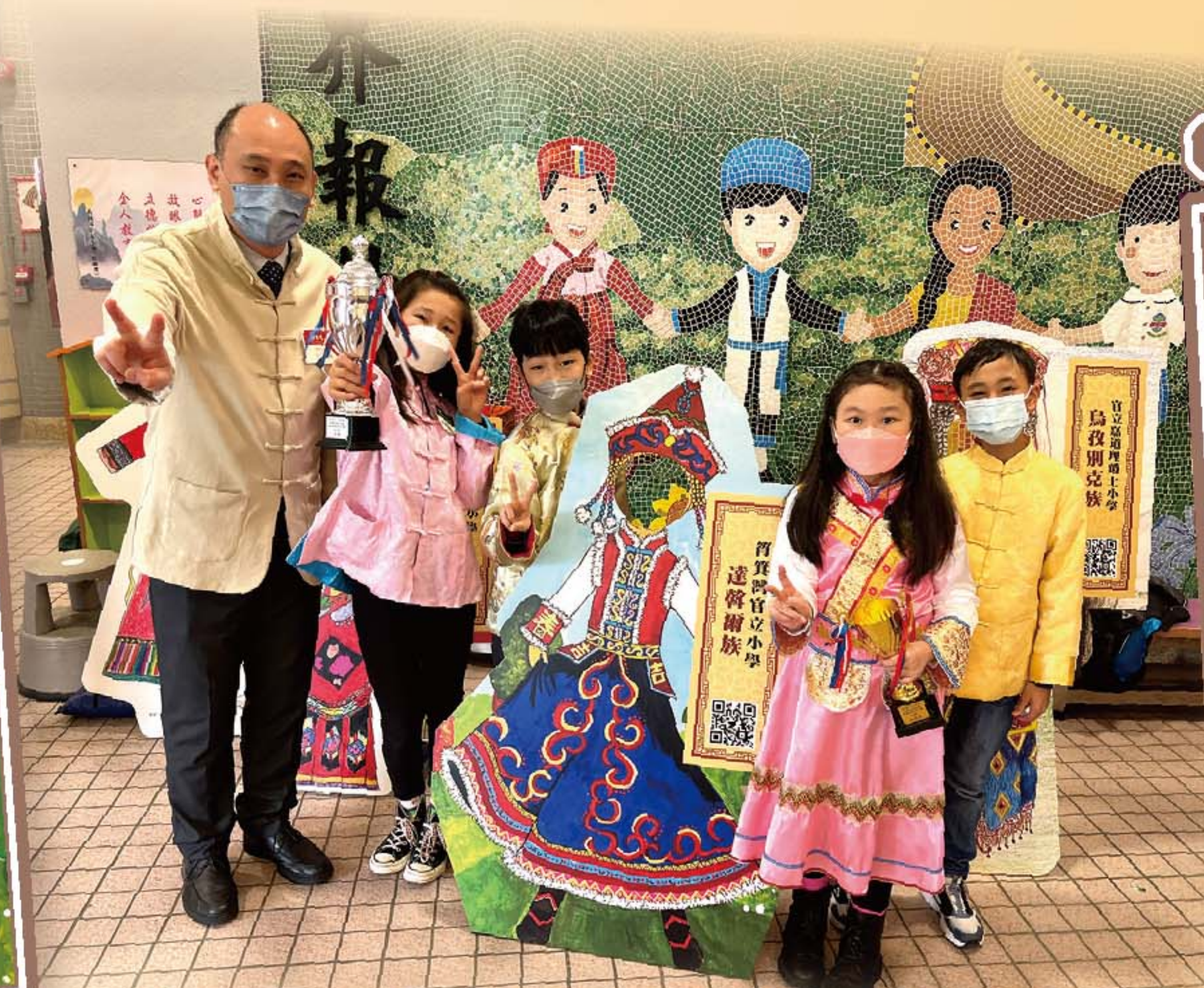
王校長在頒獎禮後與得獎學生一同拍照留念。