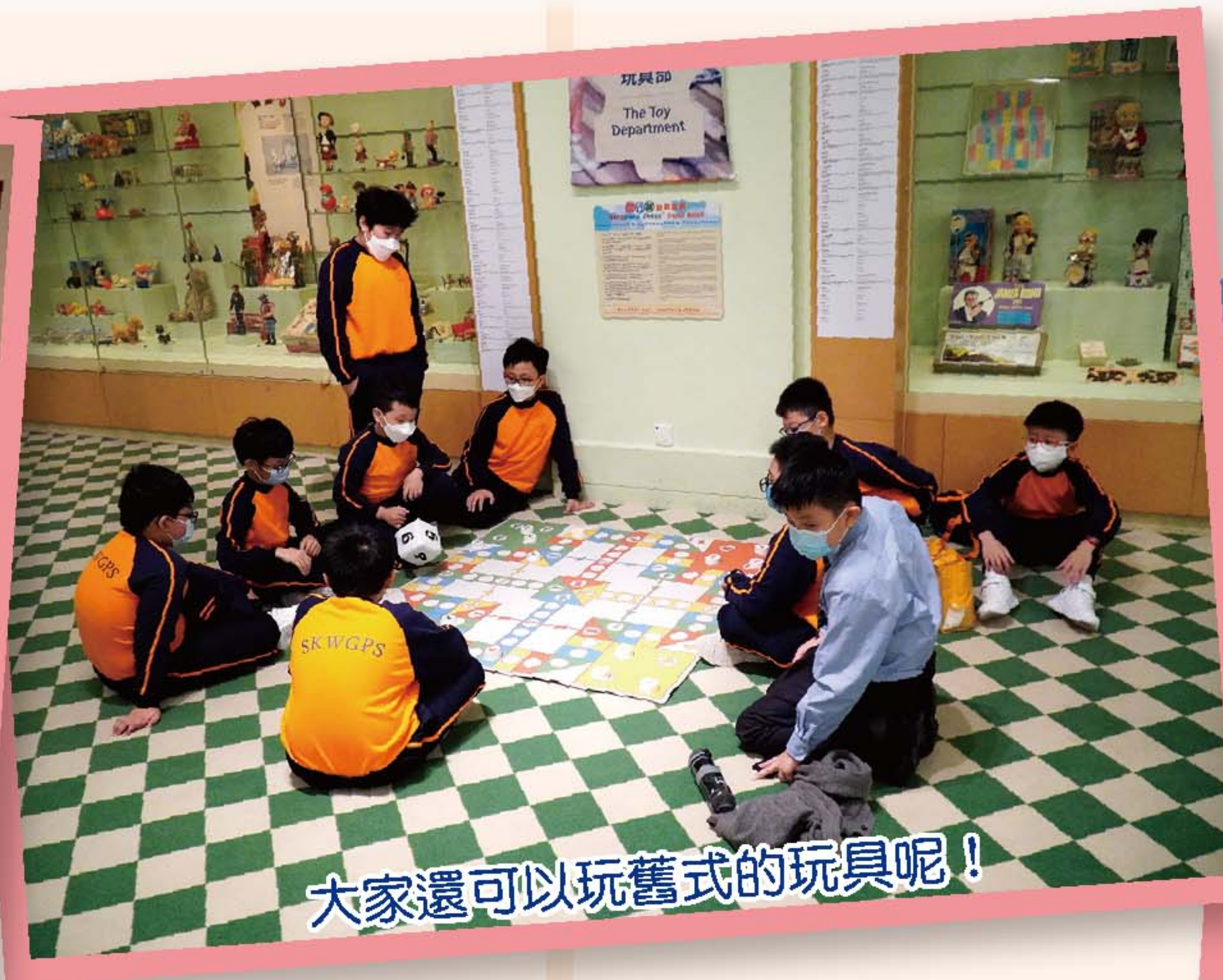
大家還可以玩舊式的玩具呢！