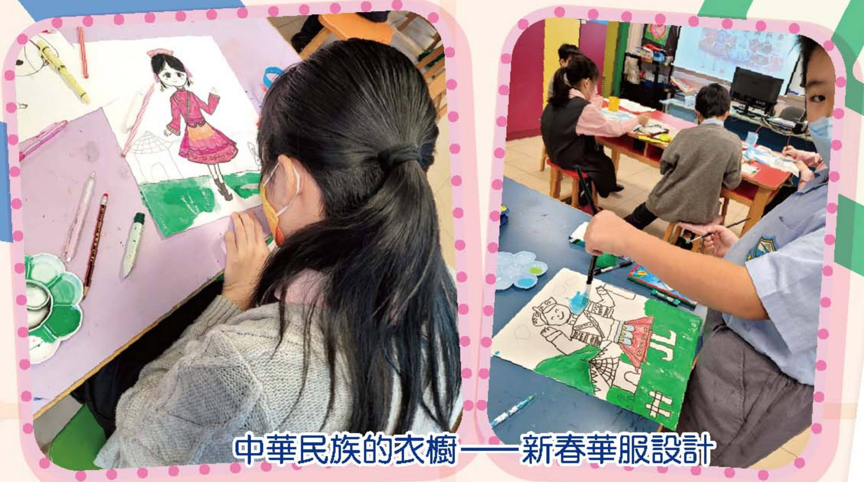
中華民族的衣櫥——新春華服設計

本校視覺藝術科課堂內容豐富，除了藉著不同課題學習多方面的藝術知識外，還透過多種藝術媒介及多元藝術學習經歷，例如參觀香港視覺藝術教育節2023、參與「心繫家國」——官立中、小學聯校標誌設計比賽及2023國家安全標語創作及海報設計比賽等，以擴展學生接觸不同的藝術範疇，照顧學生的學習多樣性，發展學生的藝術觸覺、創意、技能及欣賞藝術的能力，啟發學生的創意思維及想像力，使他們成為懂得欣賞藝術，享受藝術，以藝術表達自己的新一代。