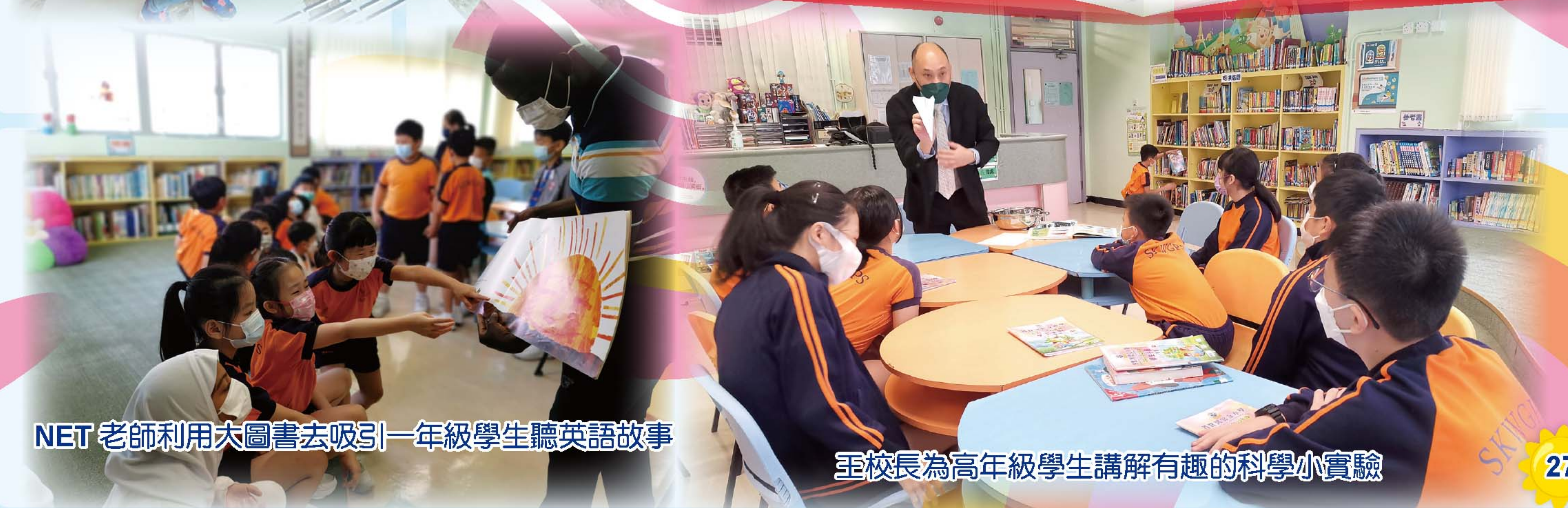
NET 老師利用大圖書去吸引一年級學生聽英語故事