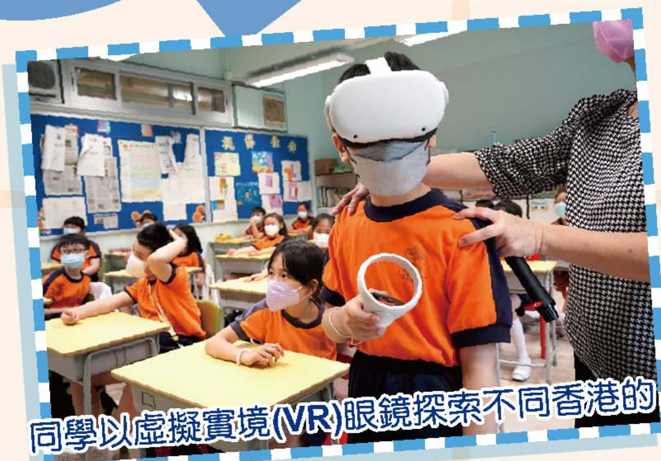
同學以虛擬實境(VR)眼鏡探索不同香港的景點。

四年級以「香港好去處」為主題，讓學生介紹香港的景點及聆聽別人的匯報，加上詩詞的創作，從而提升聽說能力、創造力及寫作能力，並培養欣賞和珍惜的良好品德。