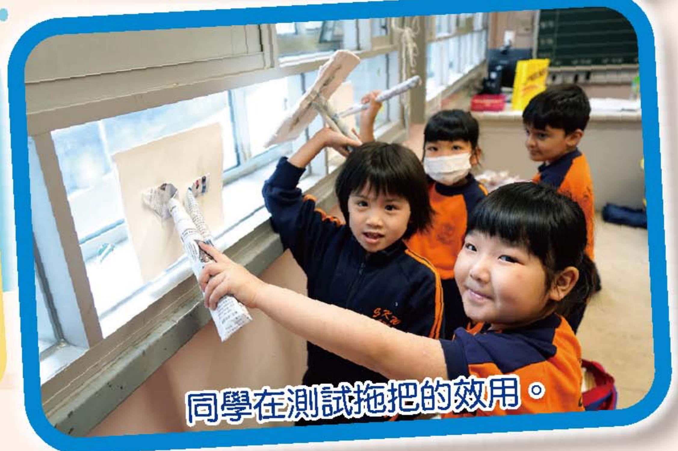
同學在測試拖把的效用。