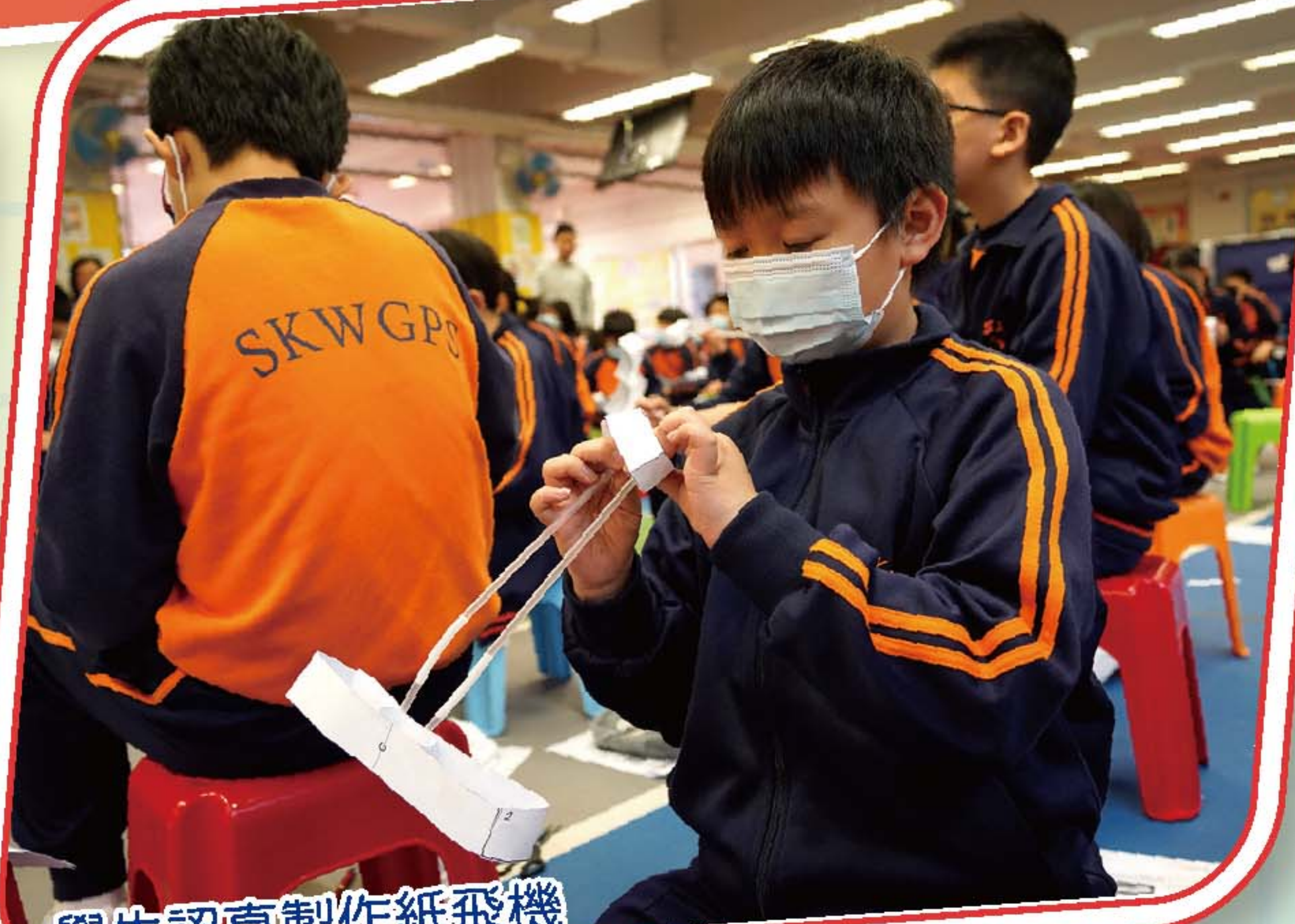
學生認真製作紙飛機