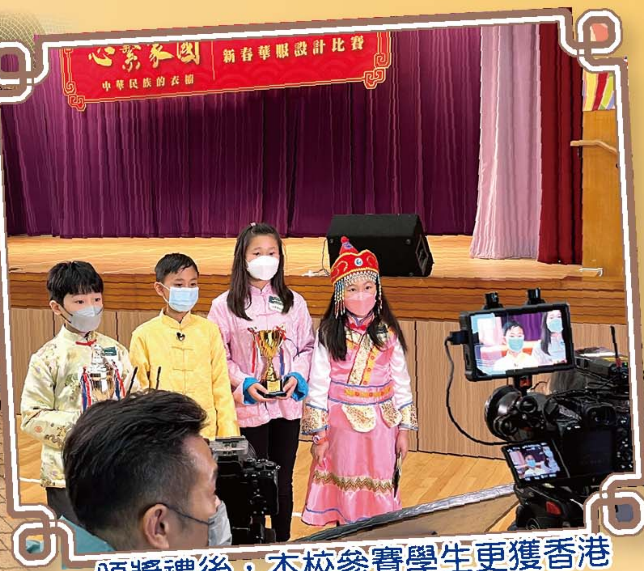
頒獎禮後，本校參賽學生更獲香港電台邀請接受採訪