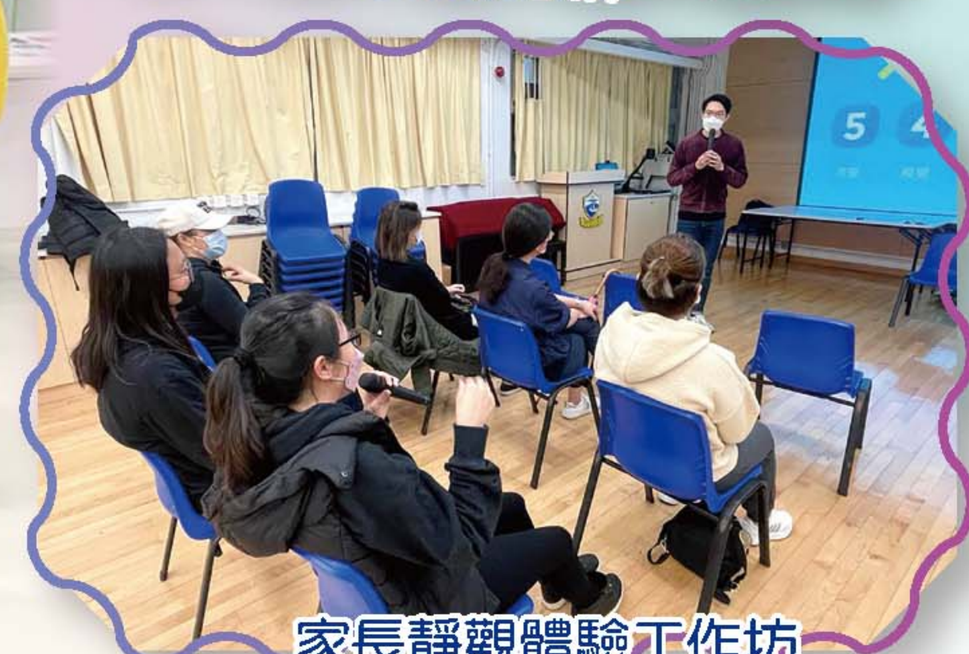
家長靜觀體驗工作坊