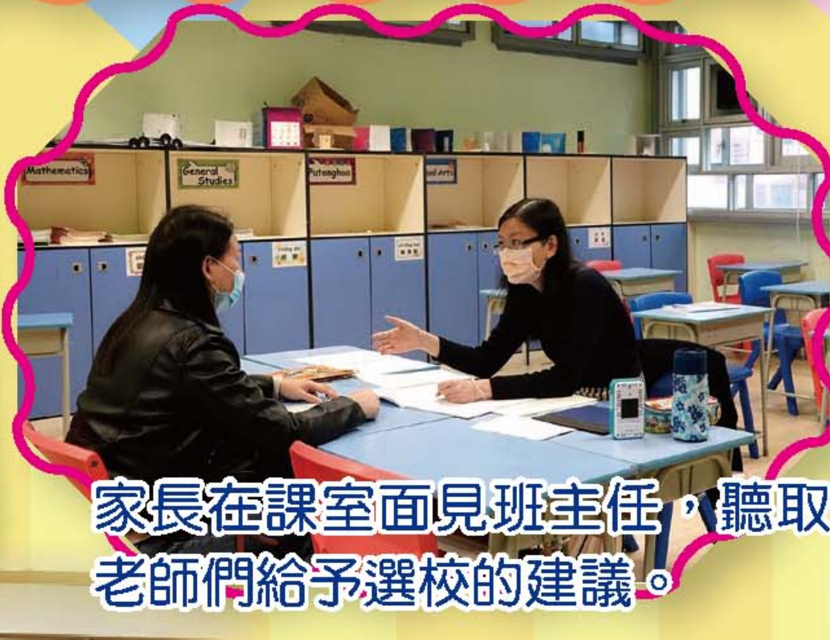
家長在課室面見班主任，聽取老師們給予選校的建議。