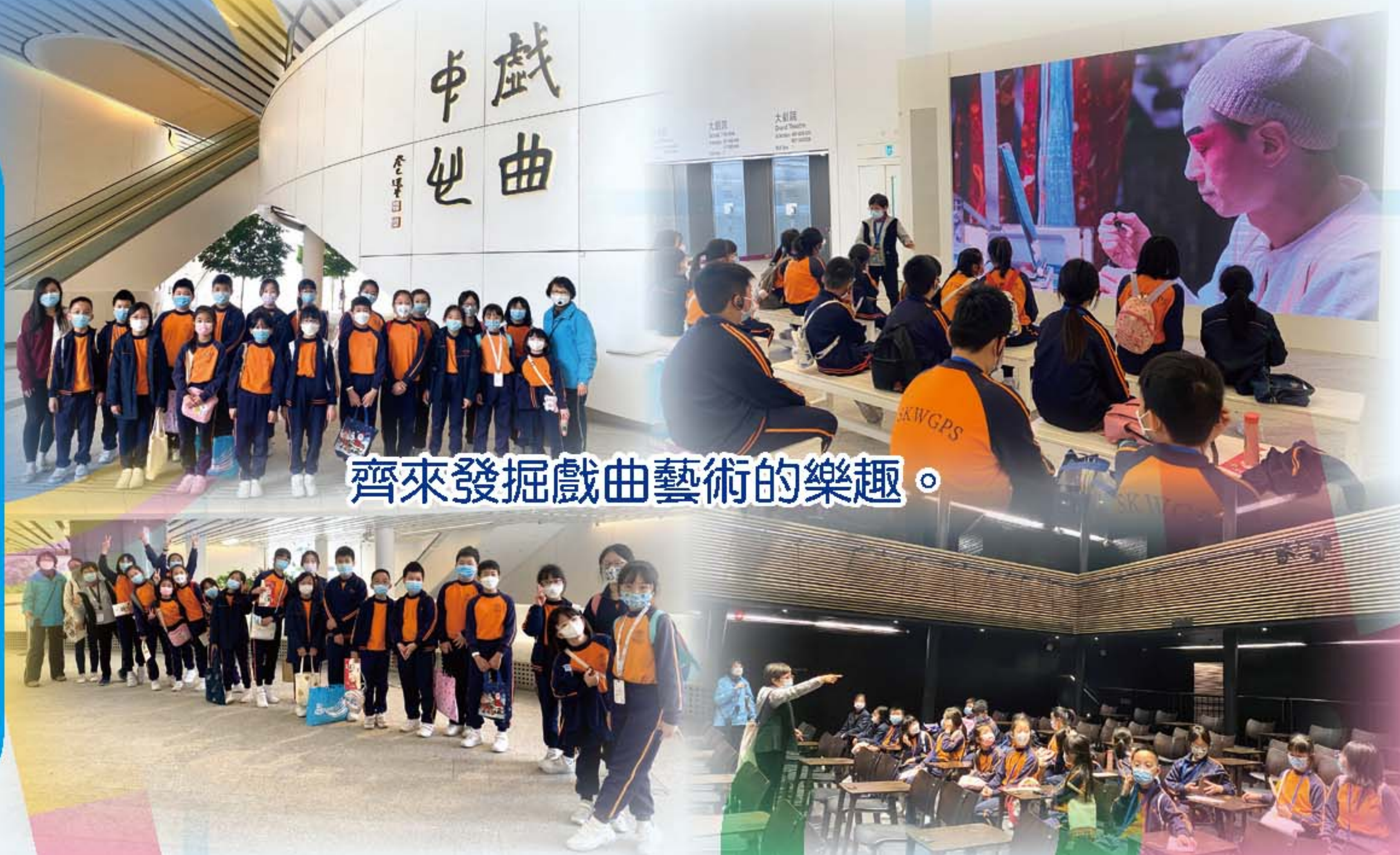
齊來發掘戲曲藝術的樂趣。

為了增加學生接觸普通話的機會，加深他們對中華文化的認識，本科特別安排四年級同學於3月7日參觀西九文化區戲曲中心。學生細心聆聽導賞員以普通話講解有關戲曲的有趣知識，發掘這傳統藝術的樂趣，又走進茶館劇場感受觀賞粵劇的情景，加深認識承載了千年文化的戲曲藝術。