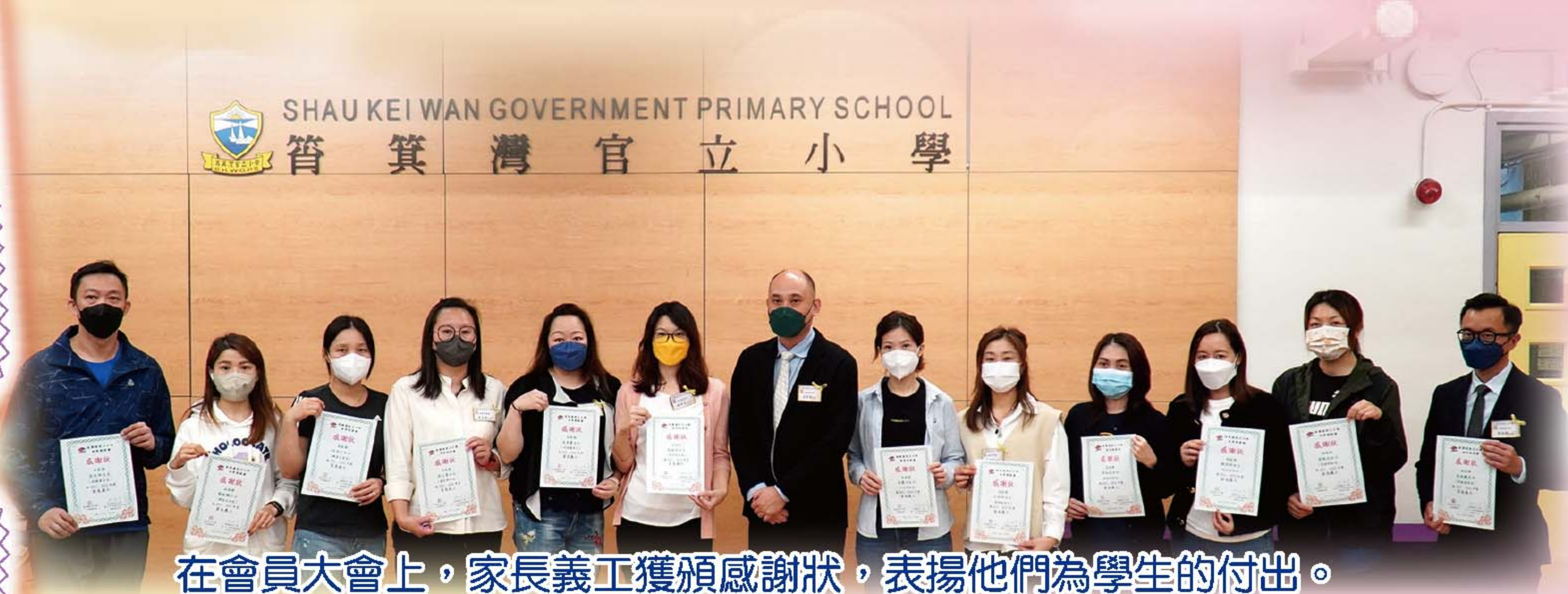
在會員大會上，家長義工獲頒感謝狀，表揚他們為學生的付出。