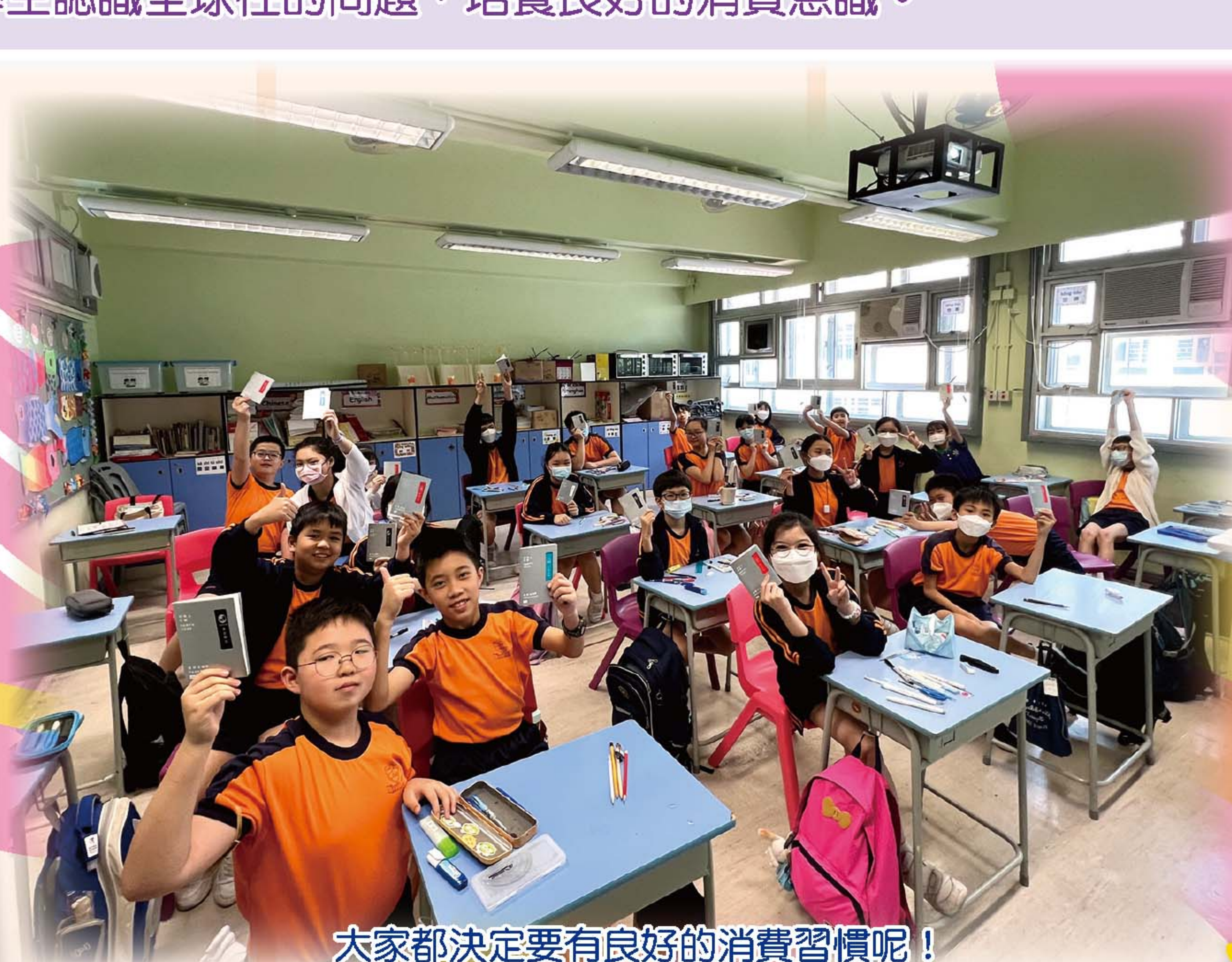
大家都決定要有良好的消費習慣呢！