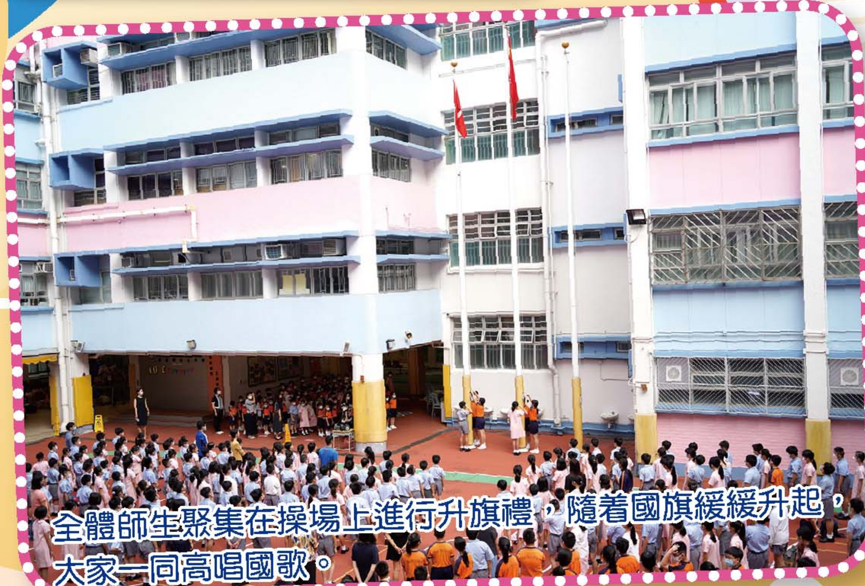
全體師生聚集在操場上進行升旗禮，隨着國旗緩緩升起，大家一同高唱國歌。