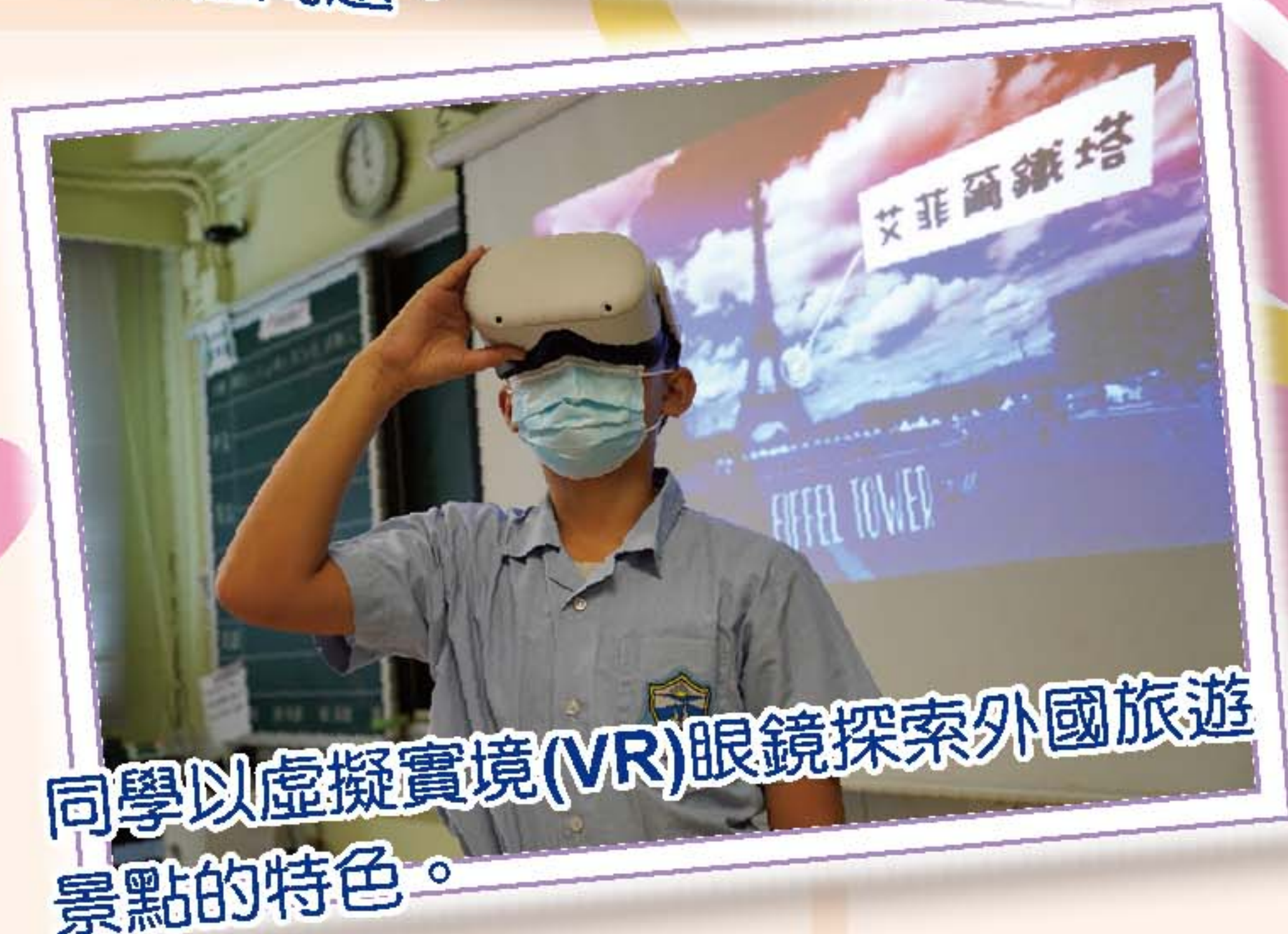
同學以虛擬實境(VR)眼鏡探索外國旅遊景點的特色。