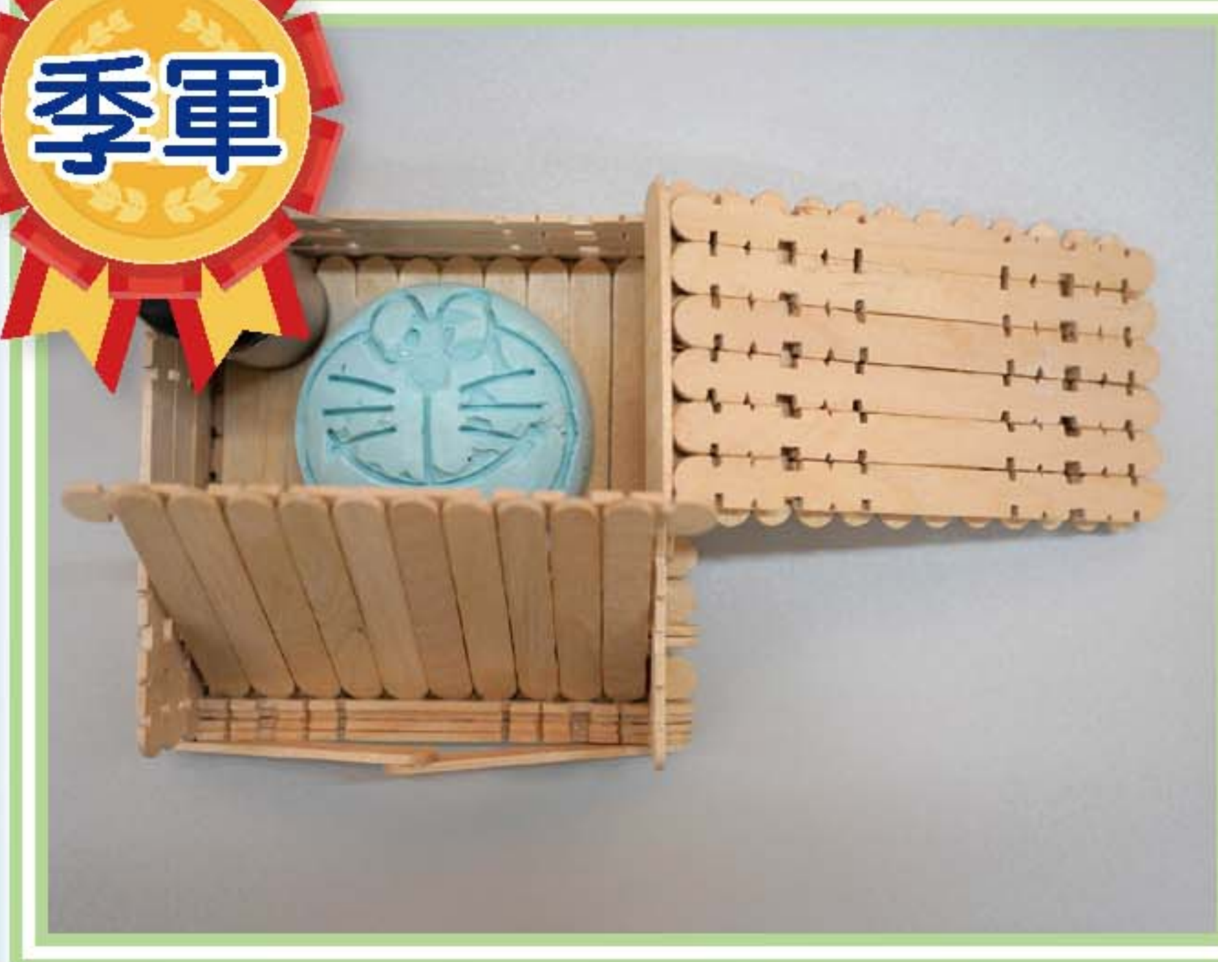
香精手機架 (1B 蔡汶峻)