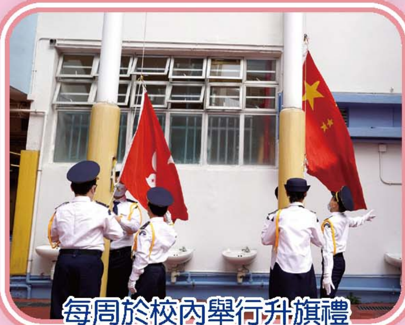
每周於校內舉行升旗禮

本校升旗隊負責每天早上在校園升起國旗和區旗。每周的升旗禮，升旗隊隊員會穿著整齊的制服進行升旗儀式。升旗隊的隊員亦積極參加香港升旗隊總會的訓練，藉此培養紀律性和責任感，期望提高隊員的團隊協作能力和自信心。