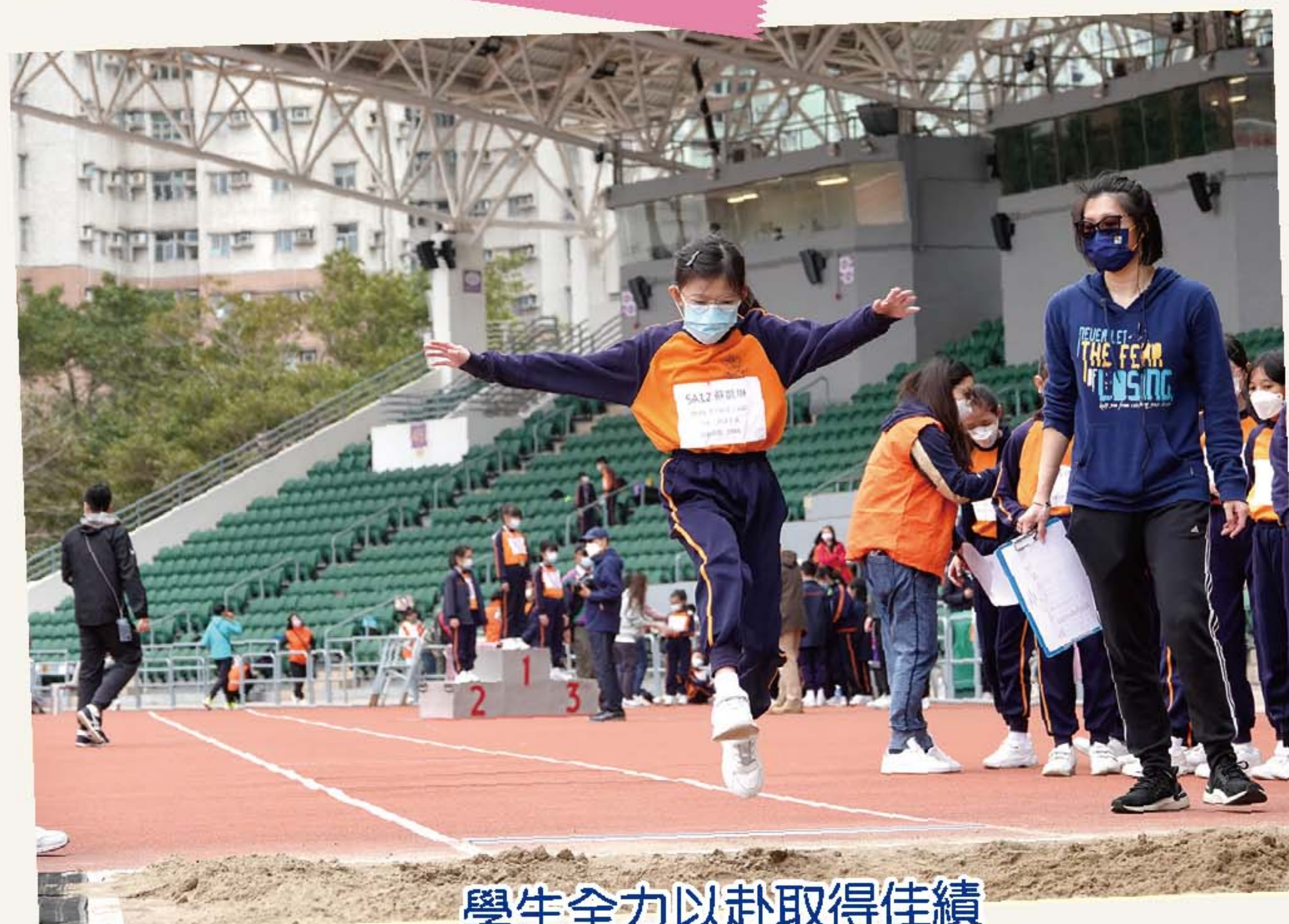
學生全力以赴取得佳績