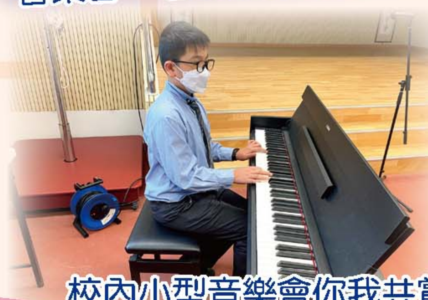
校內小型音樂會你我共賞，學生利用不同的樂器表演，十分投入。