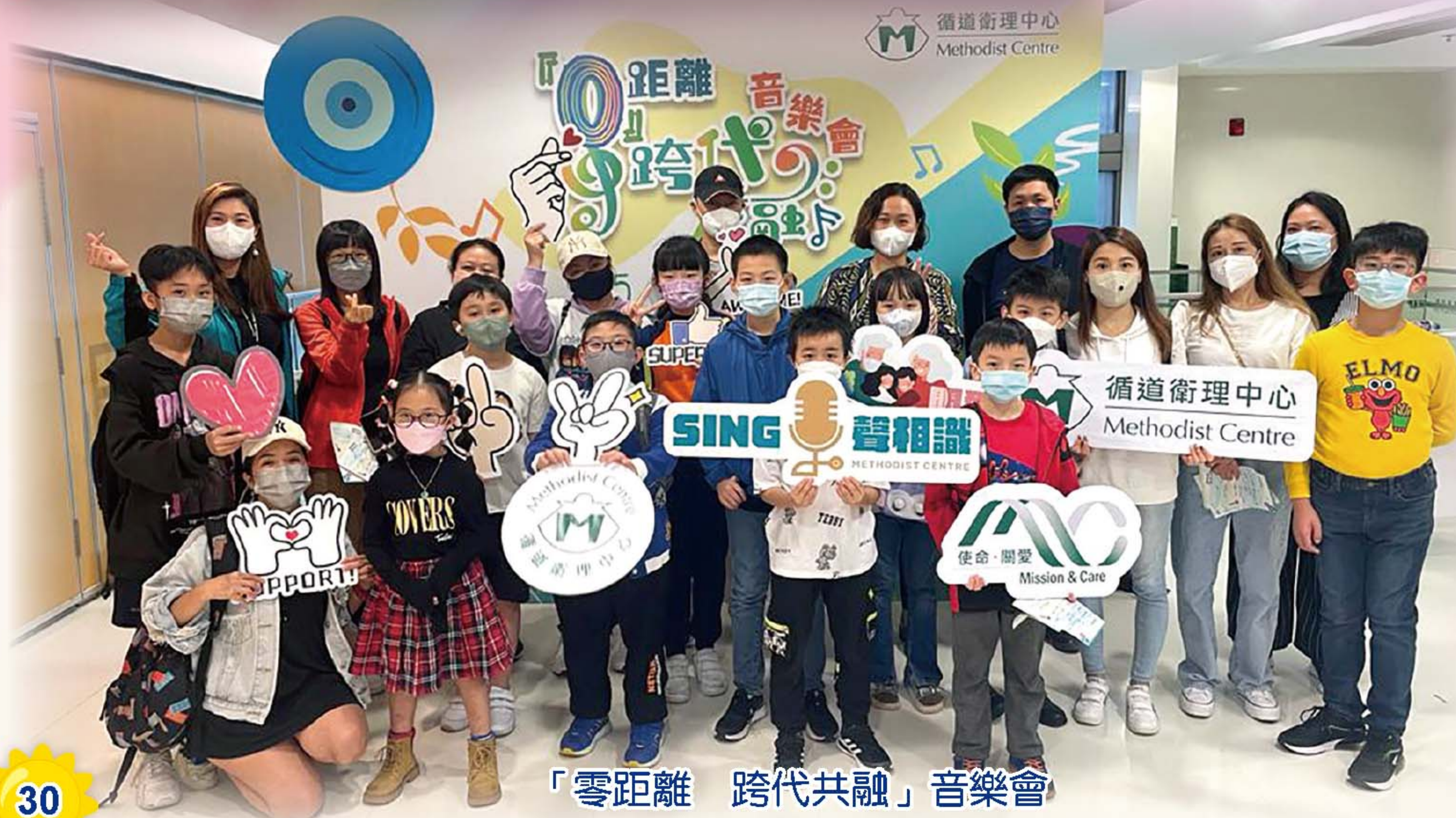
「零距離 跨代共融」音樂會