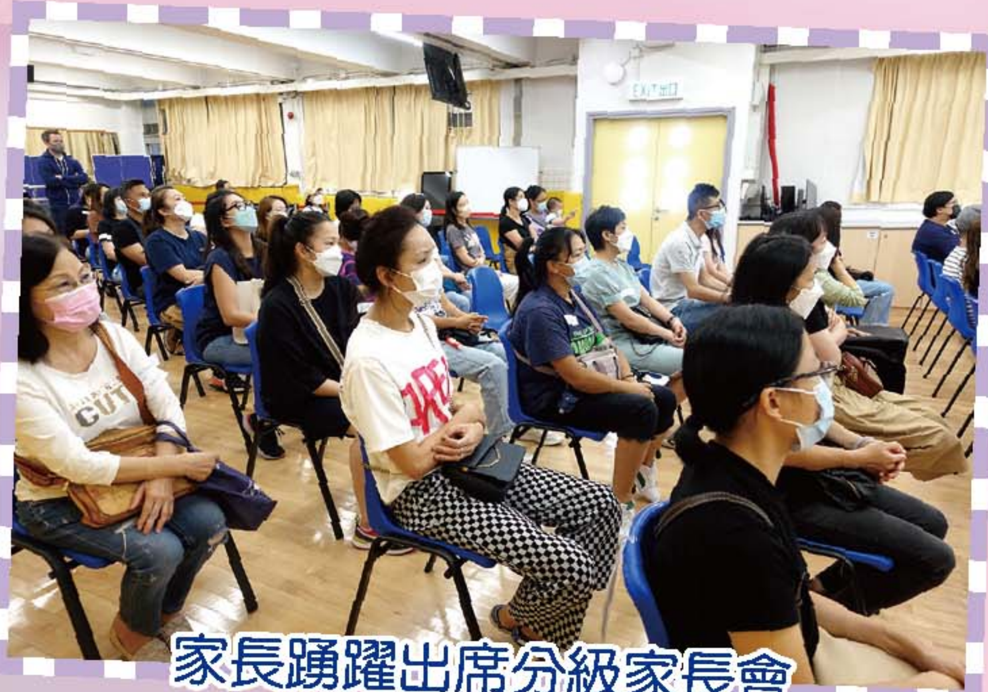
家長踴躍出席分級家長會