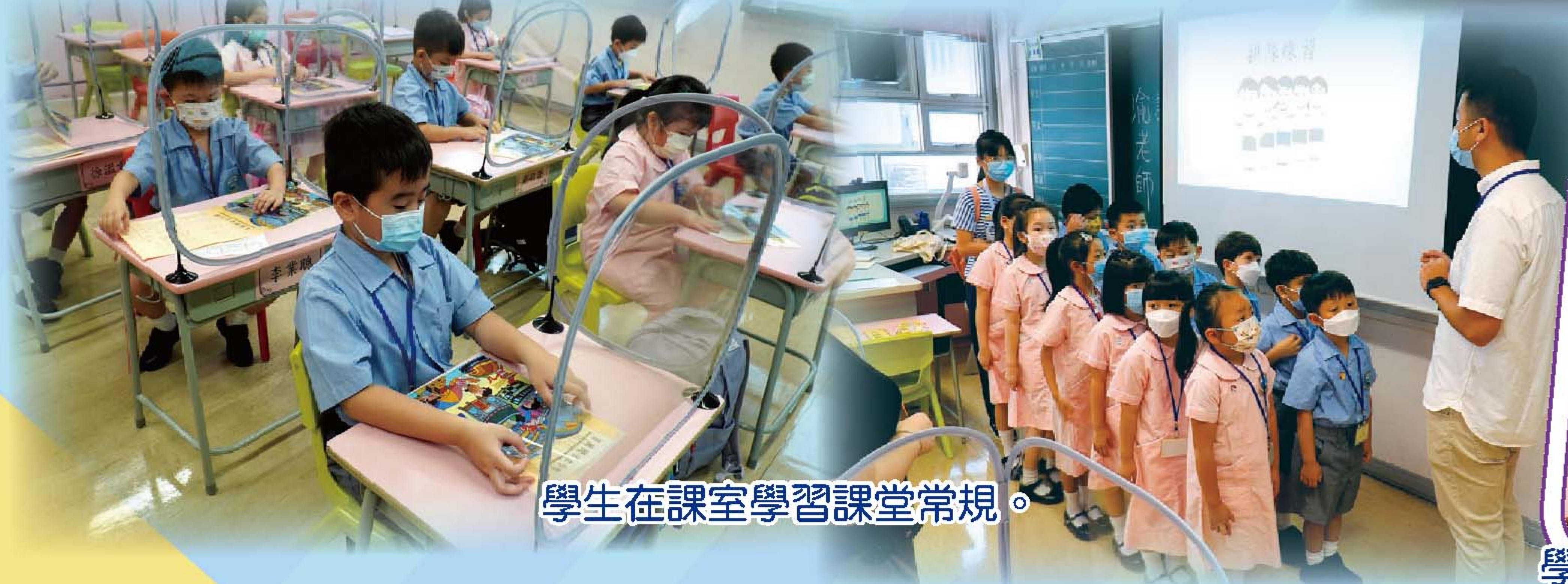
學生在課室學習課堂常規。