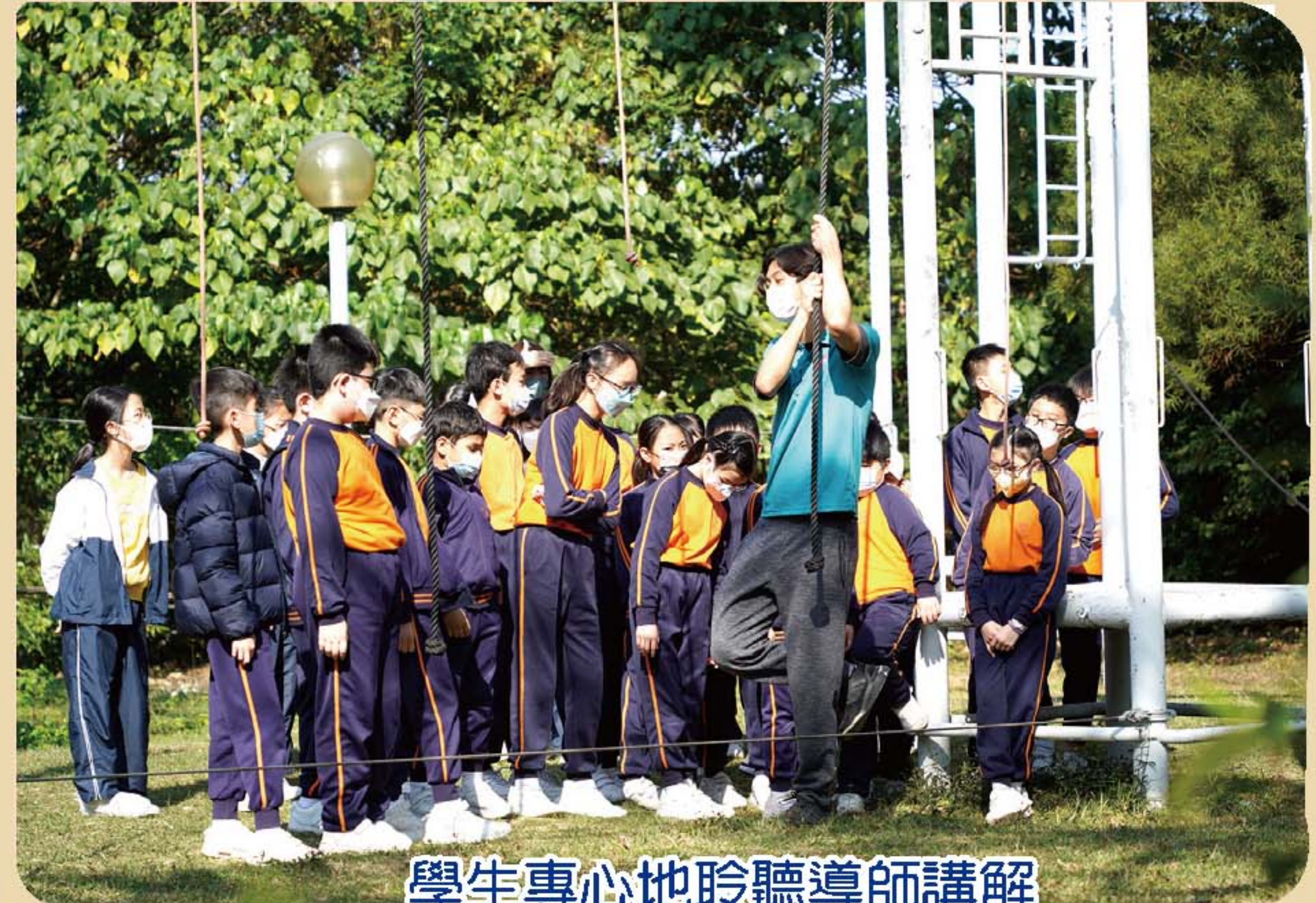
學生專心地聆聽導師講解