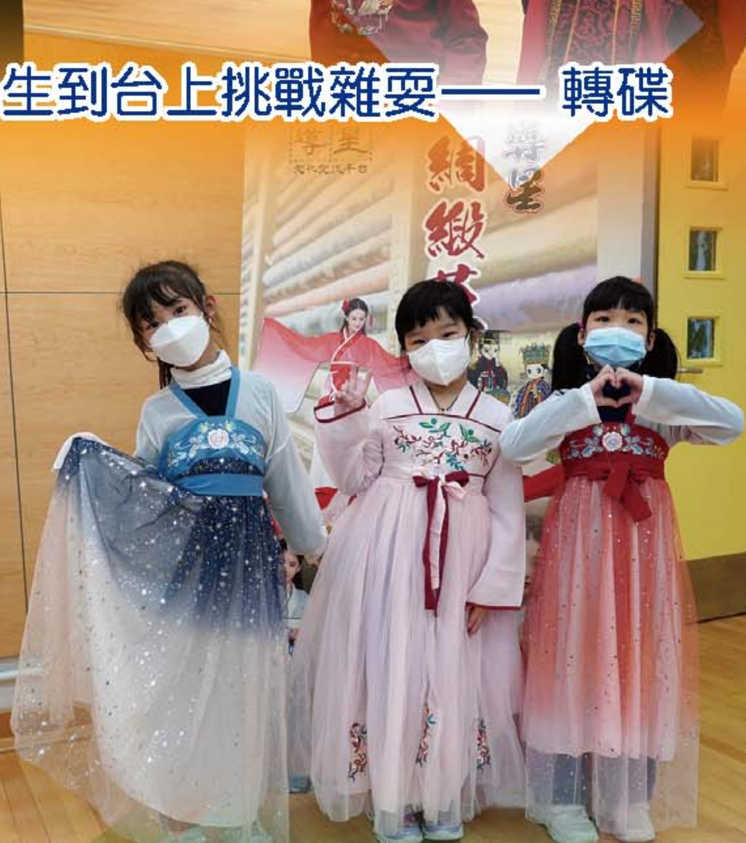
學生試穿古代服裝