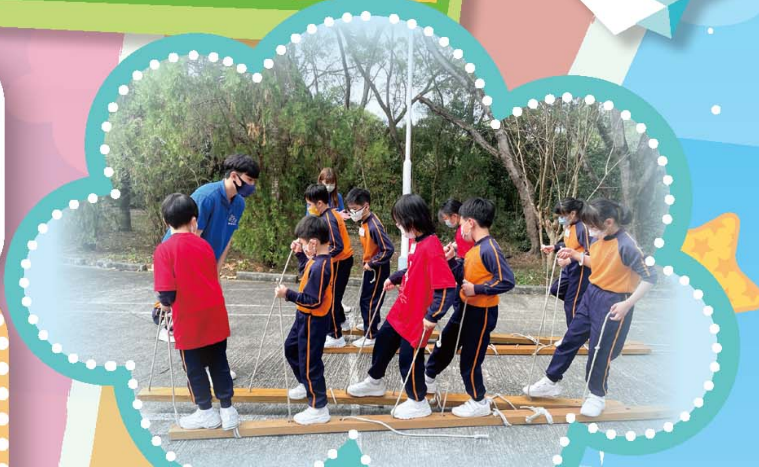
透過參與歷奇活動，藉以提升學生的抗逆力及自信心。

成長的天空計劃（小學）為小四至小六學生提供「發展課程」協助學生掌握面對逆境的知識、技能和態度，激勵他們積極面對成長中可能遇到的挑戰。