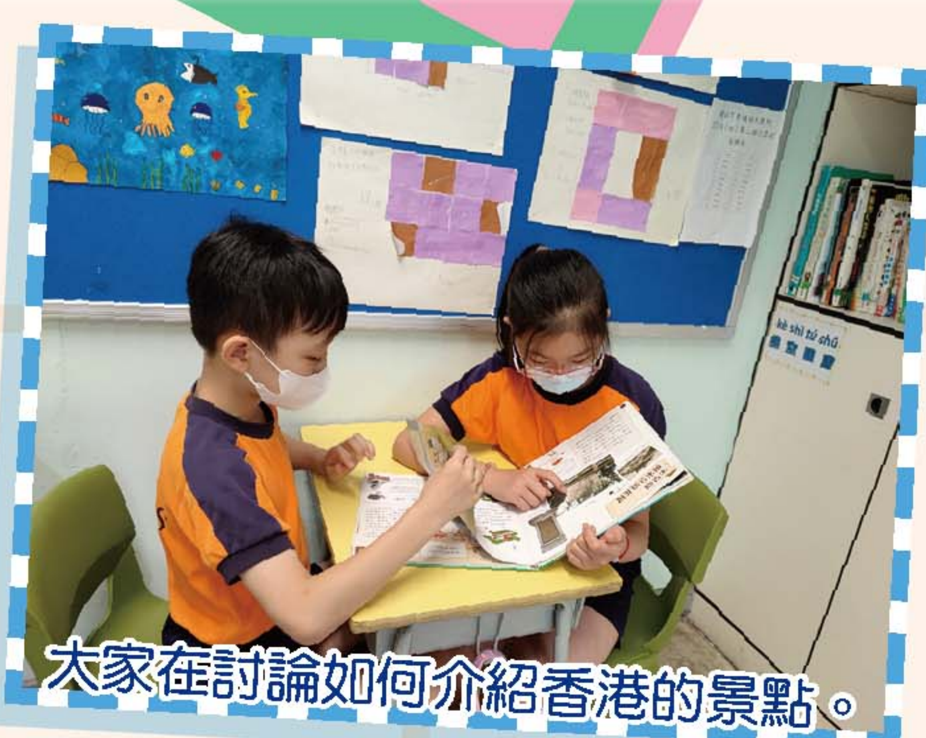
大家在討論如何介紹香港的景點。