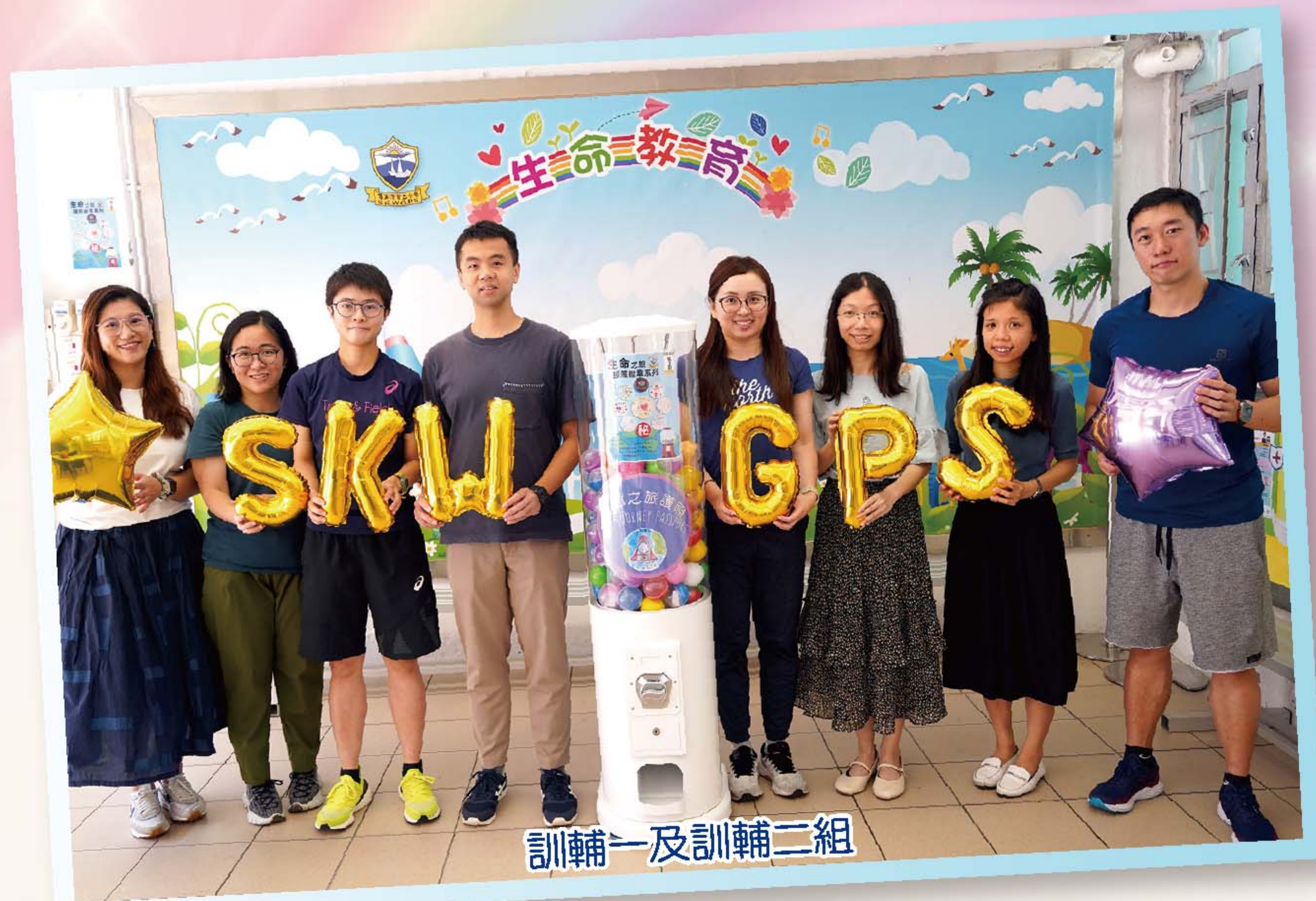
訓輔一及訓輔二組