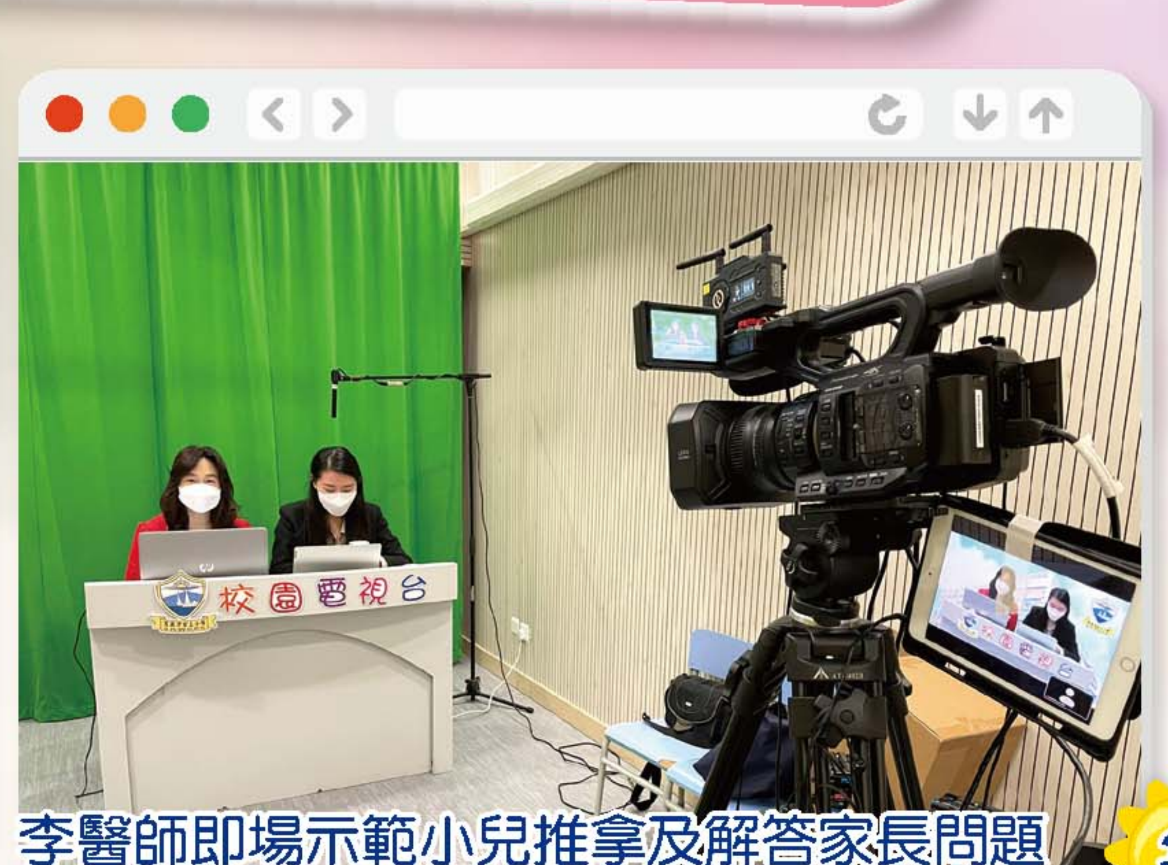
李醫師即場示範小兒推拿及解答家長問題