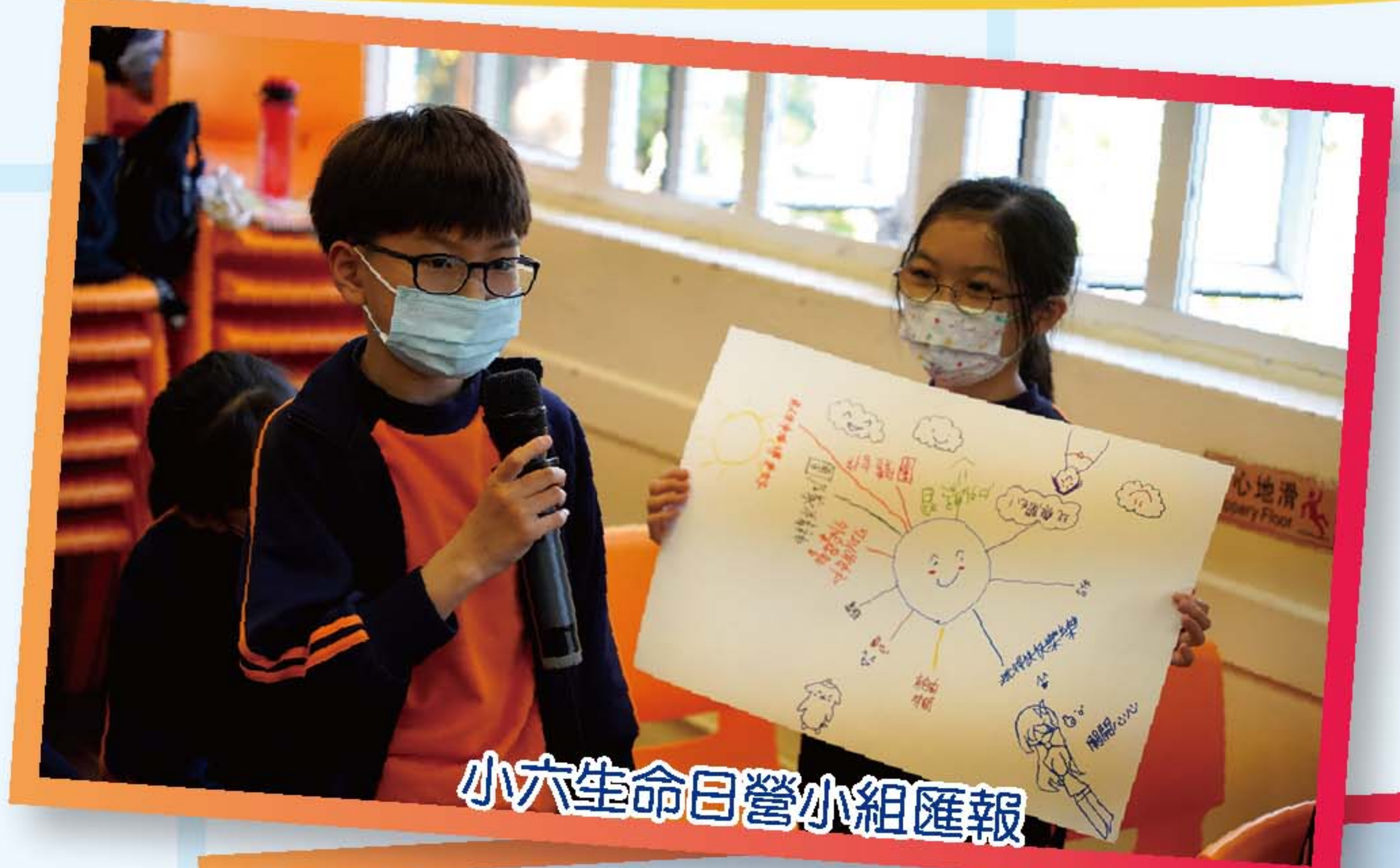
小六生命日營小組匯報