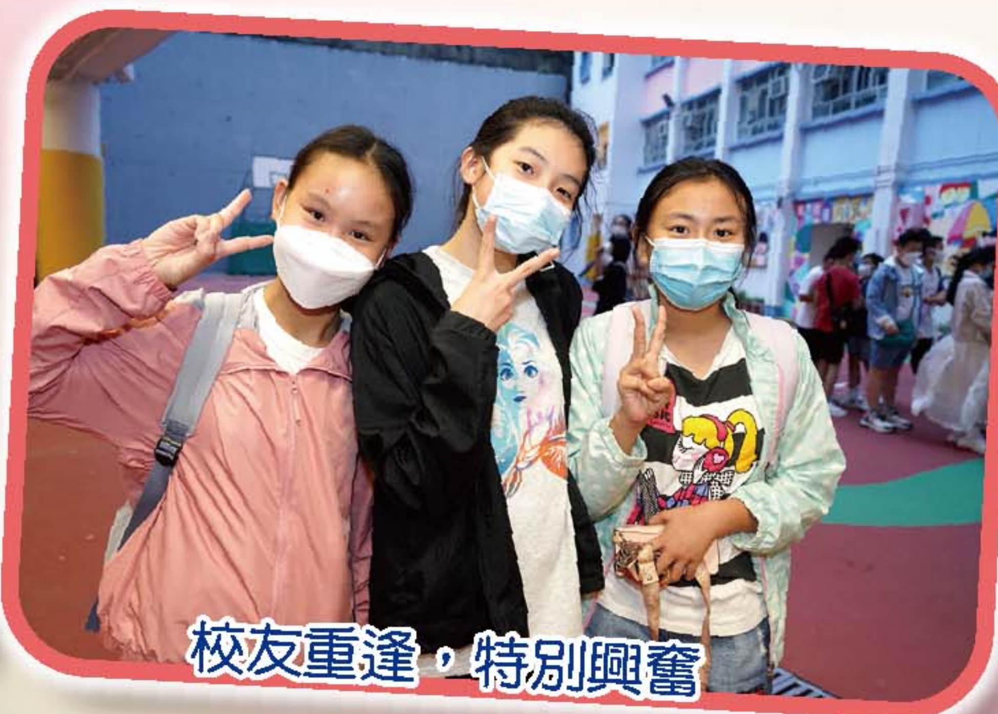
校友重逢，特別興奮