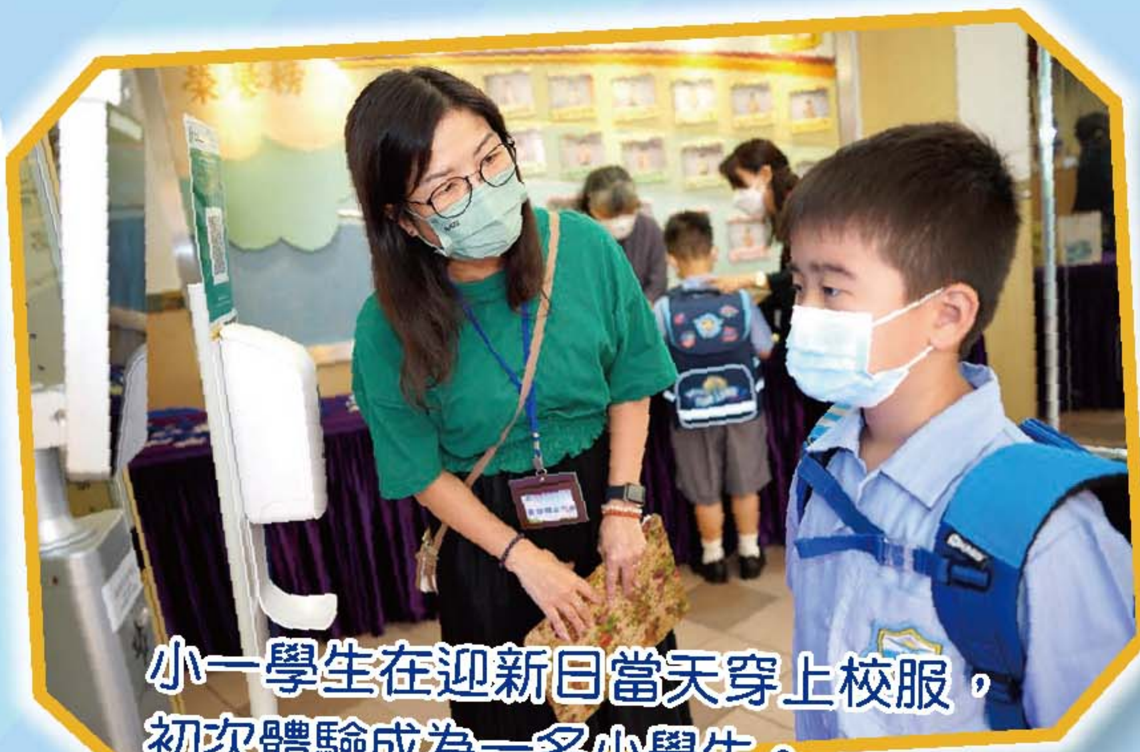
小一學生在迎新日當天穿上校服，初次體驗成為一名小學生。

新學年，一群校園新丁踏入筲小的校園。為幫助小一同學融入筲小生活，學校在8月份暑假期間，為小一同學舉辦了小一迎新日。一年級同學跟着老師的帶領參觀校園，到課室上體驗課，學習課室常規，讓同學為開學做好準備。當天學校亦邀請家長參加講座，希望藉此加深家長對學校的了解。