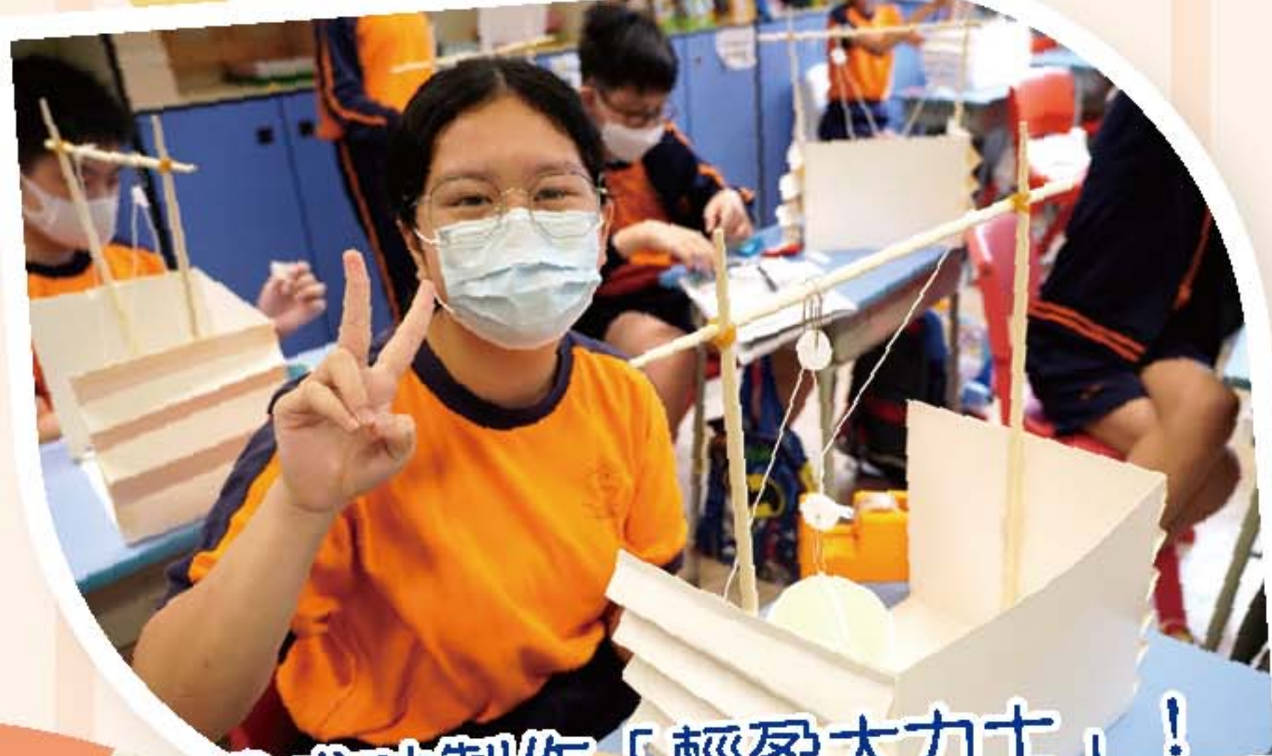
我成功製作「輕盈大力士」！