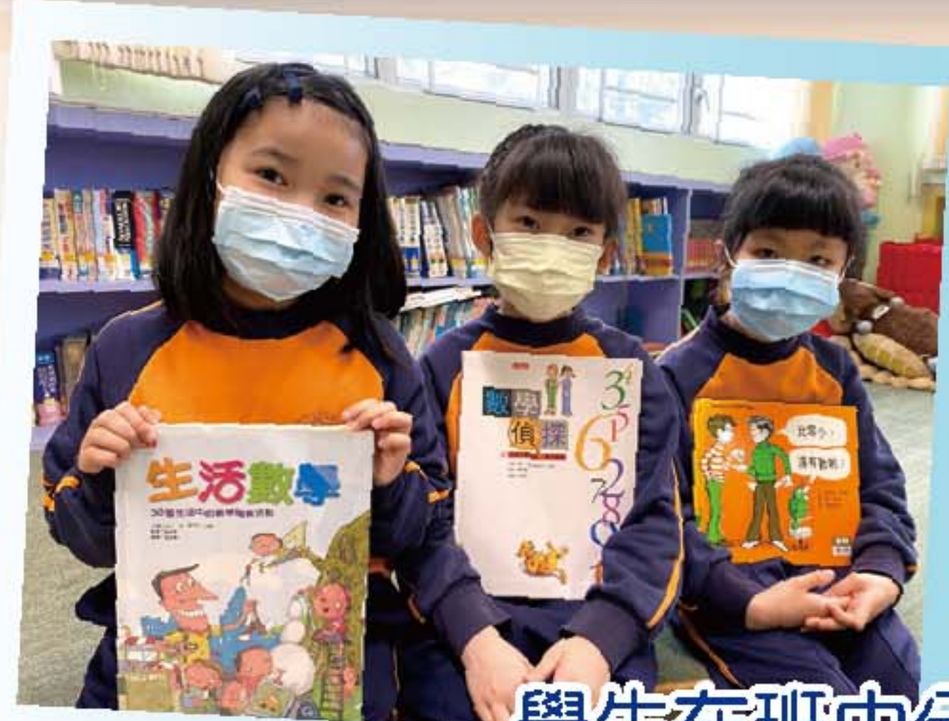
學生在班中分享不同的數學故事

本學年，數學科於全校推行「數學圖書閱讀分享」活動，鼓勵學生透過閱讀去學習不同的數學知識及技能，提升學生的邏輯思維能力、自主學習能力及解難能力。數學組於校園電視台及校內壁報板向學生推介有趣的數學圖書及繪本，亦鼓勵學生在班中分享不同的數學故事，引發他們對數學的興趣，領悟數學的規律及概念。