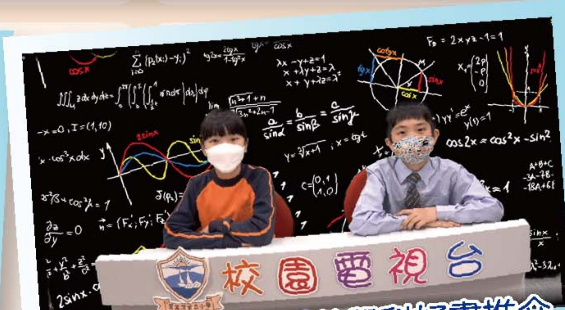
校園電視台——數學科好書推介