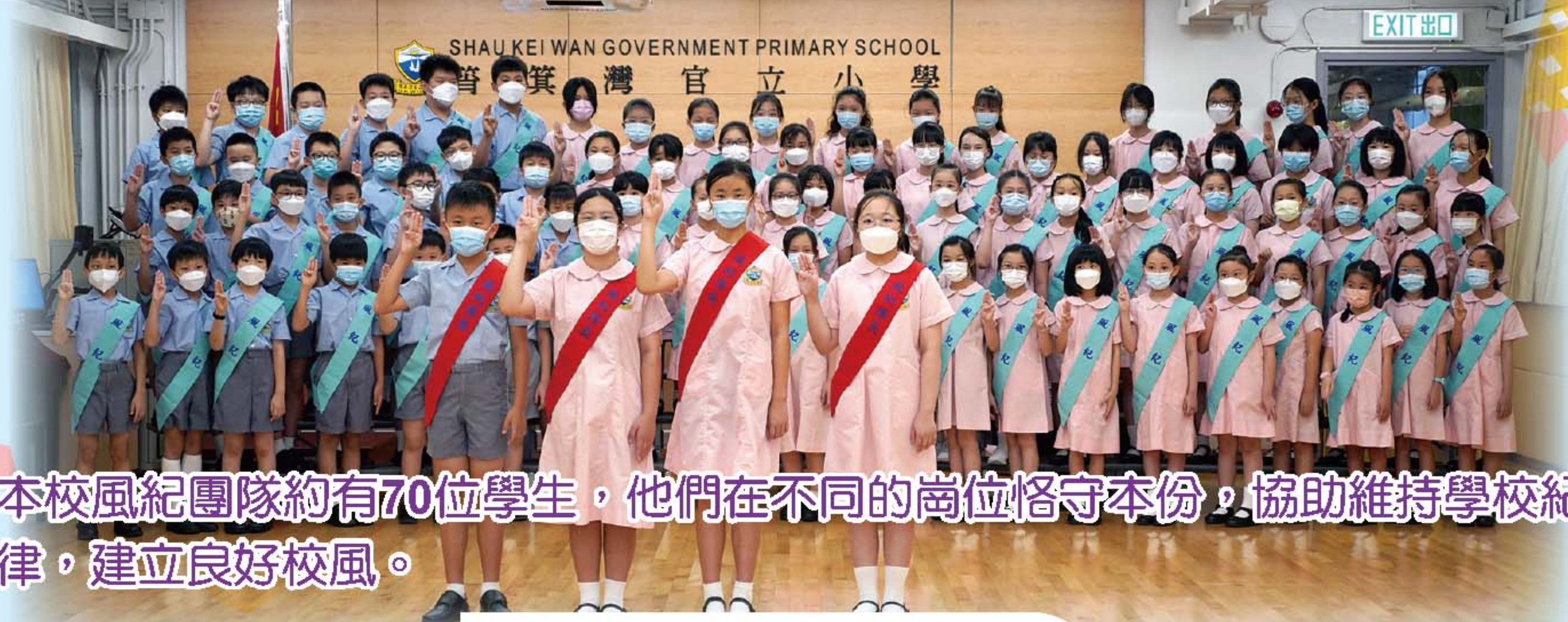
本校風紀團隊約有70位學生，他們在不同的崗位恪守本份，協助維持學校紀律，建立良好校風。