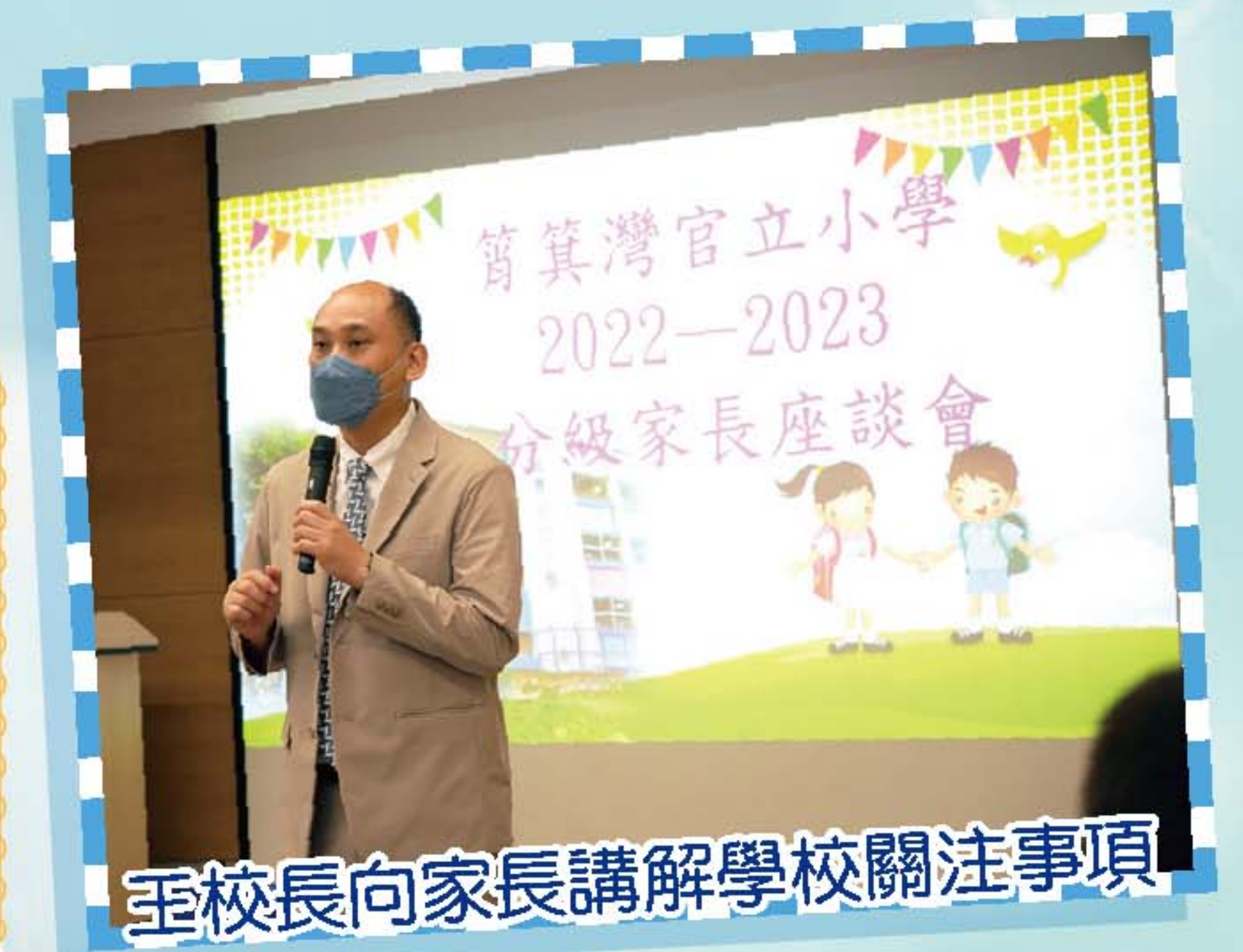
至校長向家長講解學校關注事項

為了加強家長與本校的溝通及聯繫，本年度舉辦了多場分級家長會，向家長講解學校的關注事項、評估事宜等，並因應學生的學習及成長需要，安排合適的內容。其後，本校安排分班面談，與家長交流培育子女的經驗與心得，並鼓勵家長與子女建立親密互信的關係。