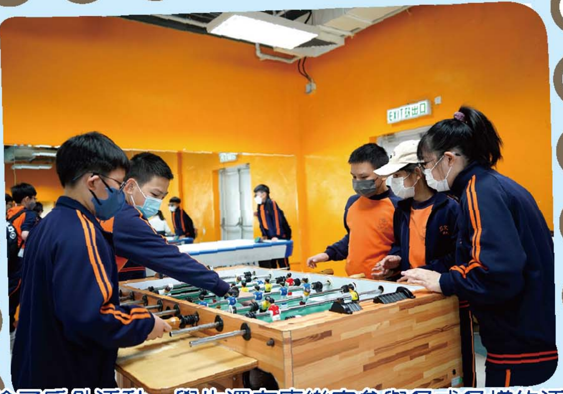
除了戶外活動，學生還在康樂室參與各式各樣的活動