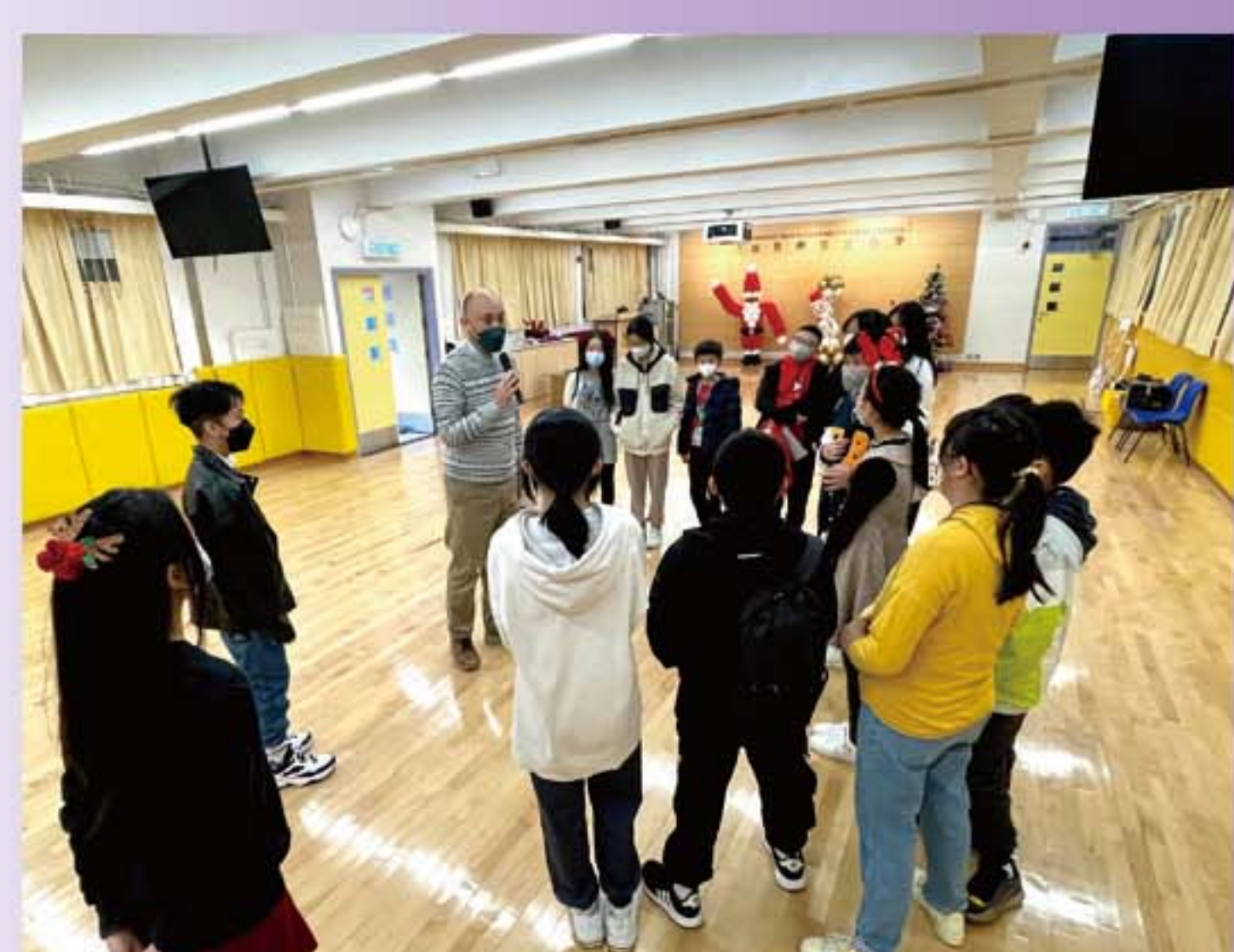
王校長親自表揚義工隊的服務表現出色。

愛心義工隊為「聖誕市集」活動設計並執行兩個攤位遊戲，為筲箕灣區市民帶來快樂聖誕。活動後王校長收到市民親自致電學校讚揚義工隊表現有禮，充滿愛心。王校長更親自表揚義工隊表現出色，鼓勵他們繼續熱心服務。