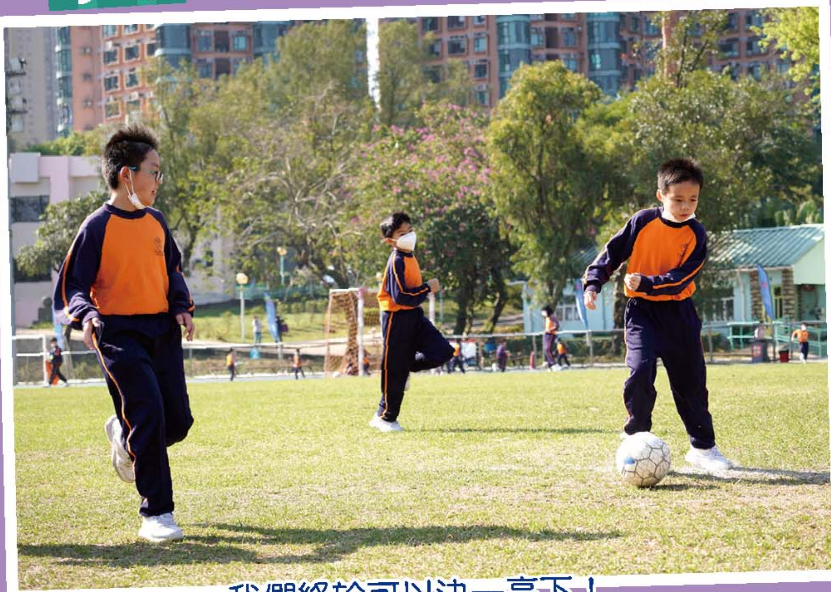
我們終於可以決一高下！