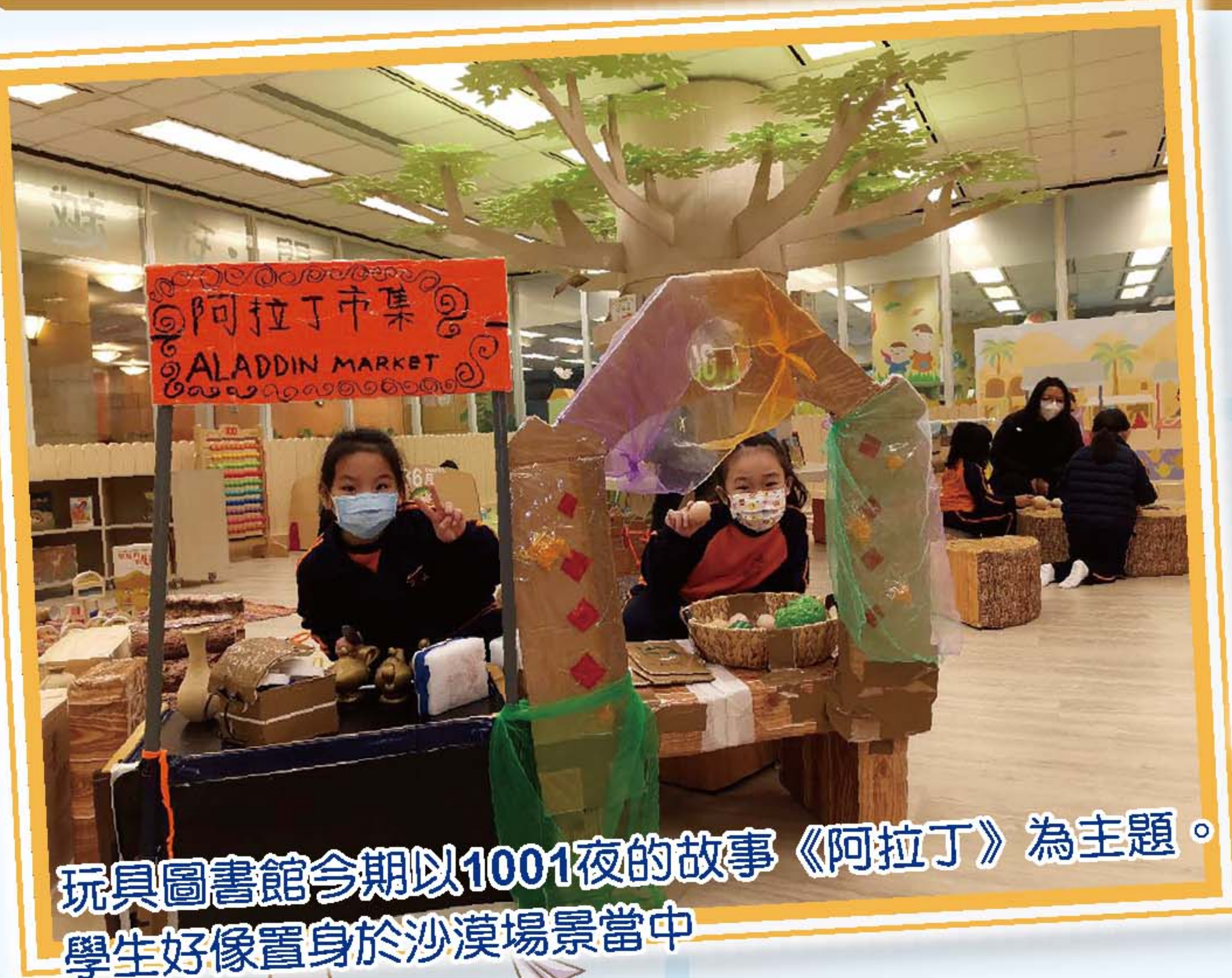
玩具圖書館今期以1001夜的故事《阿拉丁》為主題。 學生好像置身於沙漠場景當中

本校安排小一學生於一月份參觀香港中央圖書館內的玩具圖書館。玩具圖書館以「閱·玩越好玩」的嶄新概念，透過遊戲及玩意引導孩子發揮創意，同時啟發他們對閱讀的興趣。閱讀與遊戲是兒童成長中不可或缺的重要元素。閱讀可以引領他們漫遊世界，延伸想像力。玩具圖書館融合了閱讀與遊戲，為兒童帶來既開心玩樂，又可隨心閱讀的空間，小一學生體驗了不一樣的閱讀旅程。