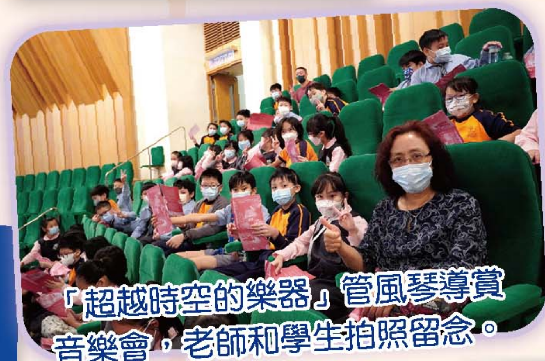
「超越時空的樂器」管風琴導賞音樂會，老師和學生拍照留念。

本校於11月9日安排小四學生參與由康樂及文化事務處在香港文化中心音樂廳舉行的「超時空的樂器」管風琴導賞音樂會，讓同學認識及體會管風琴震撼人心的魅力，同學都十分喜歡是次音樂會；另外，音樂事務處於3月2日在本校禮堂舉行「樂韻播萬千音樂會」，當日音樂事務處的中樂小組導師向學生介紹不同的中國樂器，並演繹不同的歌曲，藉此培養學生對音樂的興趣。此外，一至六年級學生也於2月1日作校內公開表演，節目名為「校內小型音樂會你我共賞」，表演項目如唱歌、樂器演奏等，讓學生展現音樂才能。