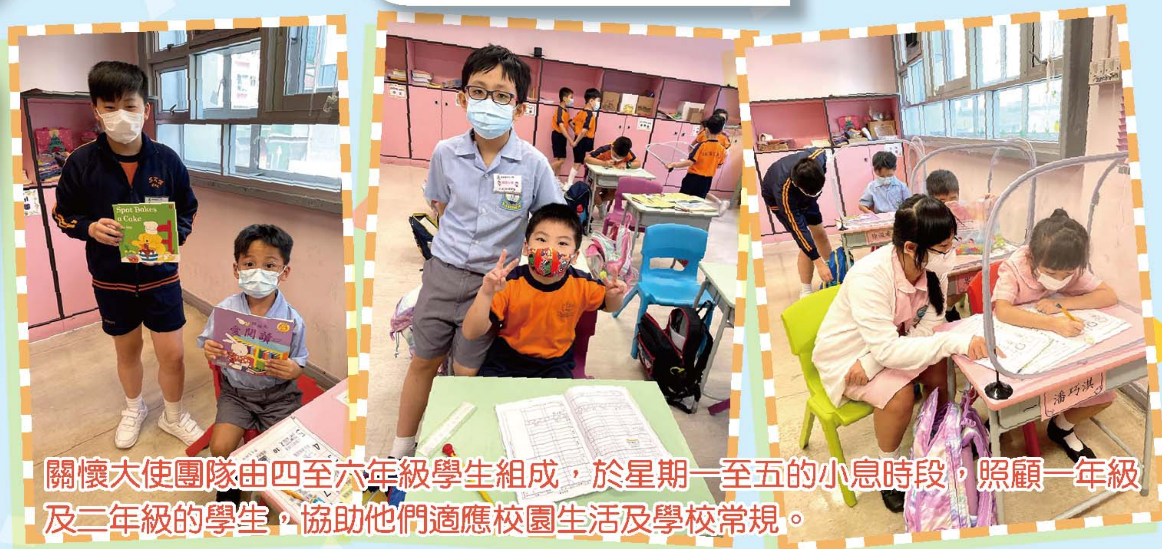
關懷大使團隊由四至六年級學生組成，於星期一至五的小息時段，照顧一年級及二年級的學生，協助他們適應校園生活及學校常規。

隨著防疫措施逐漸放寬，本校的愛心義工隊積極參加不同類型的社區服務，例如「共融遊東大」及「聖誕市集」活動，將關愛的心帶進筲箕灣社區裡。