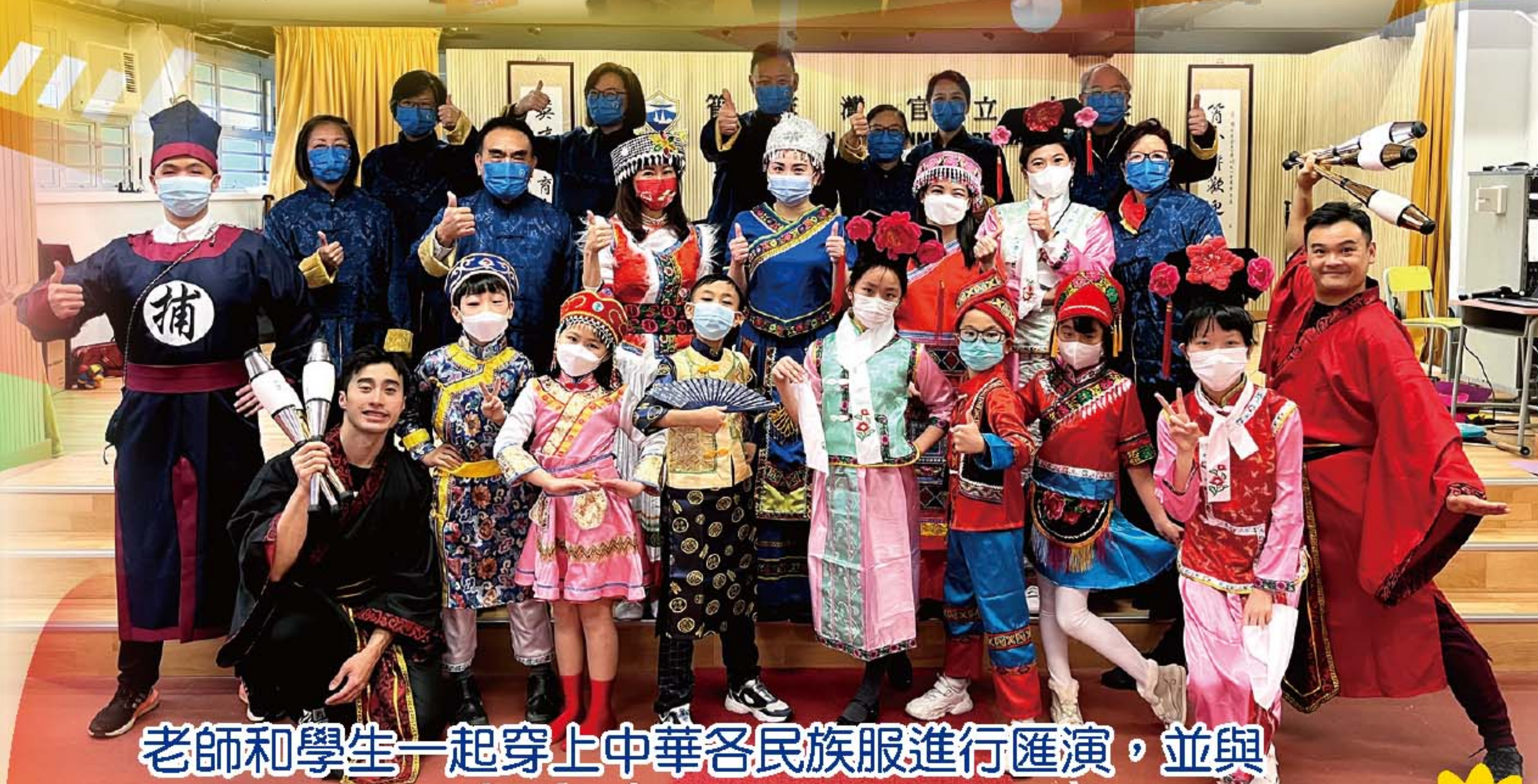
老師和學生一起穿上中華各民族服進行匯演，並與表演者一同合照留念。