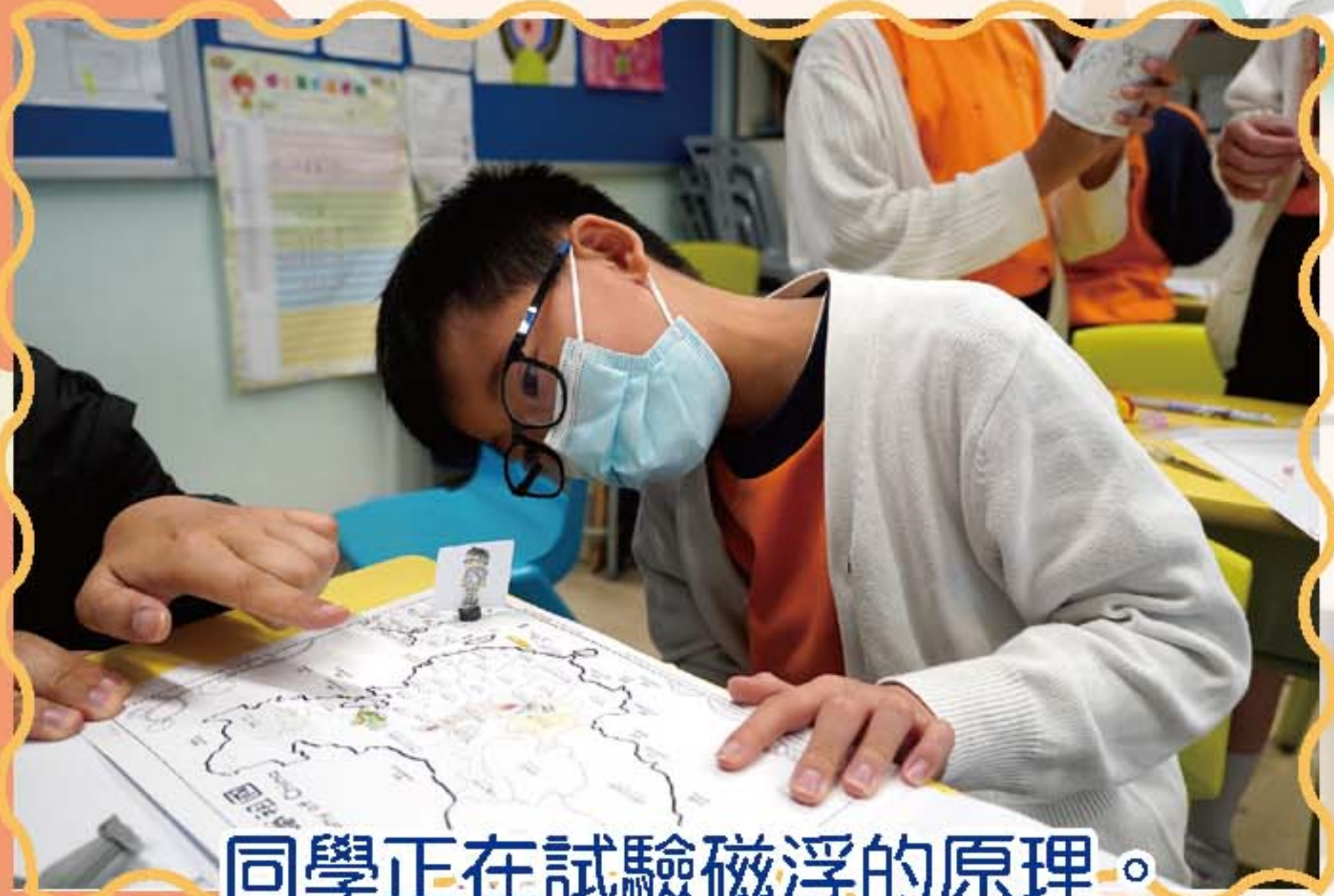
同學正在試驗磁浮的原理。