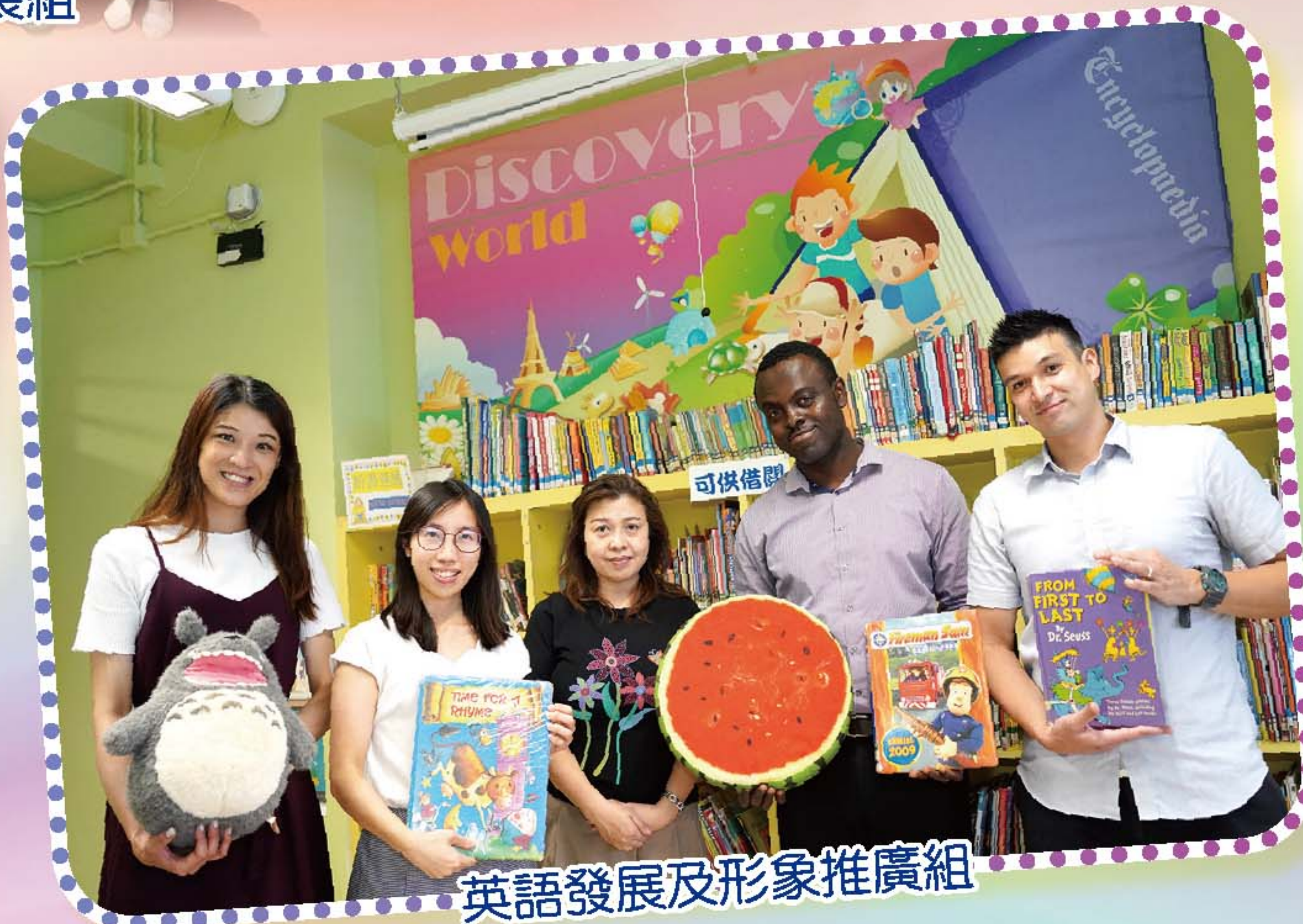
英語發展及形象推廣組