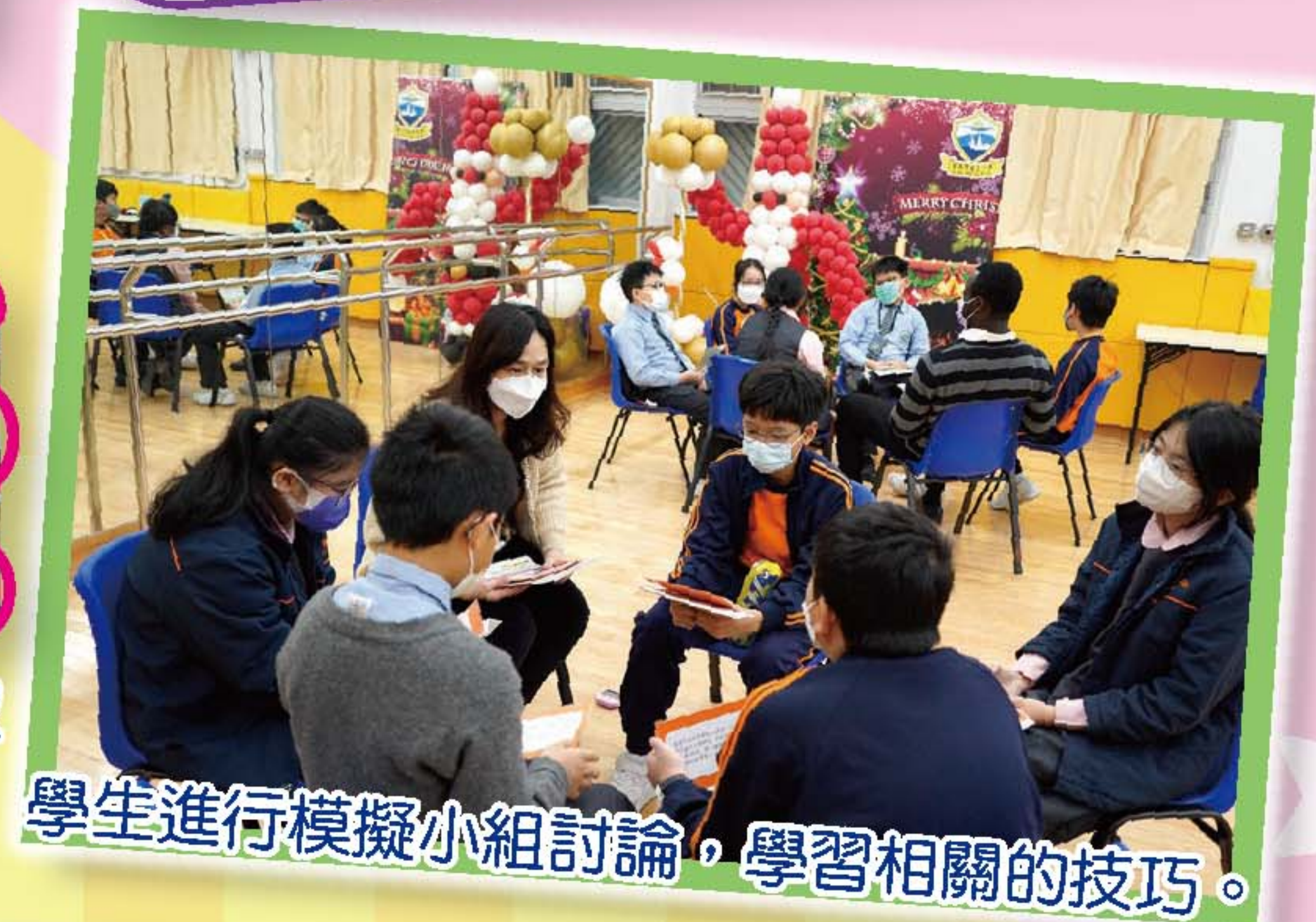
學生進行模擬小組討論，學習相關的技巧。