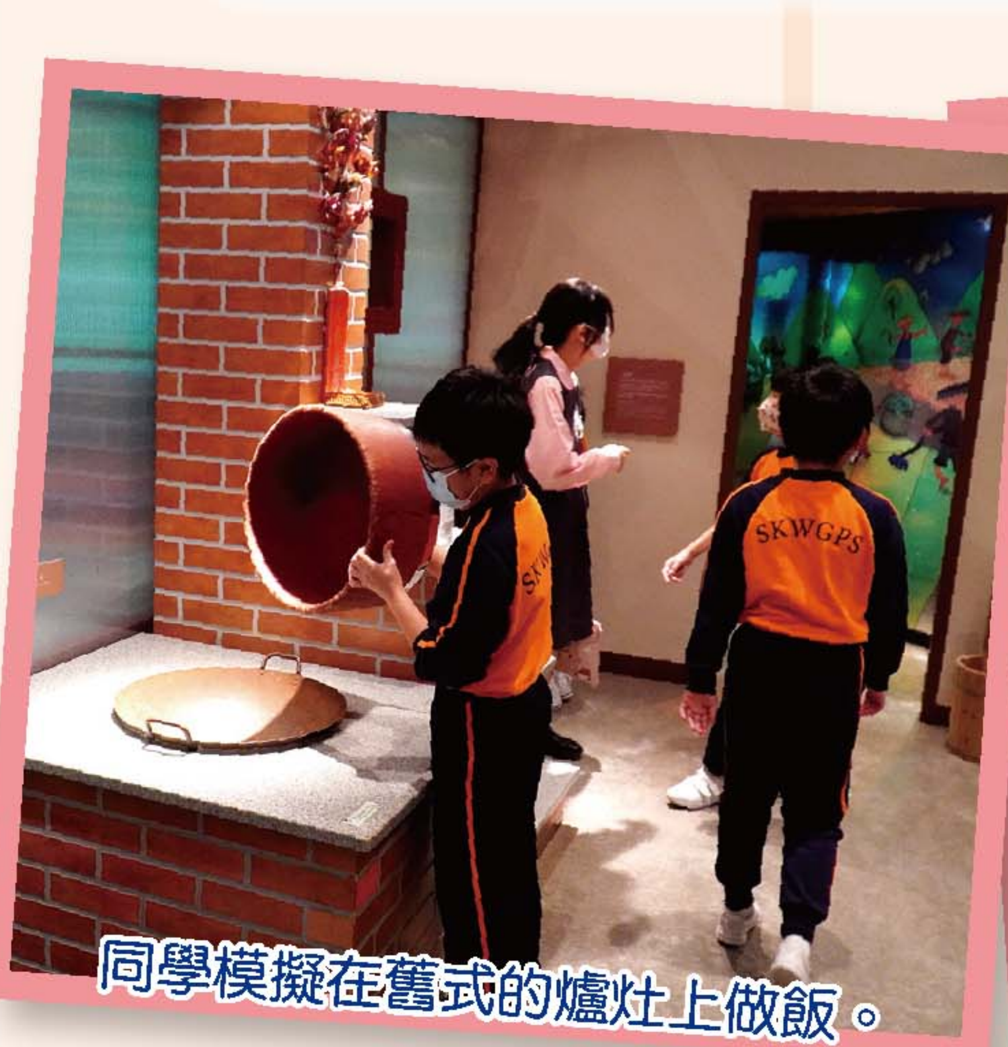
同學模擬在舊式的爐灶上做飯。