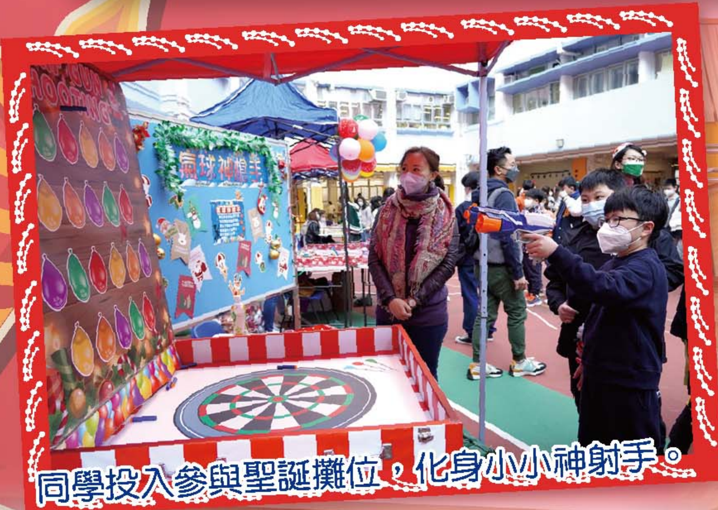
同學投入參與聖誕攤位，化身小小神射手。

本校於12月21日舉行了「筲小歡騰頌聖誕」，當天同學們在禮堂欣賞表演節目、參與大抽獎，還在課室一起製作聖誕飾物，最後參與了聖誕攤位。現場還有漂亮的人型氣球和聖誕佈景，給同學拍照留念，完成攤位遊戲的同學還可以得到一份紀念品。當天家長教師會委員及一眾家長義工熱心籌辦攤位遊戲及擔任抽獎嘉賓等環節，令學生能盡情參與活動，感受佳節帶來的喜悅。本校亦藉着聖誕佳節，邀請了區內幼稚園的學生及家長一同參與聖誕聯歡會的活動，場面熱鬧，讓幼稚園學生體驗小學生活的樂趣，同時加深區內家長對本校的認識。