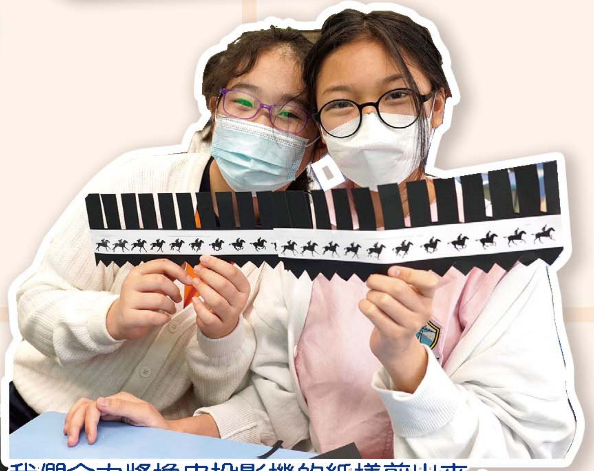
我們合力將橡皮投影機的紙樣剪出來。