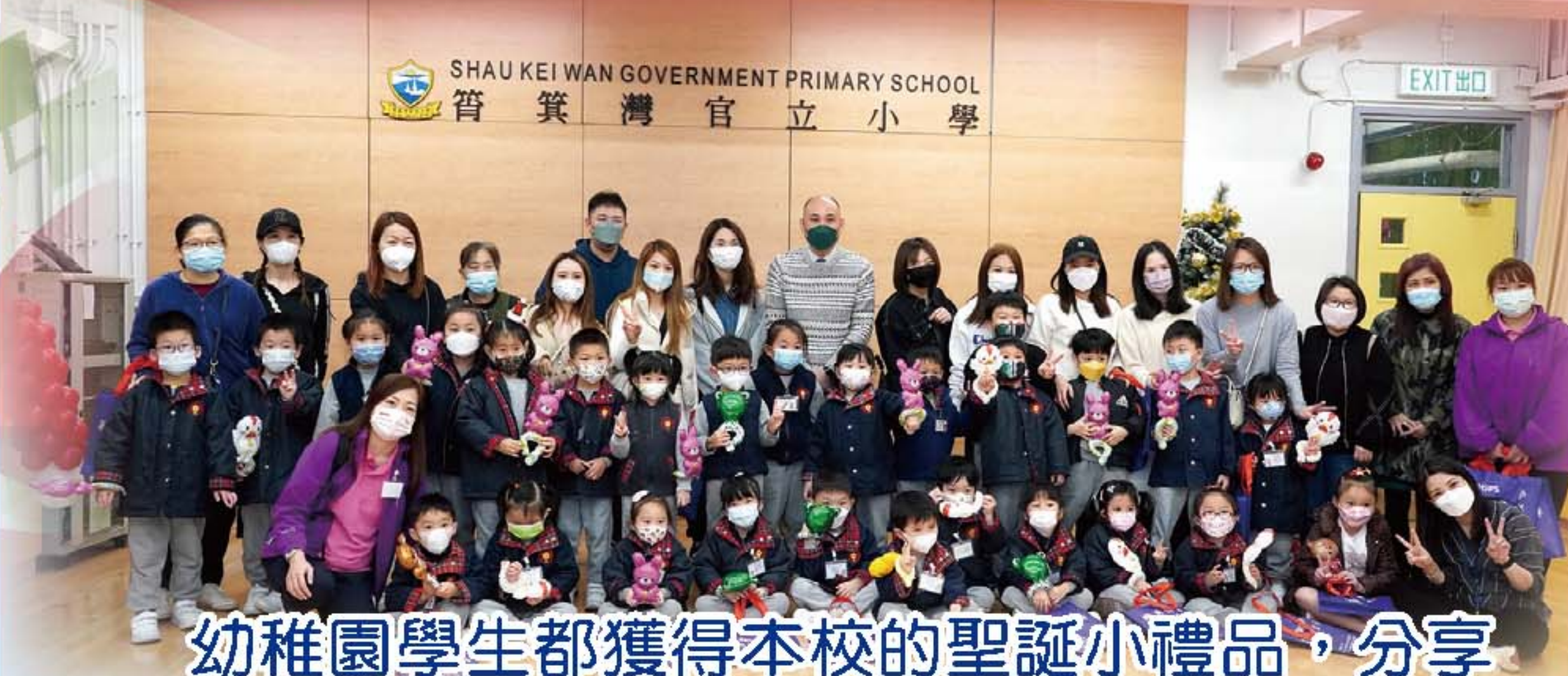
幼稚園學生都獲得本校的聖誕小禮品，分享節日的喜悅。