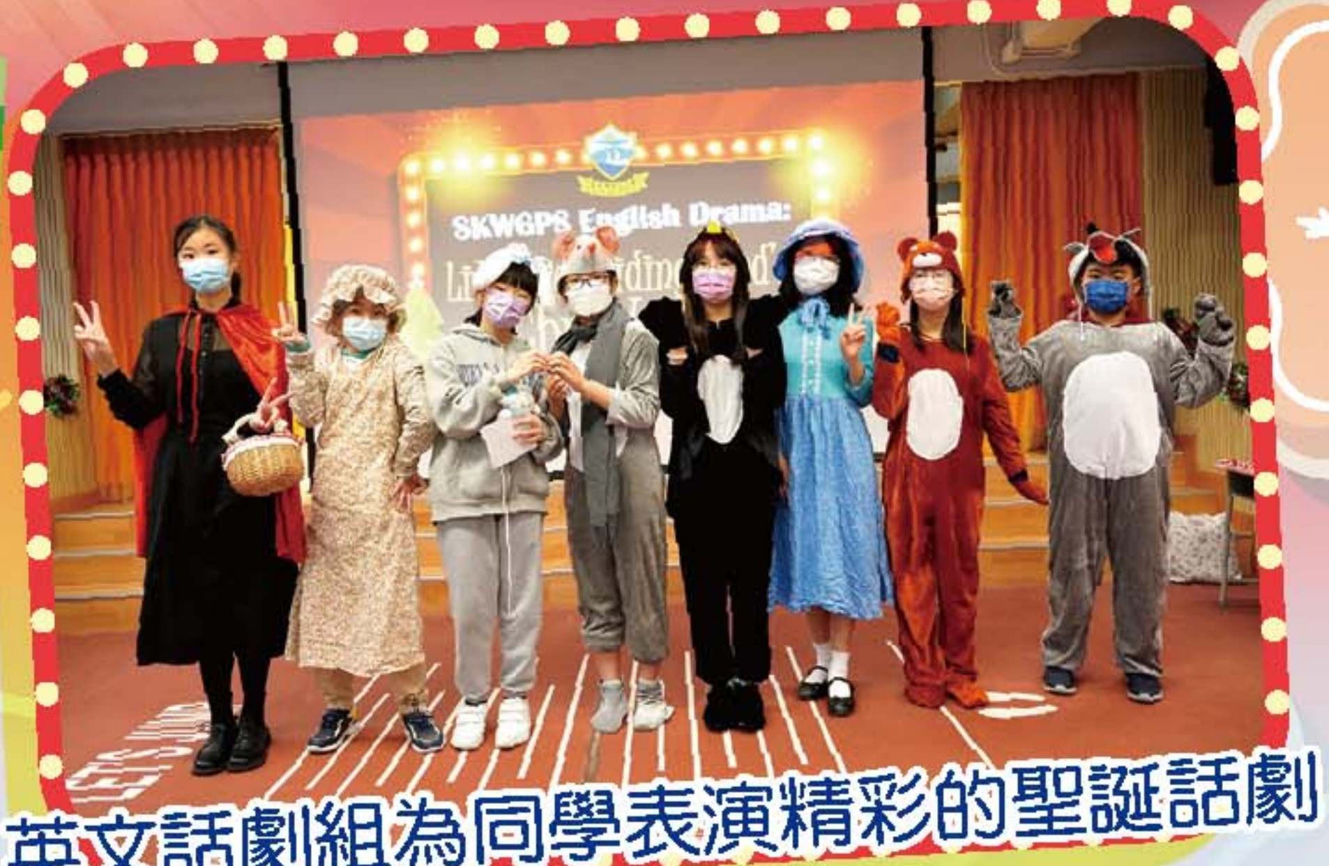
英文話劇組為同學表演精彩的聖誕話劇