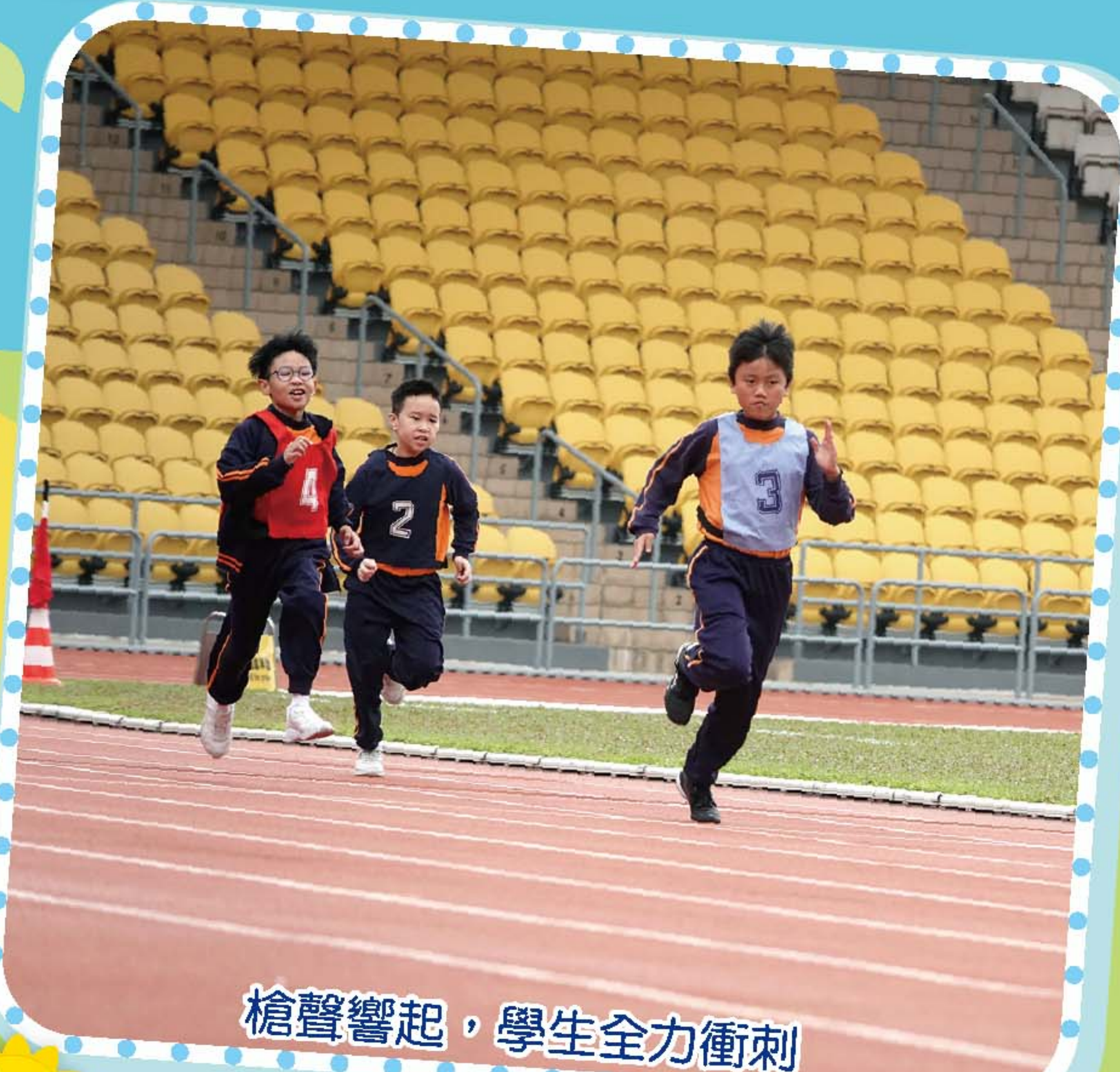
槍聲響起，學生全力衝刺