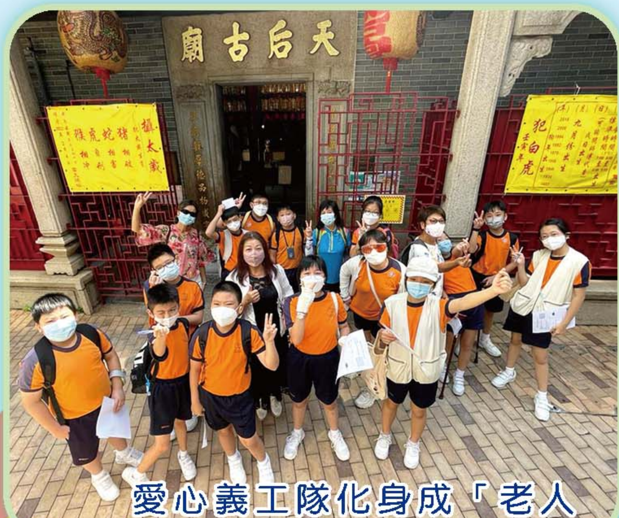
愛心義工隊化身成「老人家」，認識東大街天后古廟。

小義工們一邊配戴著長者體能體驗裝置，一邊與長者義工認識東大街歷史。從中理解長者的體能限制，同時提升長幼共融文化。