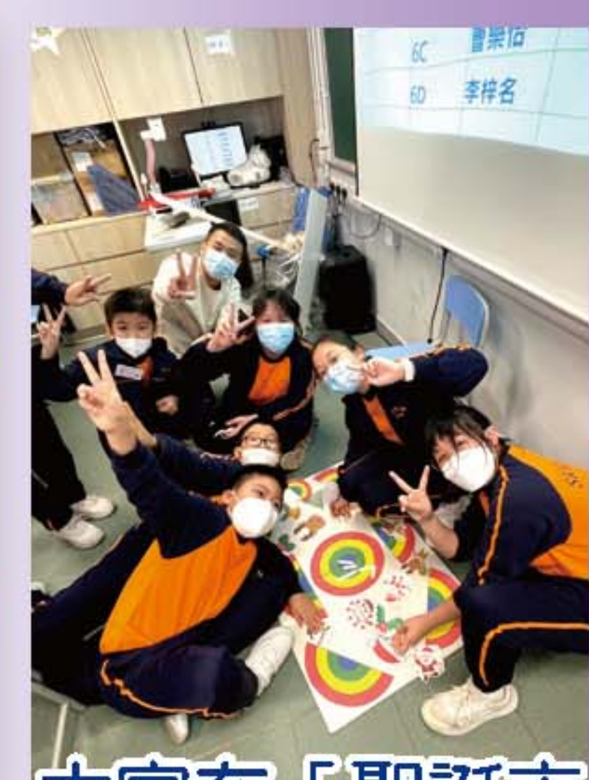
大家在「聖誕市集」中投入地製作攤位遊戲！