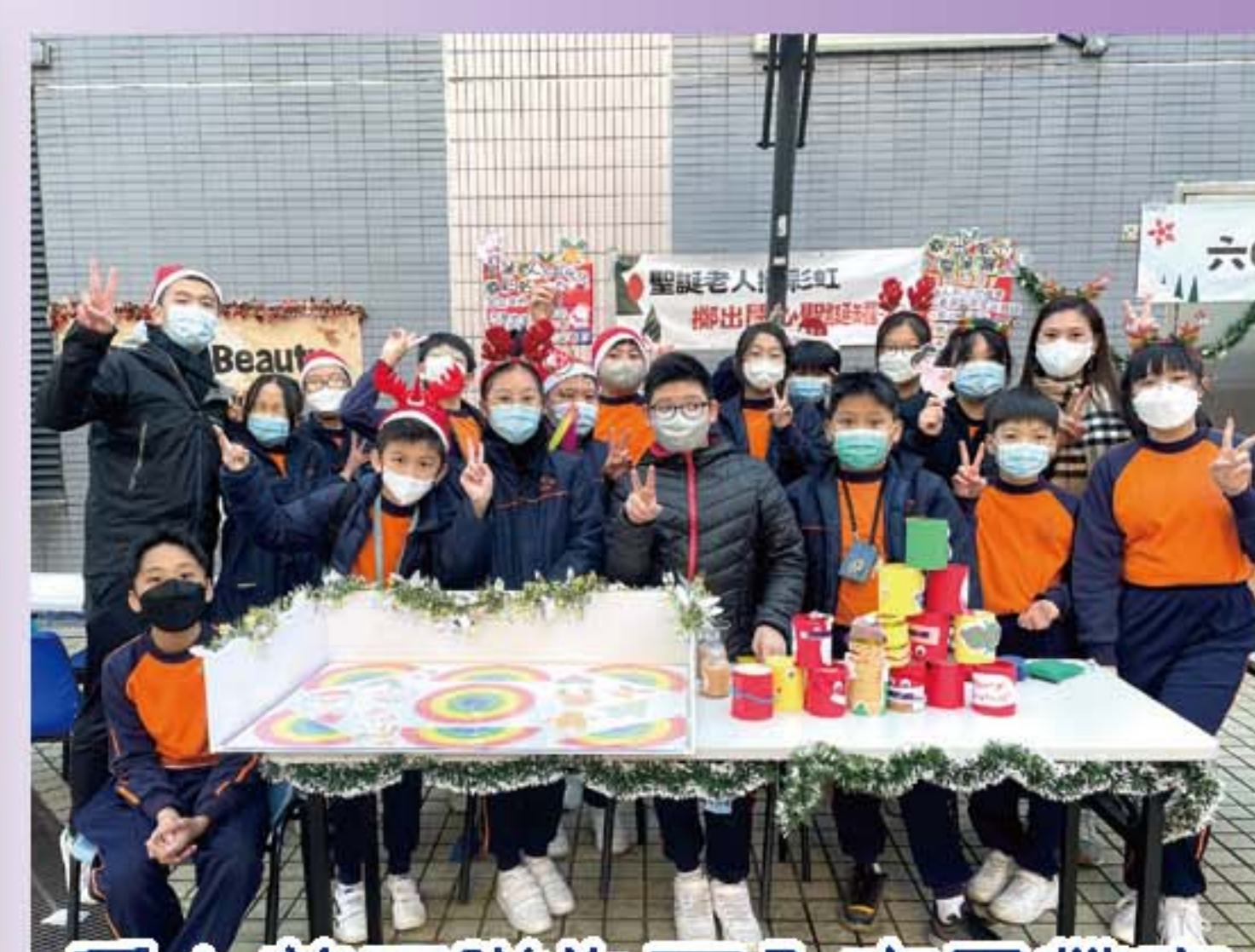
愛心義工隊為區內市民帶來歡樂的聖誕節目，Yeah~