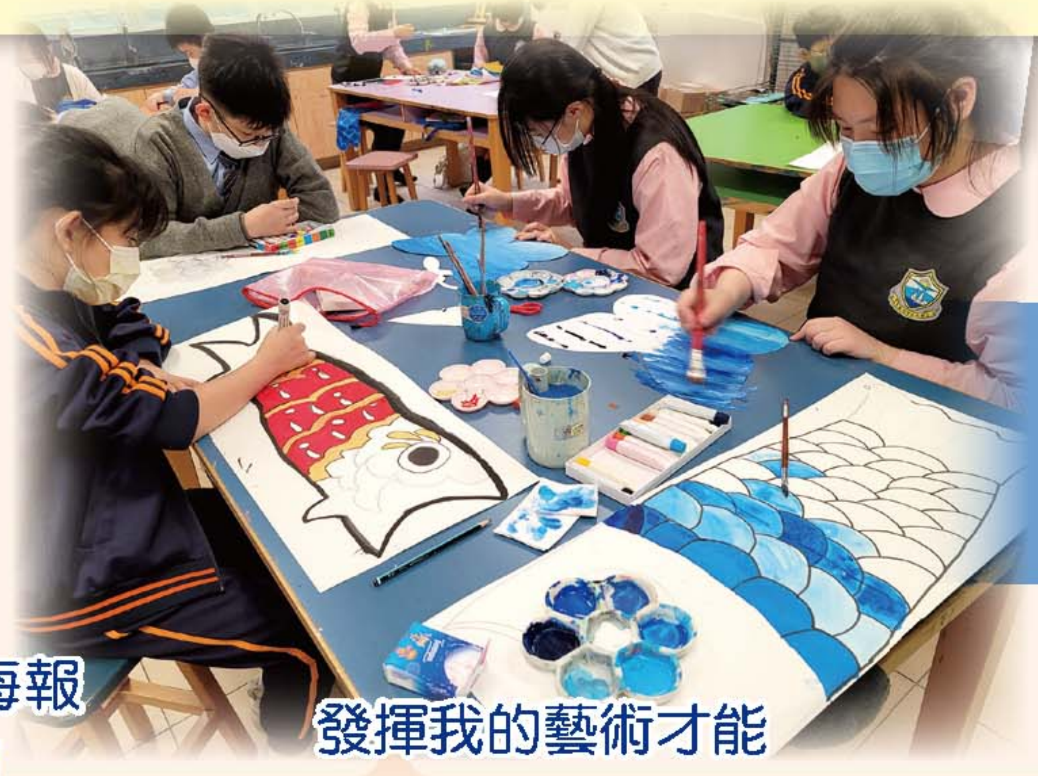
發揮我的藝術才能