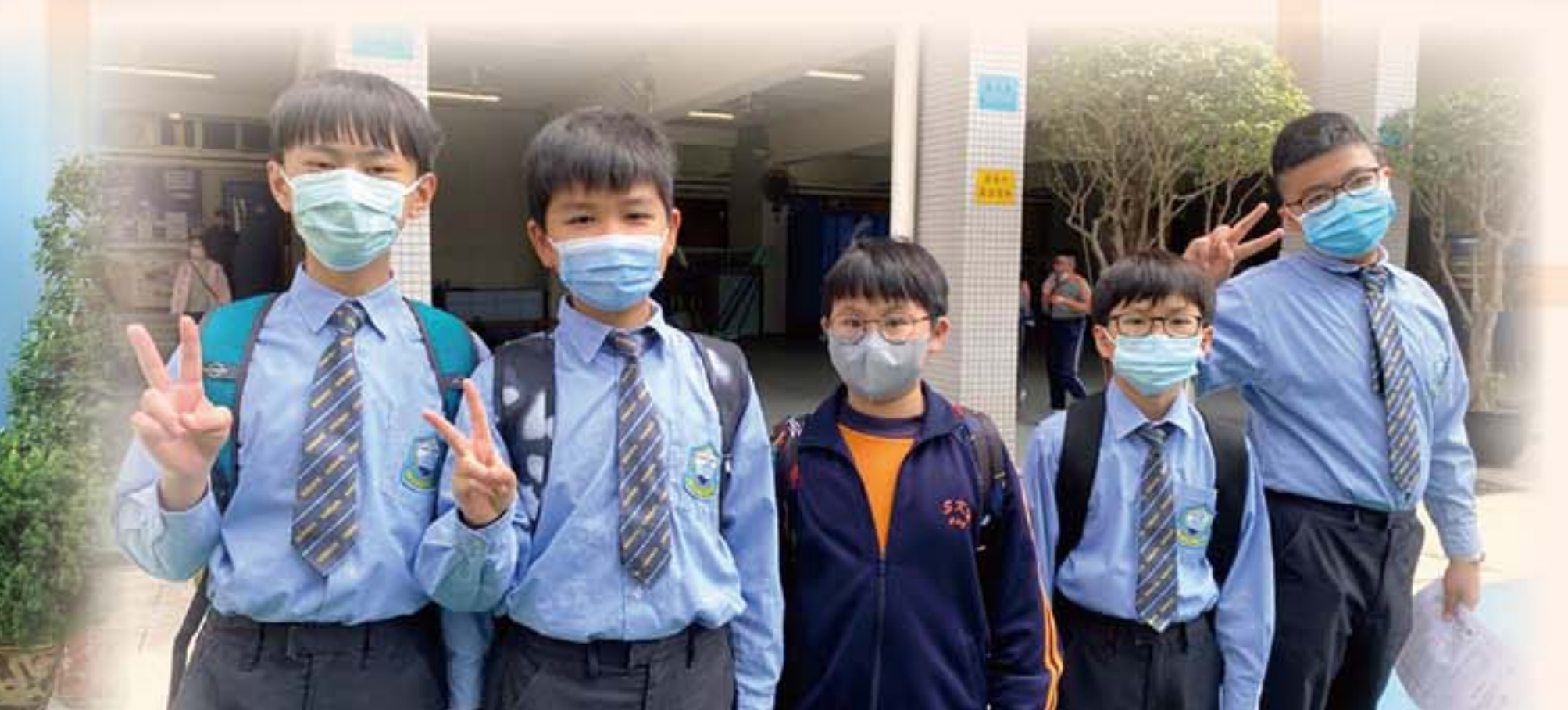
2023香港小學數學精英選拔賽