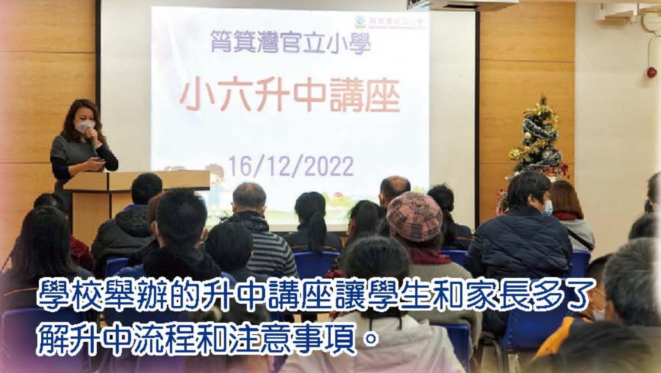
學校舉辦的升中講座讓學生和家長多了解升中流程和注意事項。