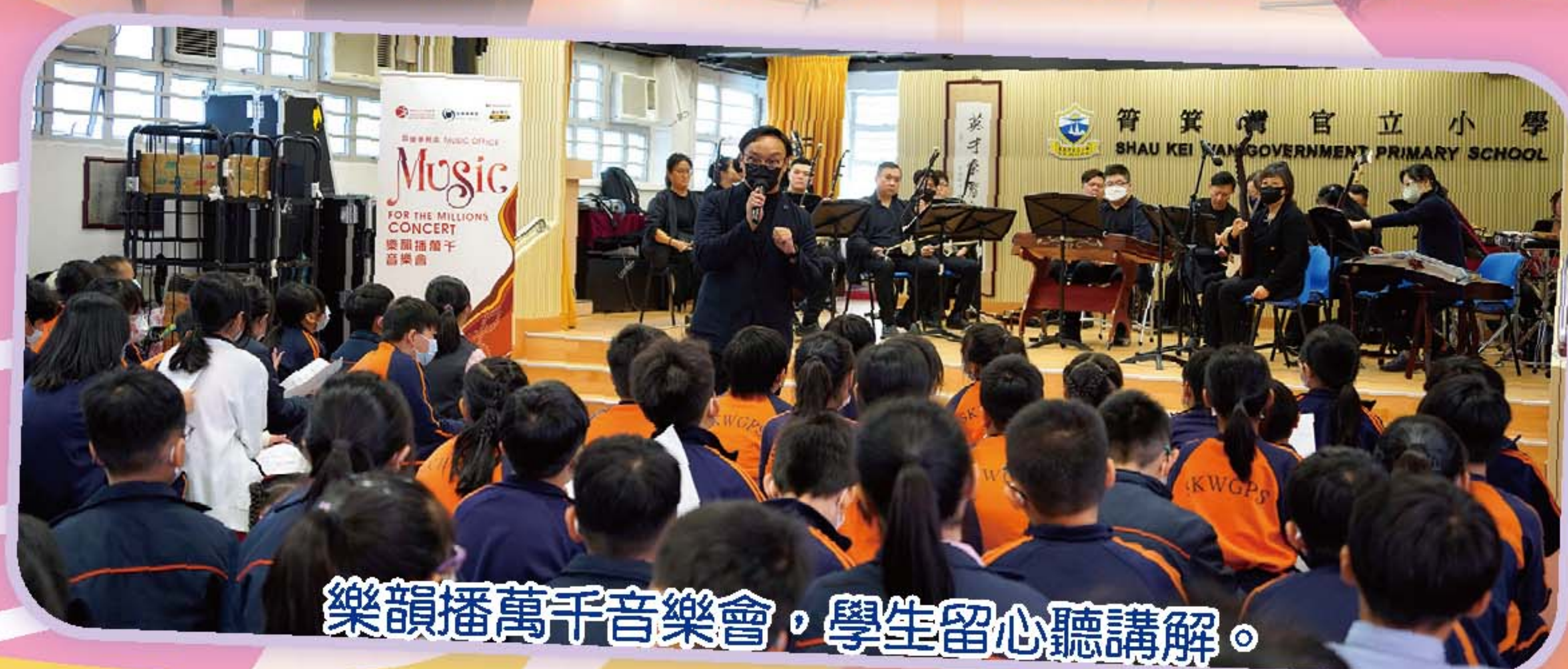
樂韻播萬千音樂會，學生留心聽講解。