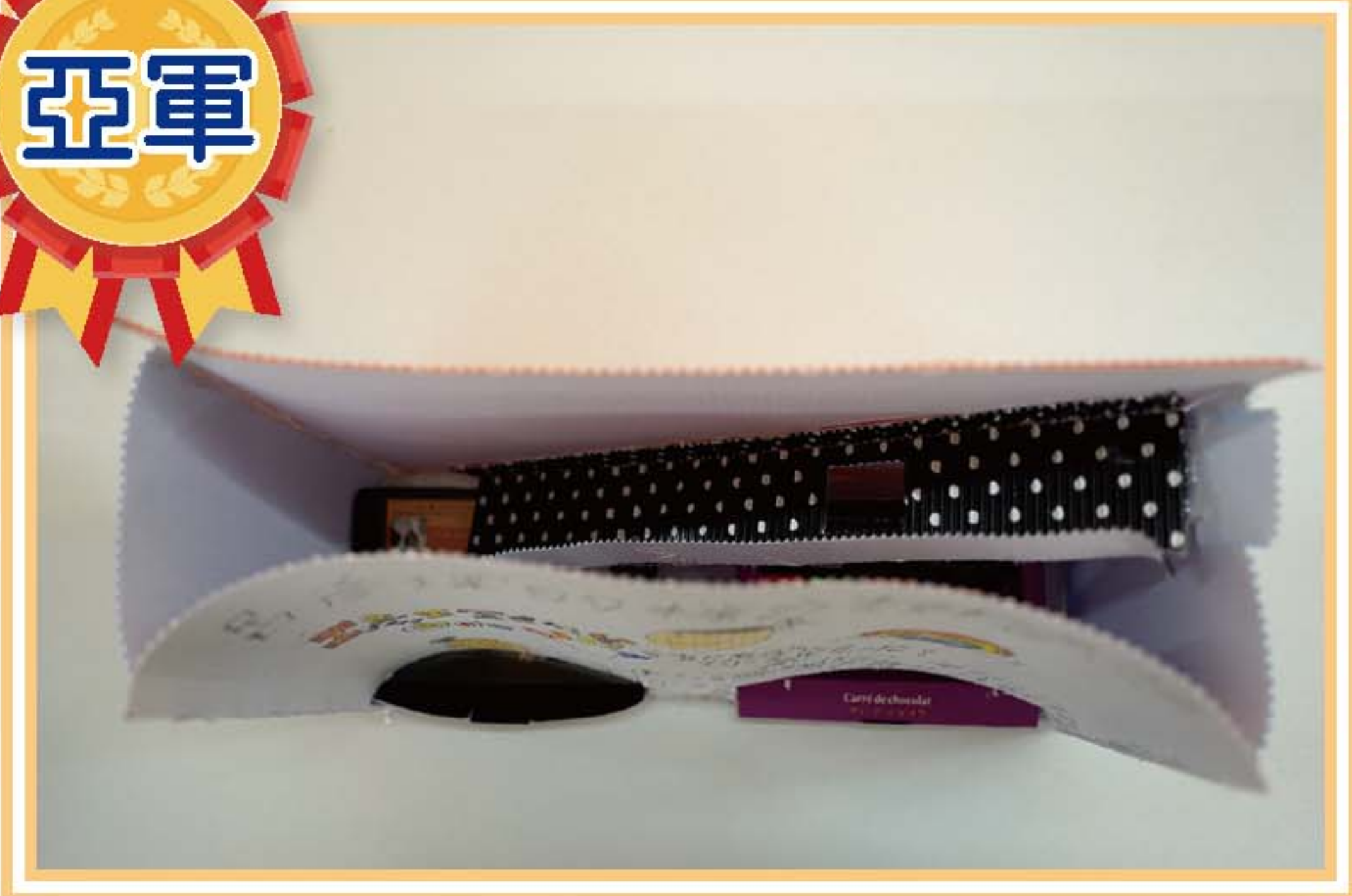
糖果分類機 (2A 呂彥琛)