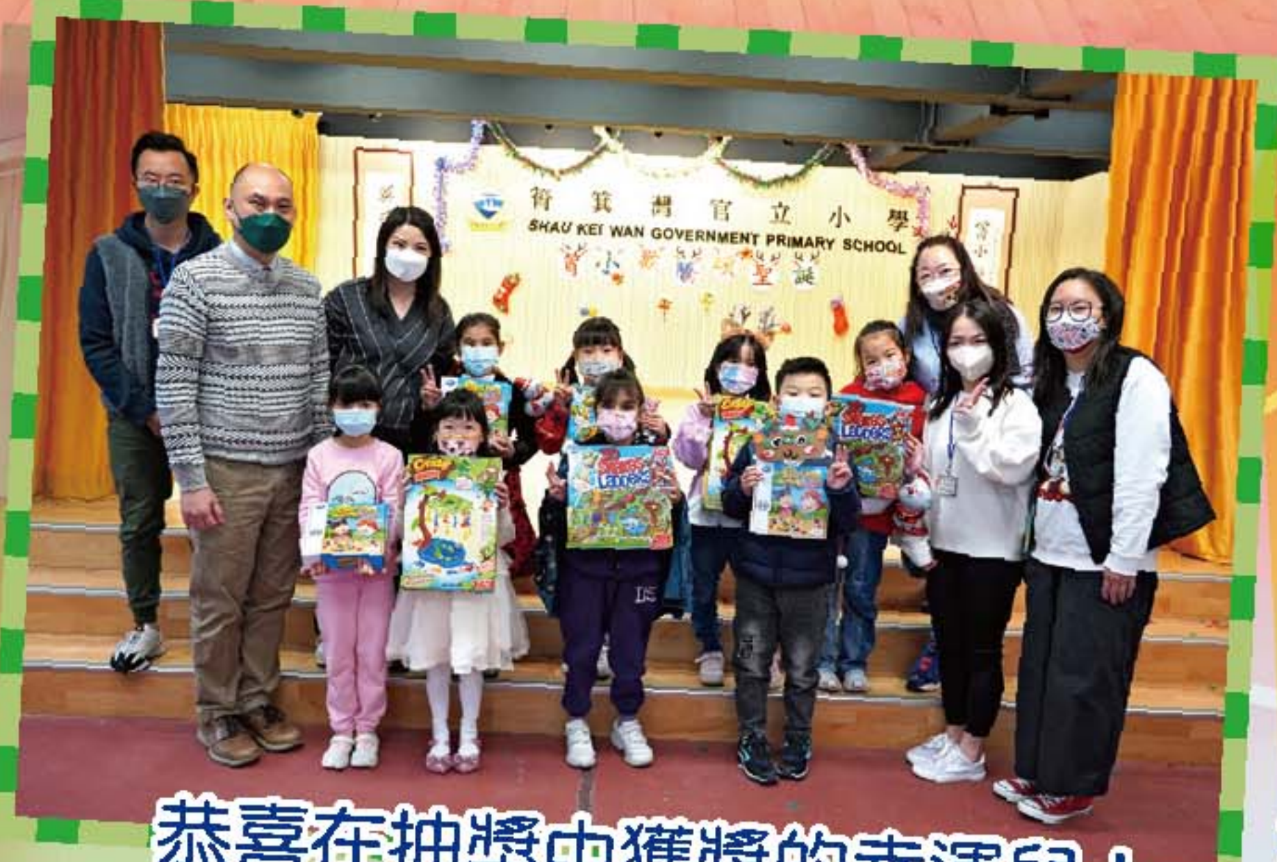
恭喜在抽獎中獲獎的幸運兒！