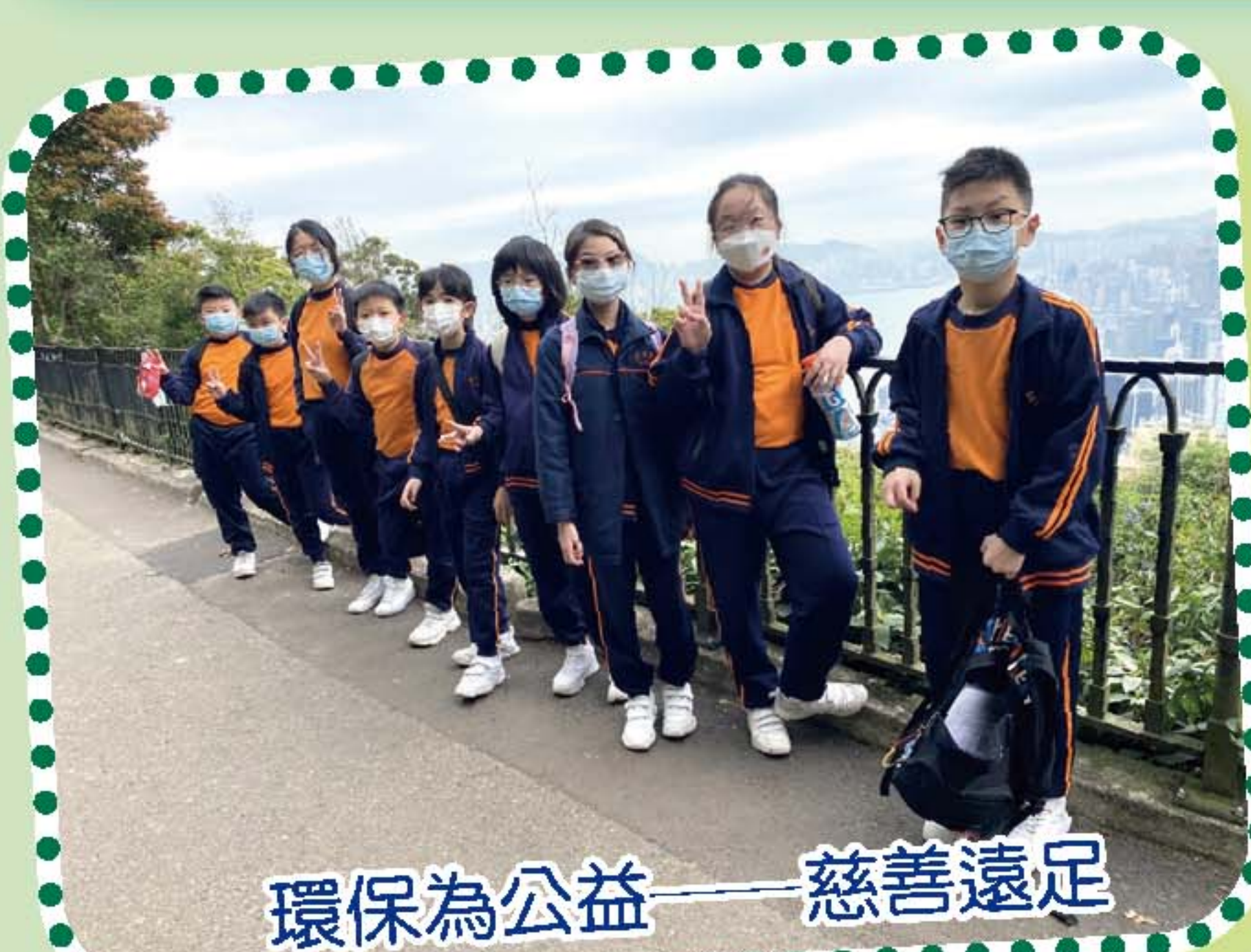
環保為公益——慈善遠足

公益少年團的宗旨為學生提供服務學習的機會，從而培養良好的品格。本校公益少年團團員在本學年參加了慈善花卉義賣、慈善遠足、健康生活教育日營等活動，藉此提高他們的公民責任感，培養積極參與社區事務的熱誠和關懷。