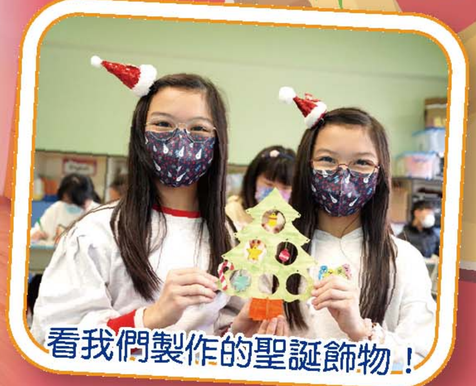
看我們製作的聖誕飾物！