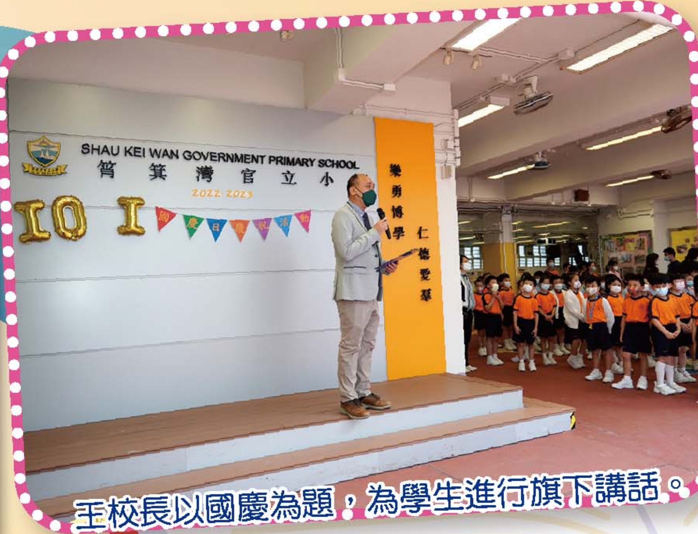
王校長以國慶為題，為學生進行旗下講話。

為慶祝中國成立73周年，全校學生於9月初特意製作心意卡，向祖國送上祝福。本校亦於10月3日舉行了國慶日慶祝活動。透過一系列國民教育活動，讓學生了解國情，體會祖國的強大與繁榮。