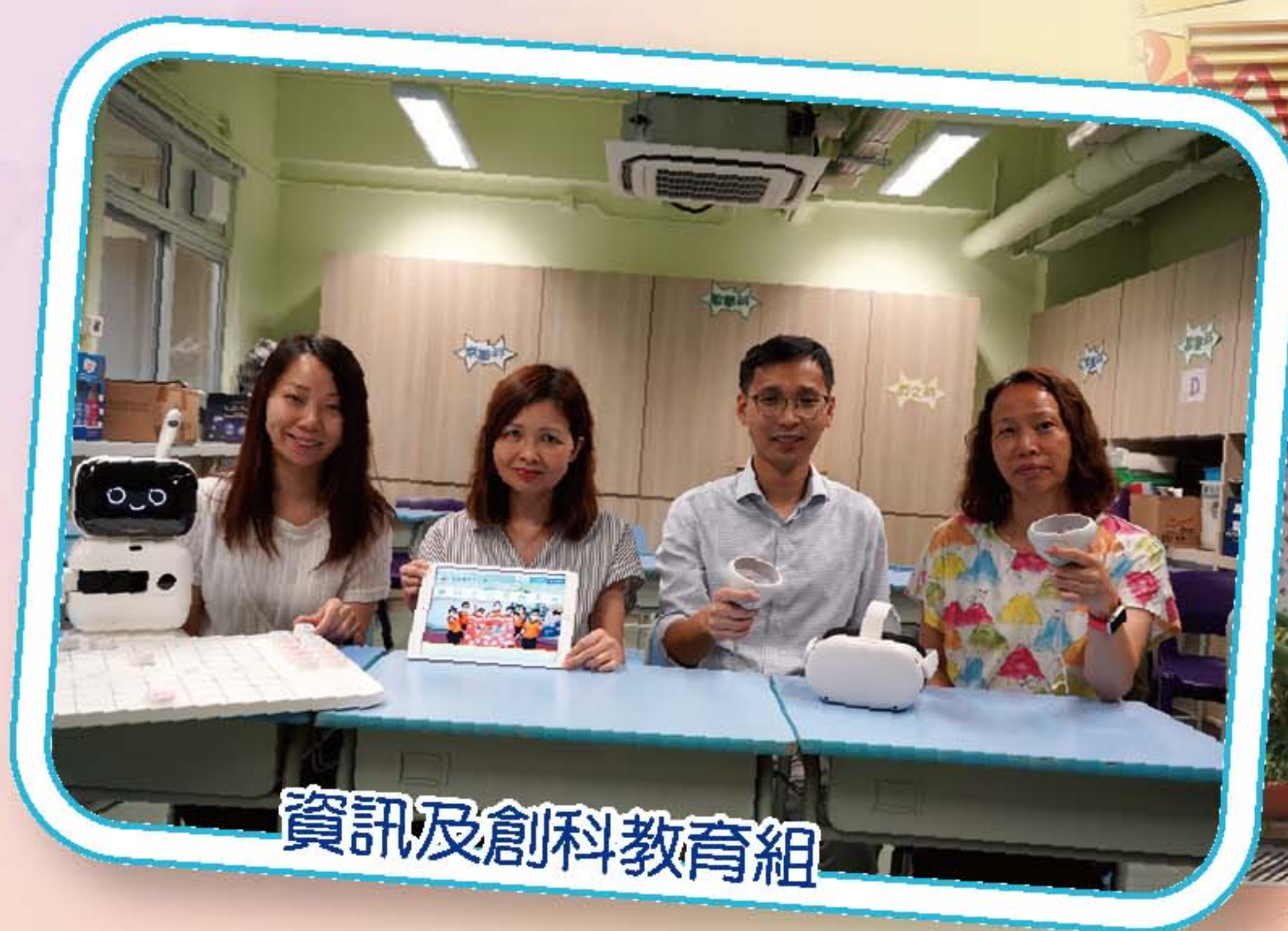
資訊及創科教育組