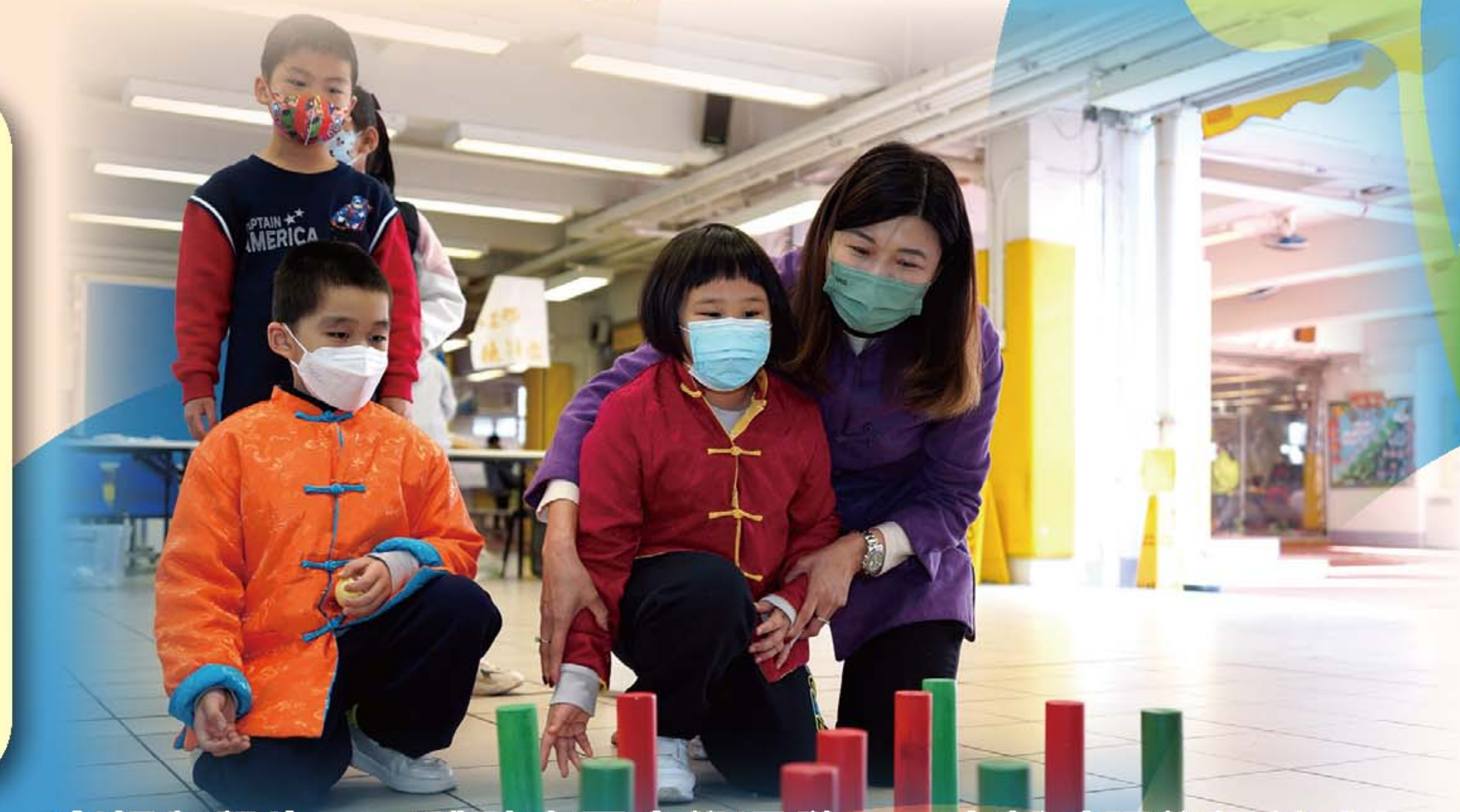
老師與學生一同體驗中國古代運動——木射（現代保齡球）。

本校於1月19日舉行「中華文化日」，當天節目相當豐富，有體驗活動、攤位遊戲、扯鈴及雜耍表演、手工藝製作和中華各民族服匯演。同學除了透過體驗活動認識中國古代運動外，更認識中華各民族的服裝、賀年習俗等，大家都玩得非常盡興。當天不少學生都穿上別具特色的中國服飾共迎新春，讓中華文化日更添節日氣氛。