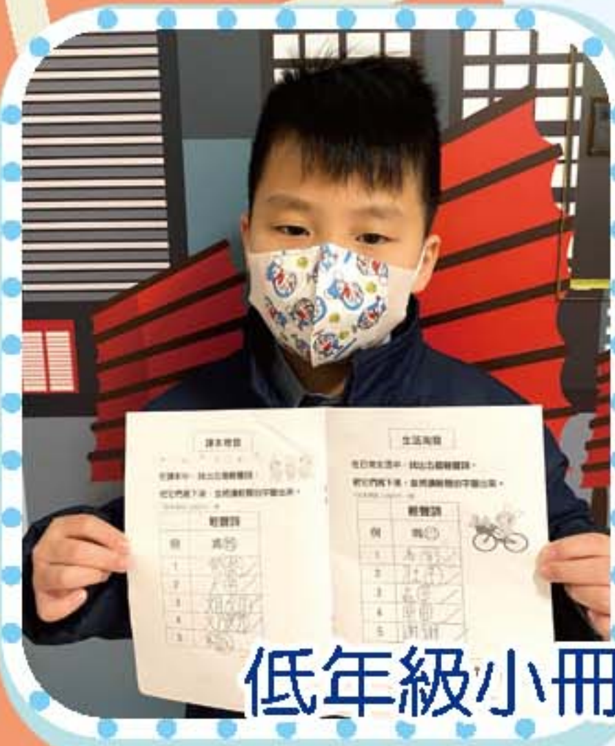
低年級小冊子以「輕聲」及「兒化」為題，學生從多方面蒐集資料，豐富對輕聲及兒化詞彙的認識。

為了配合本年度的關注事項，本科冀透過多元學習經歷，照顧學生學習多樣性，特意設計校本「多元自學小冊子」。同學可透過聽覺、視覺、朗讀以及自學等方法習得有關普通話知識，學生投入活動，表現積極。