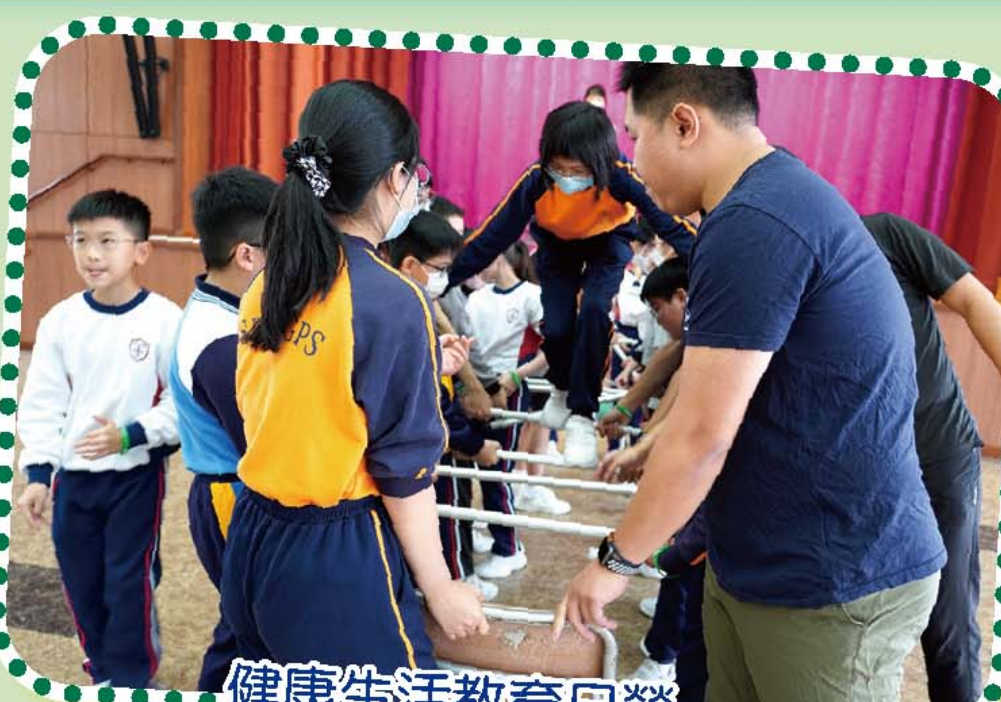
健康生活教育日營