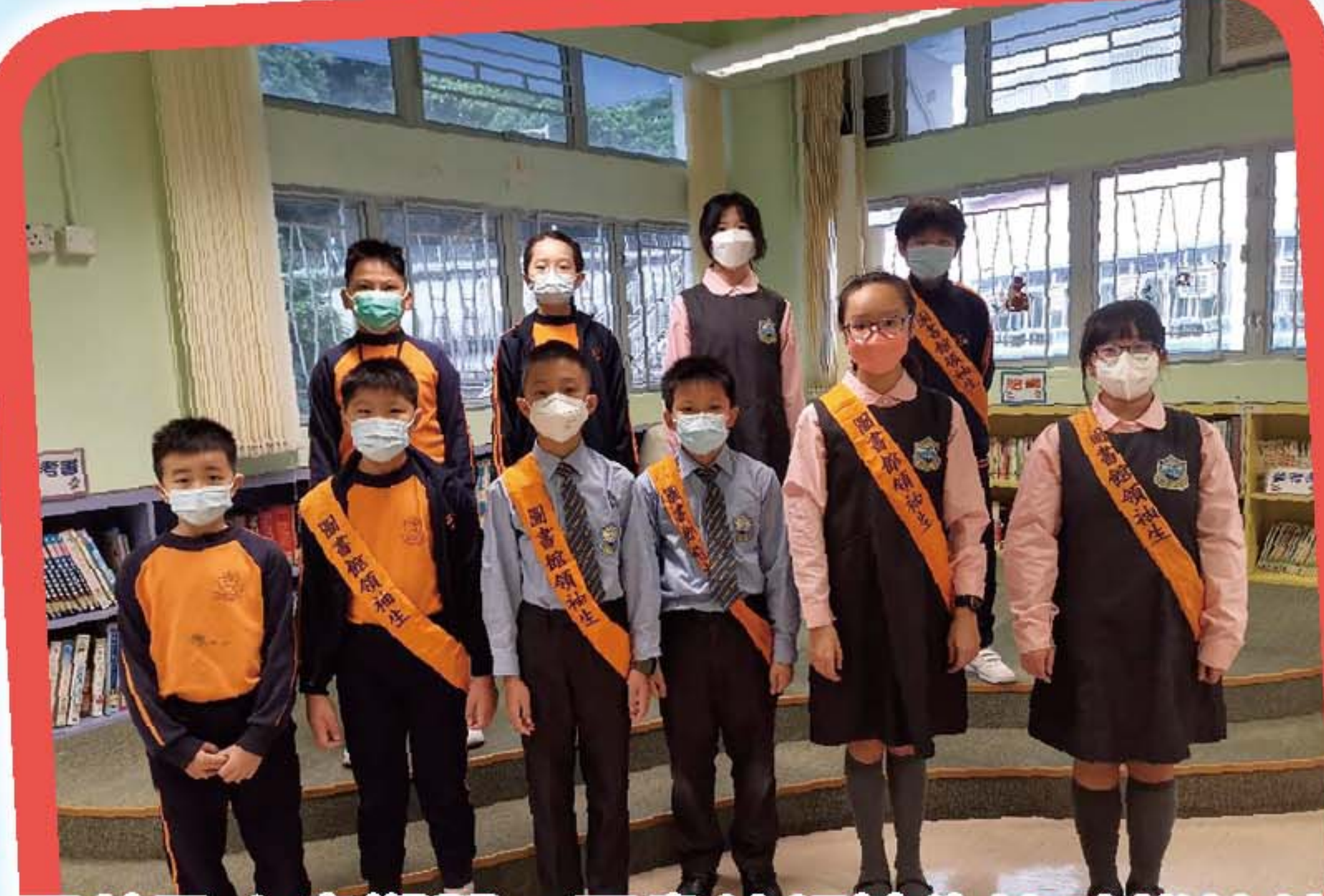
課前及小息期間，圖書館領袖生協助維持館內秩序，並幫忙處理借還圖書的工作。