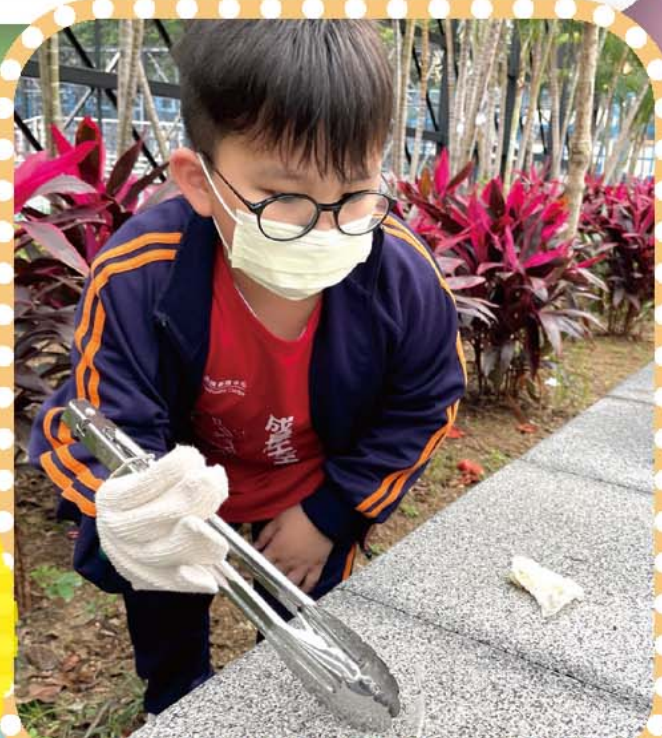
愛心之旅活動，學生走出校園，為區內設施進行清潔，服務社區。