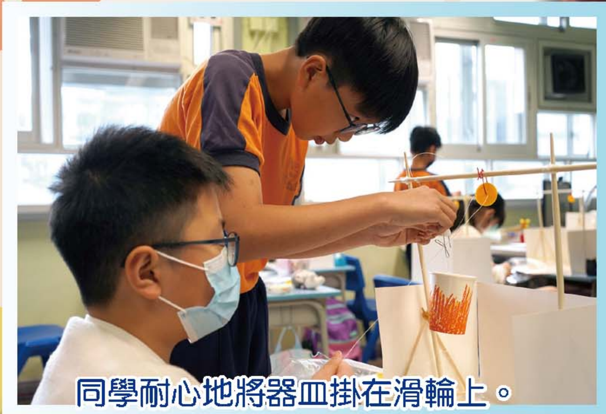
同學耐心地將器皿掛在滑輪上。