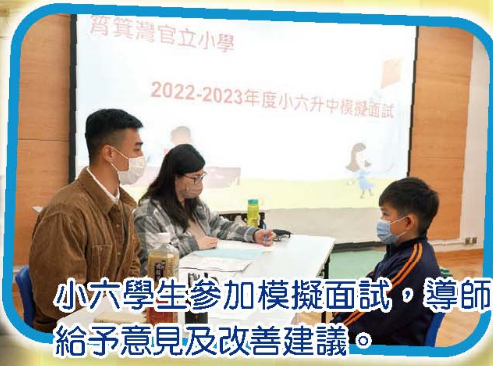
小六學生參加模擬面試，導師就學生作自我介紹和面談的表現給予意見及改善建議。