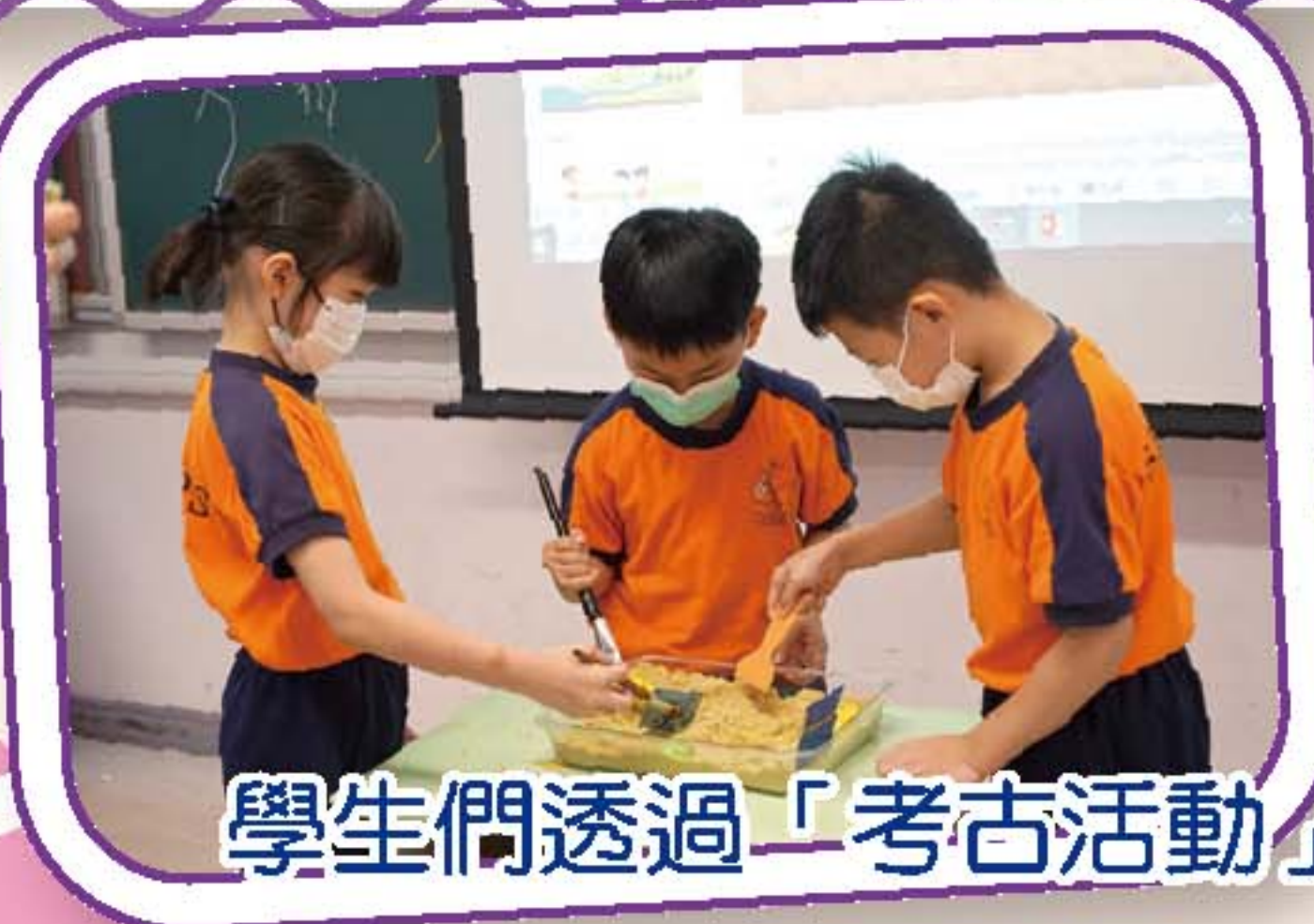
學生們透過「考古活動」明白中國文字的歷史和價值