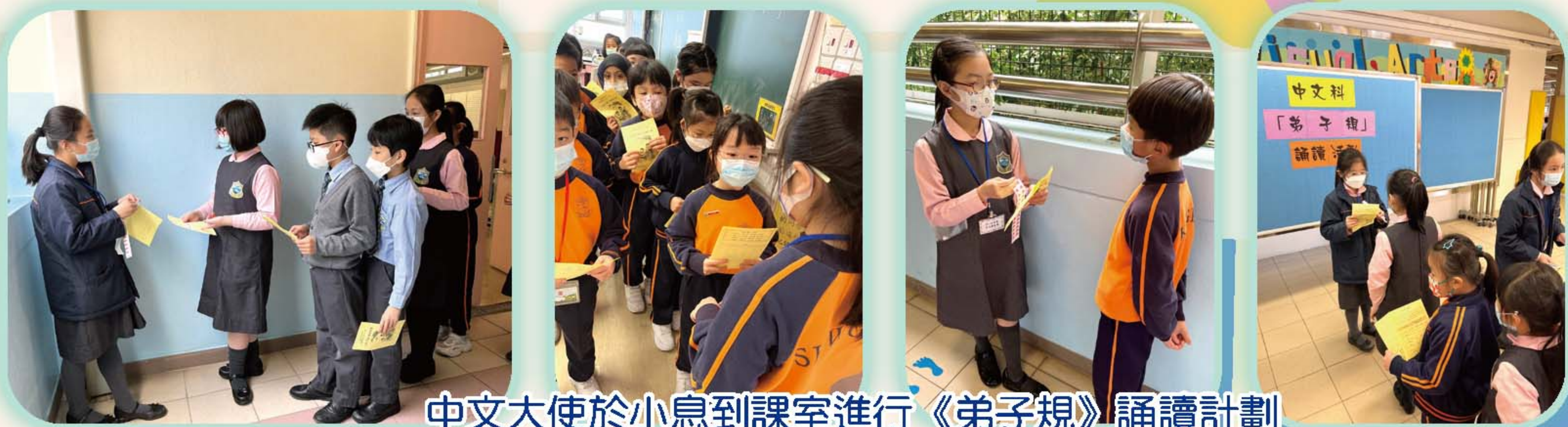
中文大使於小息到課室進行《弟子規》誦讀計劃