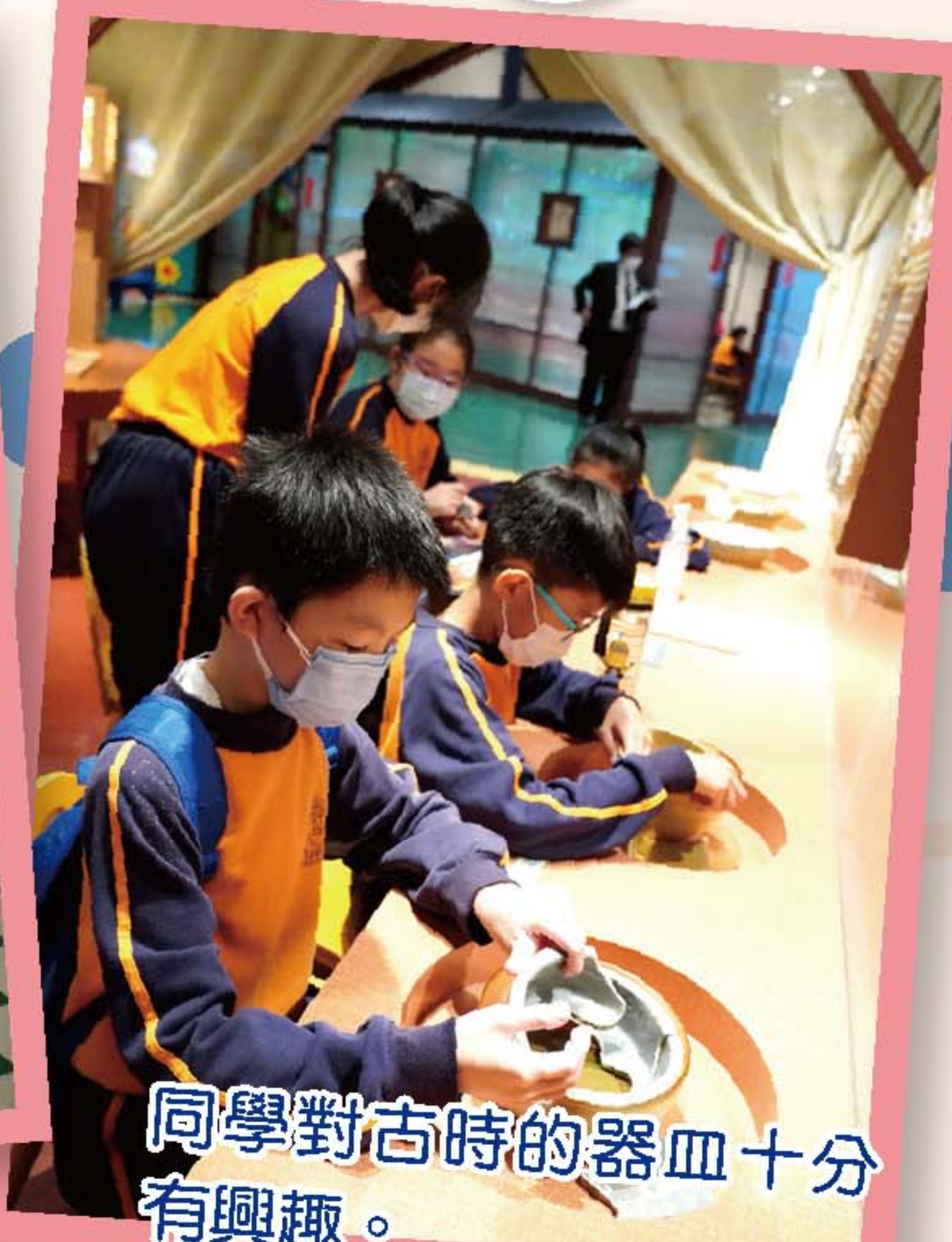
同學對古時的器皿十分有興趣。