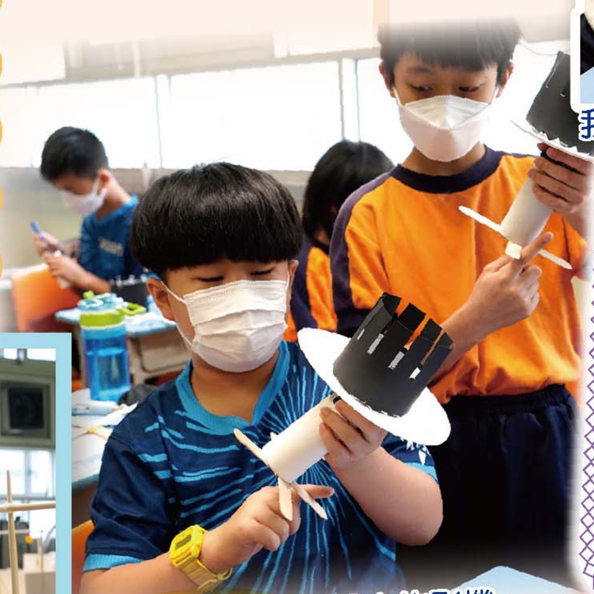
同學正在測試橡皮放影機。