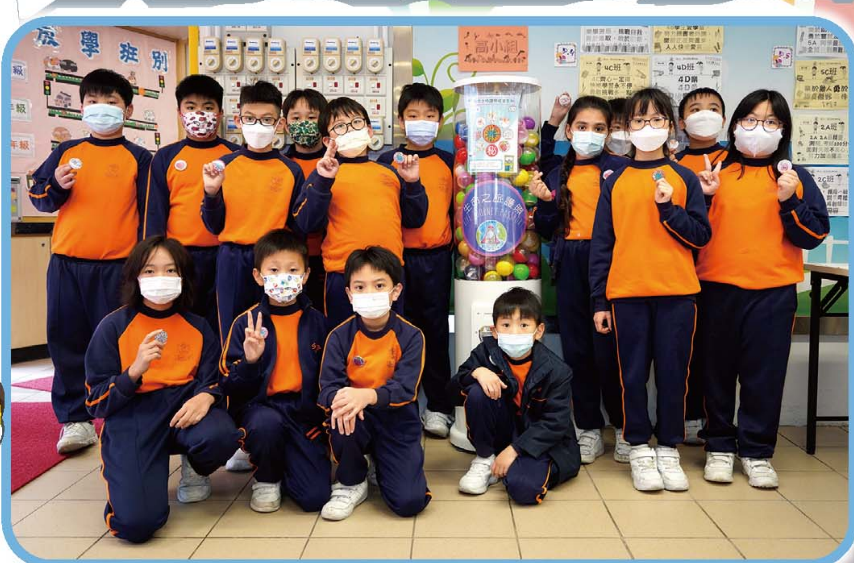
校本輔導獎勵計劃

校本輔導獎勵計劃以生命教育為題，冀透過計劃，讓學生可以將日常的良好表現轉化成實際的獎勵，獲得一定數量的成長飛行里數，可以在扭蛋機抽到不同獎賞。獎賞包括：與校長午膳、Switch體育競技活動、VR 體驗活動、社工室遊戲角入場券等，學生均能積極積極投入參與。