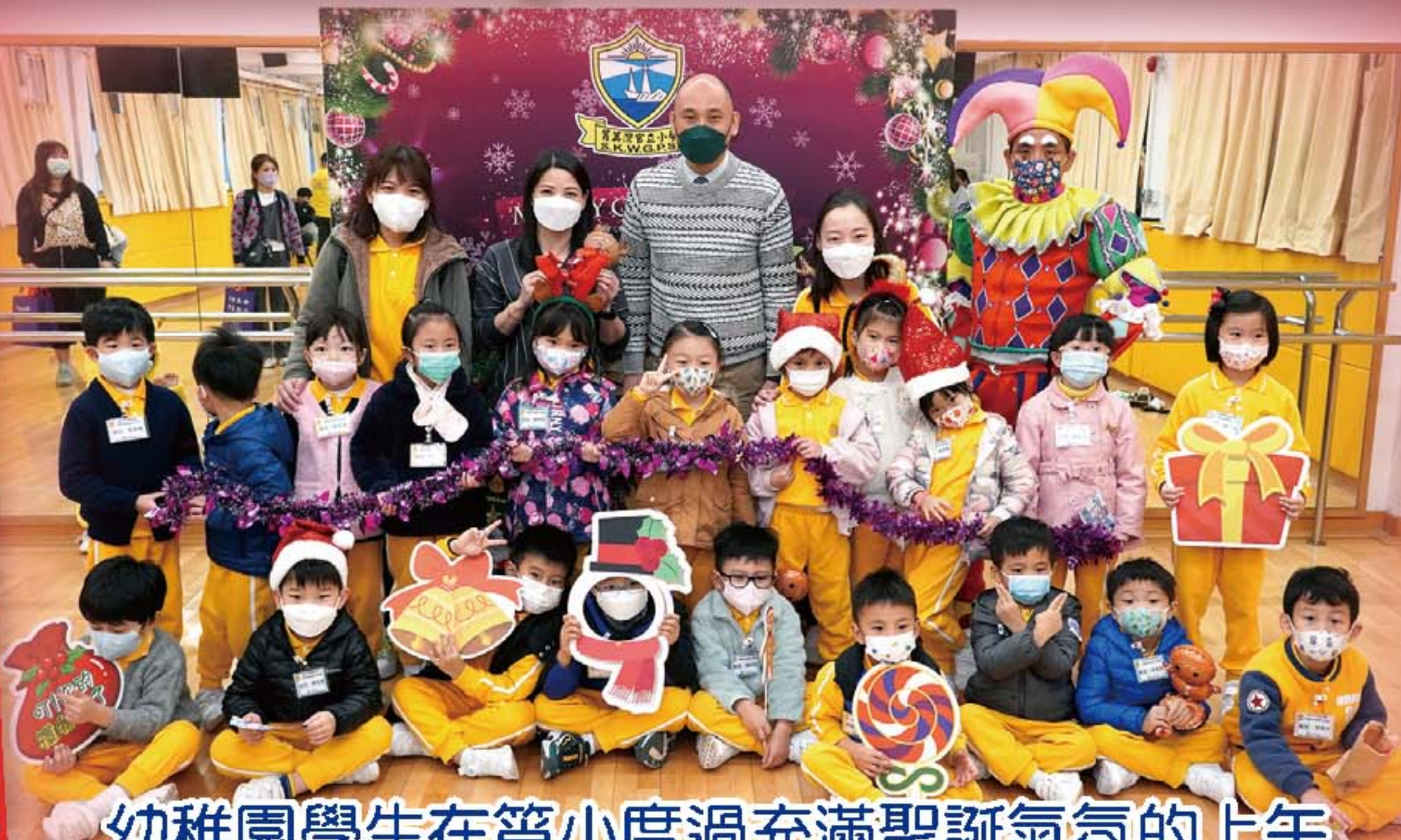
幼稚園學生在筲小度過充滿聖誕氣氛的上午