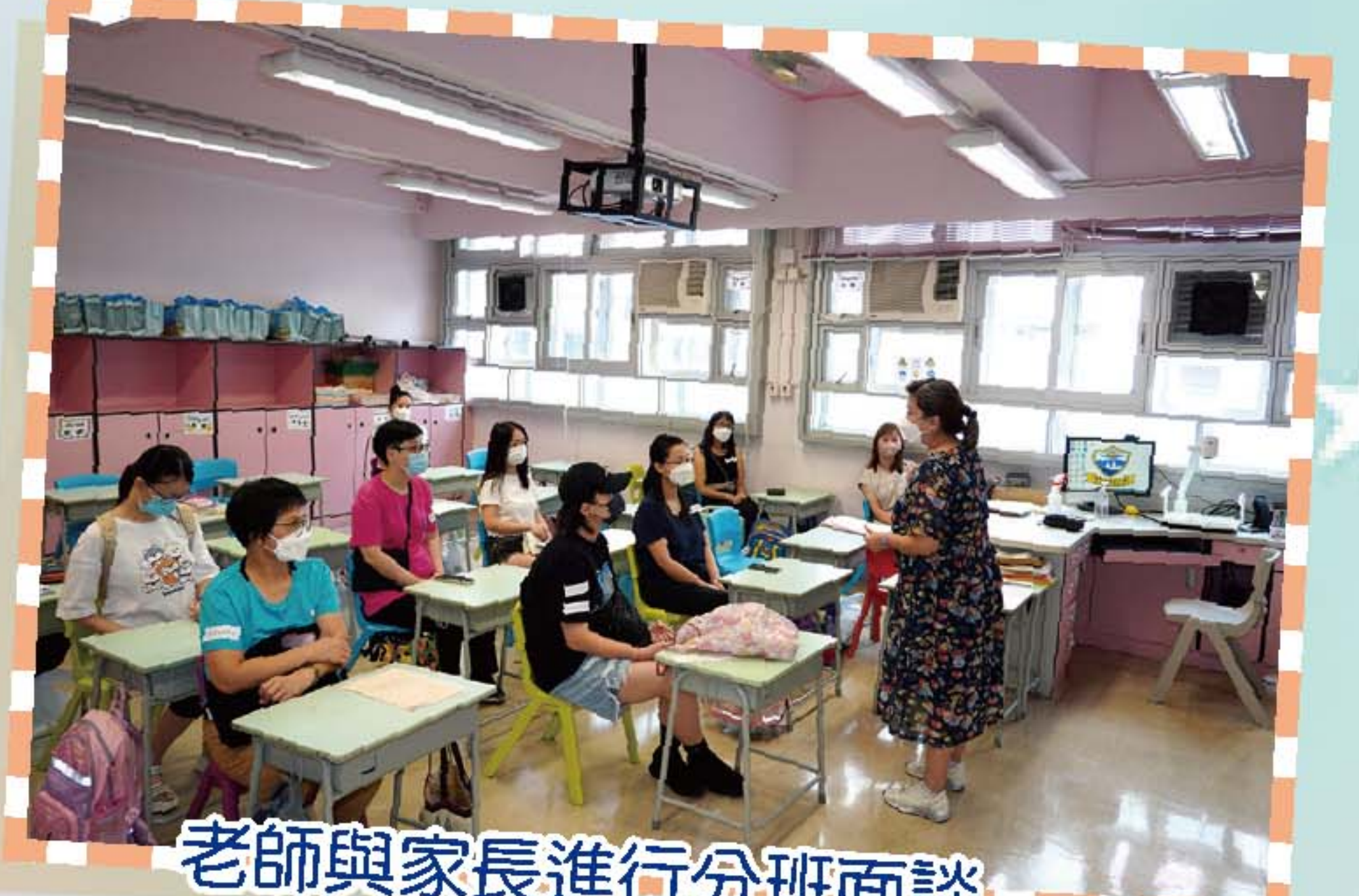
老師與家長進行分班面談