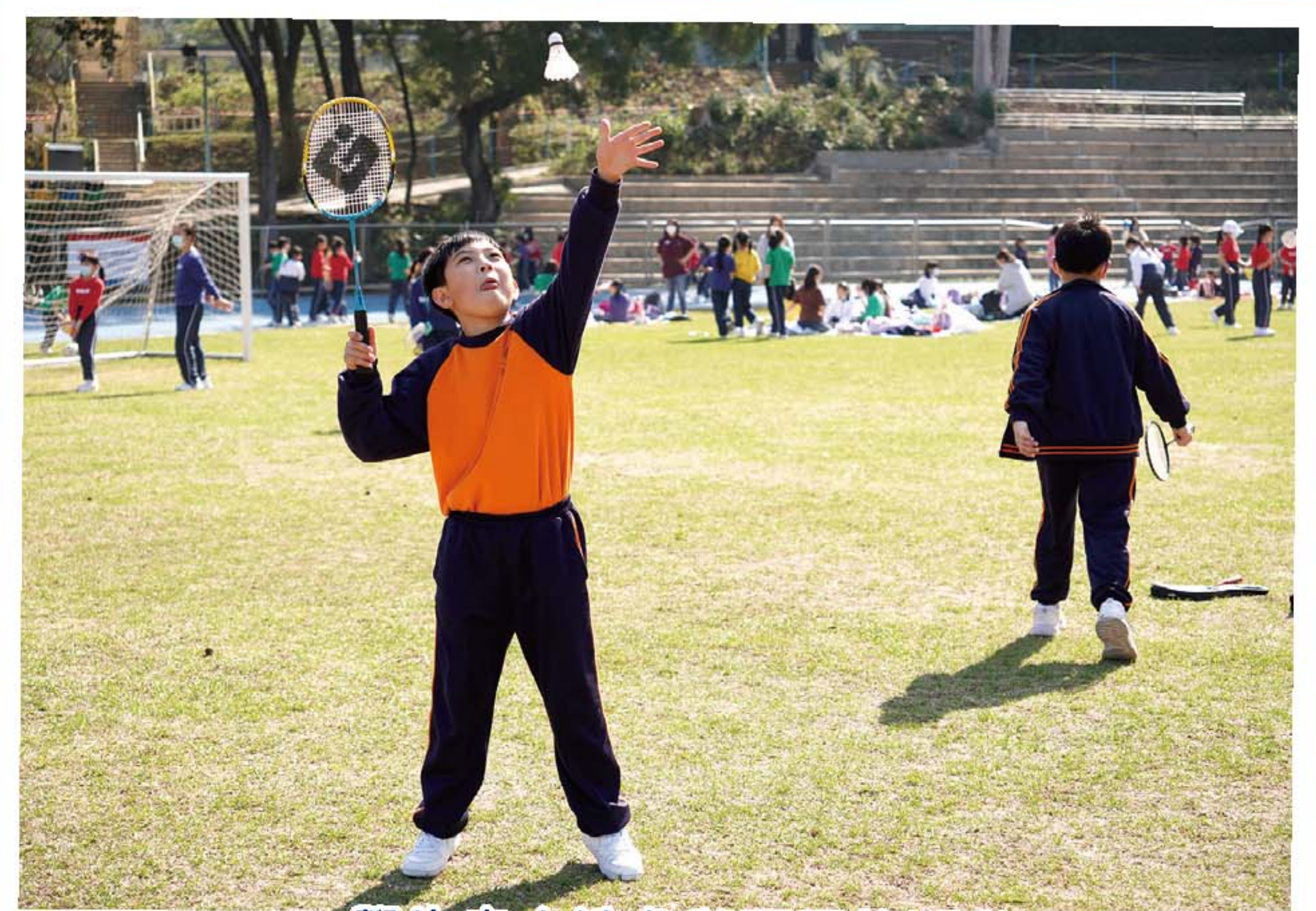
學生自由地參與不同的活動