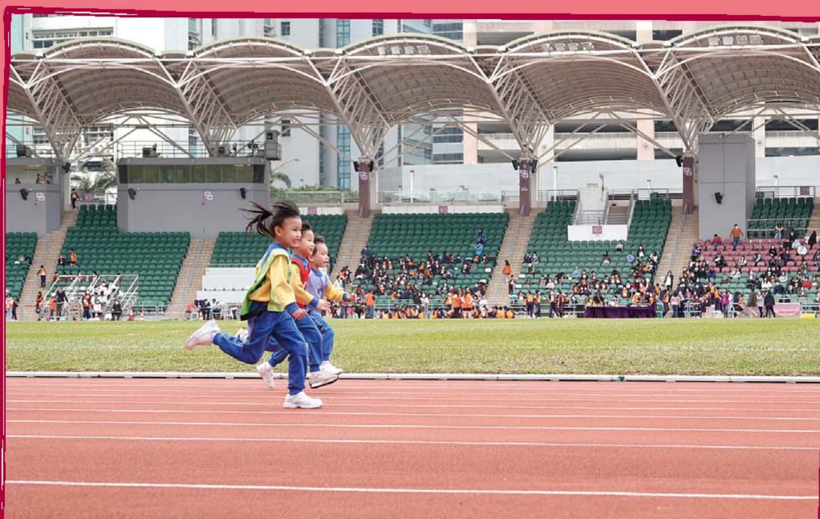
聖公會主誕堂幼稚園的學生十分享受這個比賽