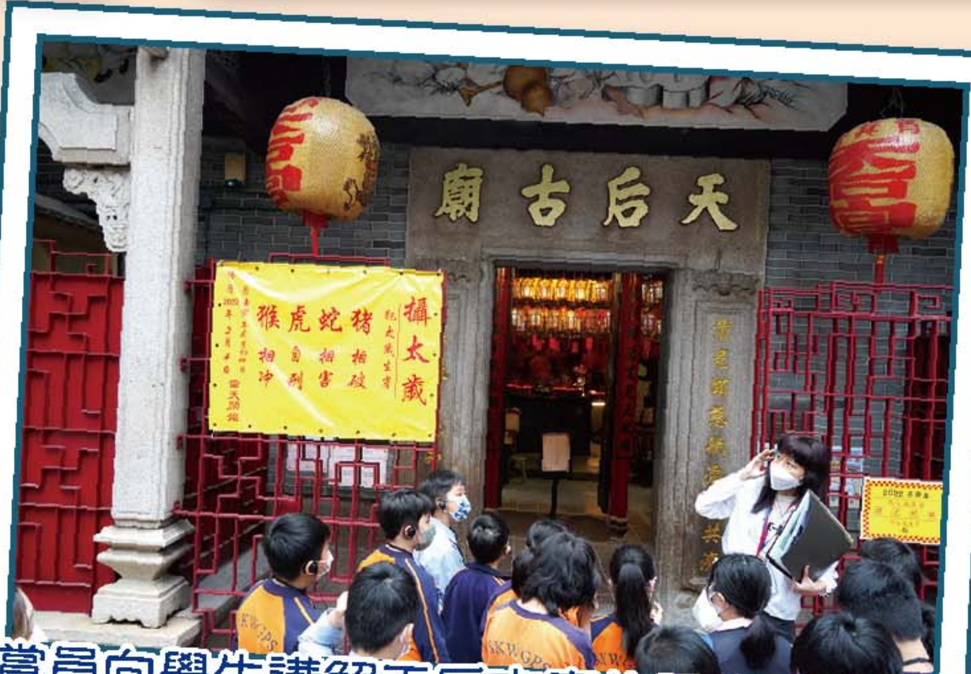
導賞員向學生講解天后古廟的歷史及建築特色