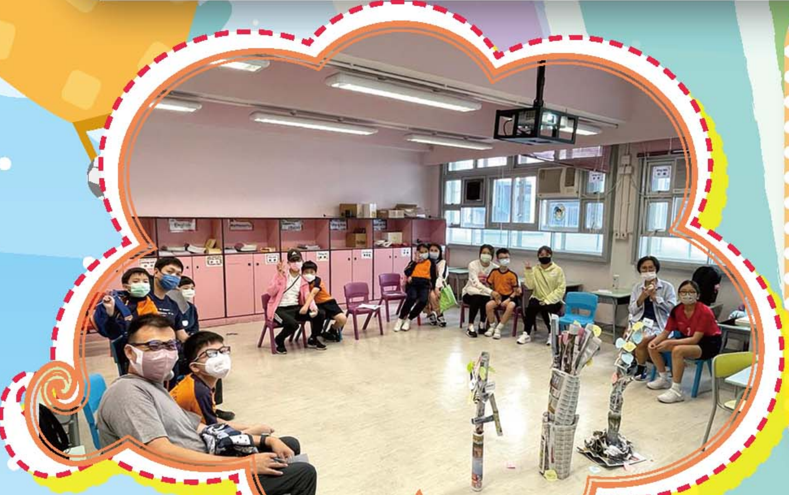
親子活動，製作幸福家庭樹，寫下幸福元素，促進親子溝通。