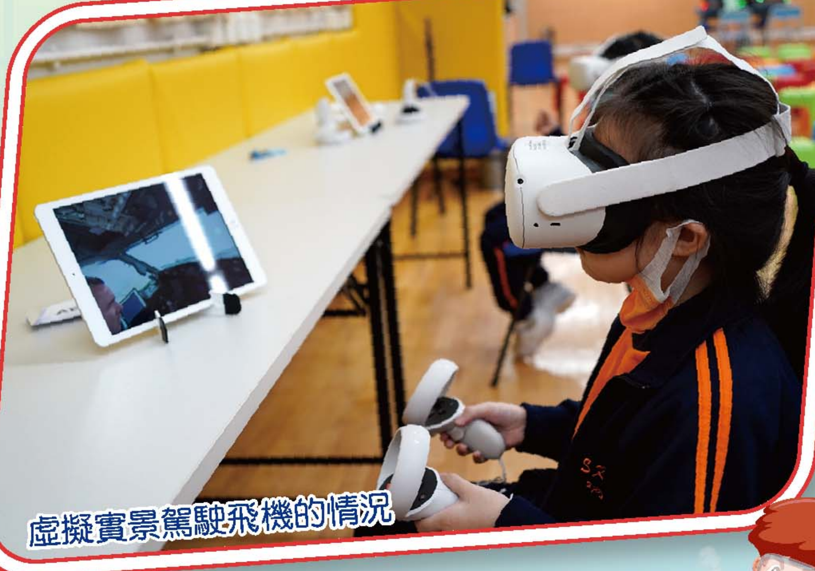
虛擬實景駕駛飛機的情況