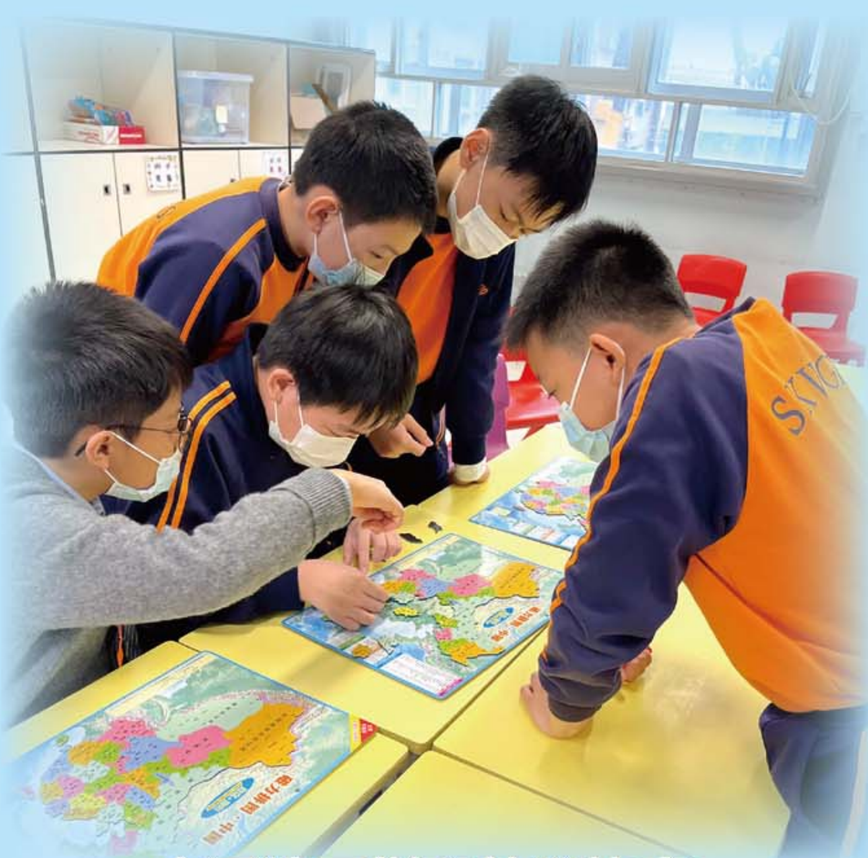
中國地圖拼砌校際比賽

本校的少年警訊成員參與不同的活動，其中包括：簡介會暨迎新日、中國地圖拼砌校際比賽、少訊中銀STEM-UP創新科技大賽嘉年華等，藉以加強學生對警務工作之認識及彼此間的聯繫、發展他們對社會的責任感及建立正確的價值觀，學生都非常勇躍參與活動。