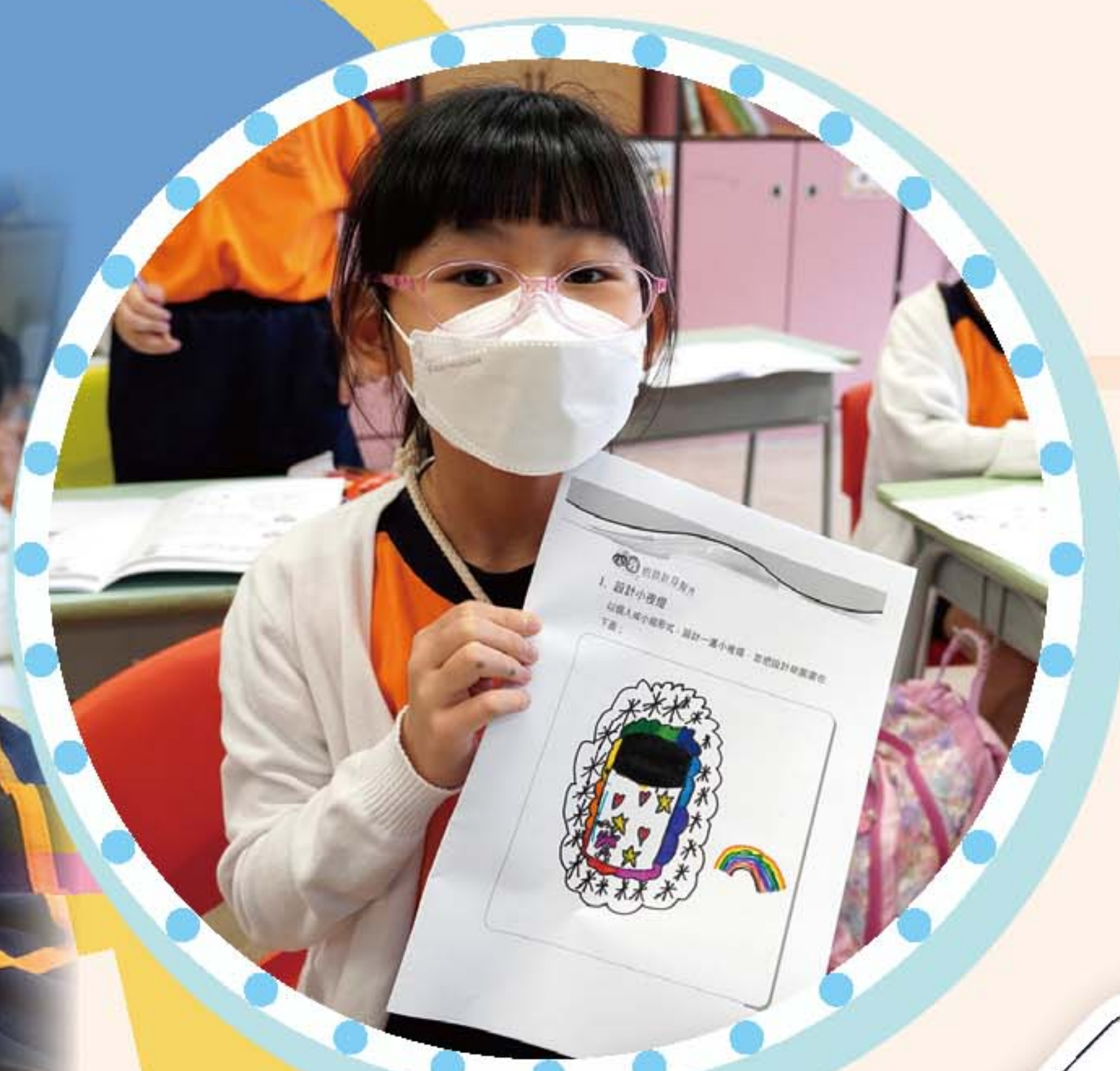
我設計的小夜燈多精美！