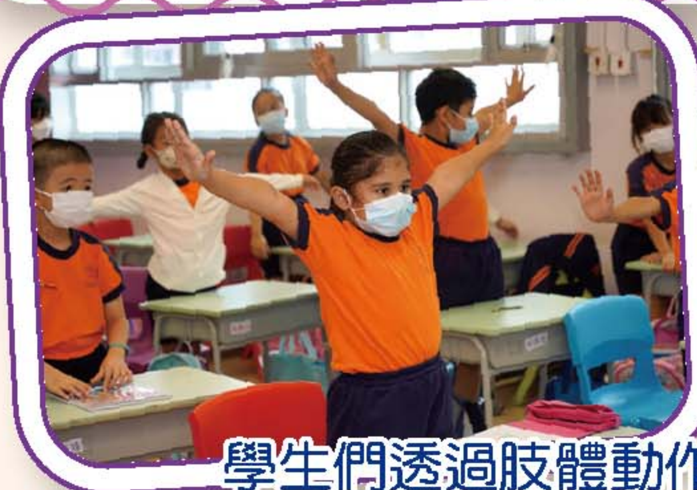
學生們透過肢體動作模仿象形文字的造型

在9月26至9月29日的中文課期間，二年級學生透過生動有趣的學習活動，認識中文字的起源和結構。學生透過肢體動作模仿象形文字的造型，更透過「考古活動」明白中國文字的歷史和價值，讓學生在學習字型結構的同時，認識到中國文字的歷史演化，加深學生對中華文化的了解。