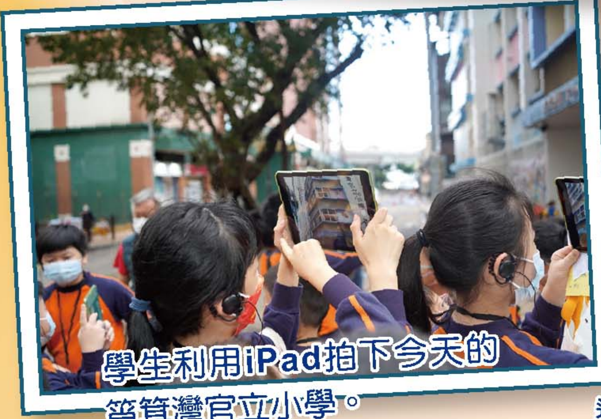
學生利用iPad拍下今天的筲箕灣官立小學。