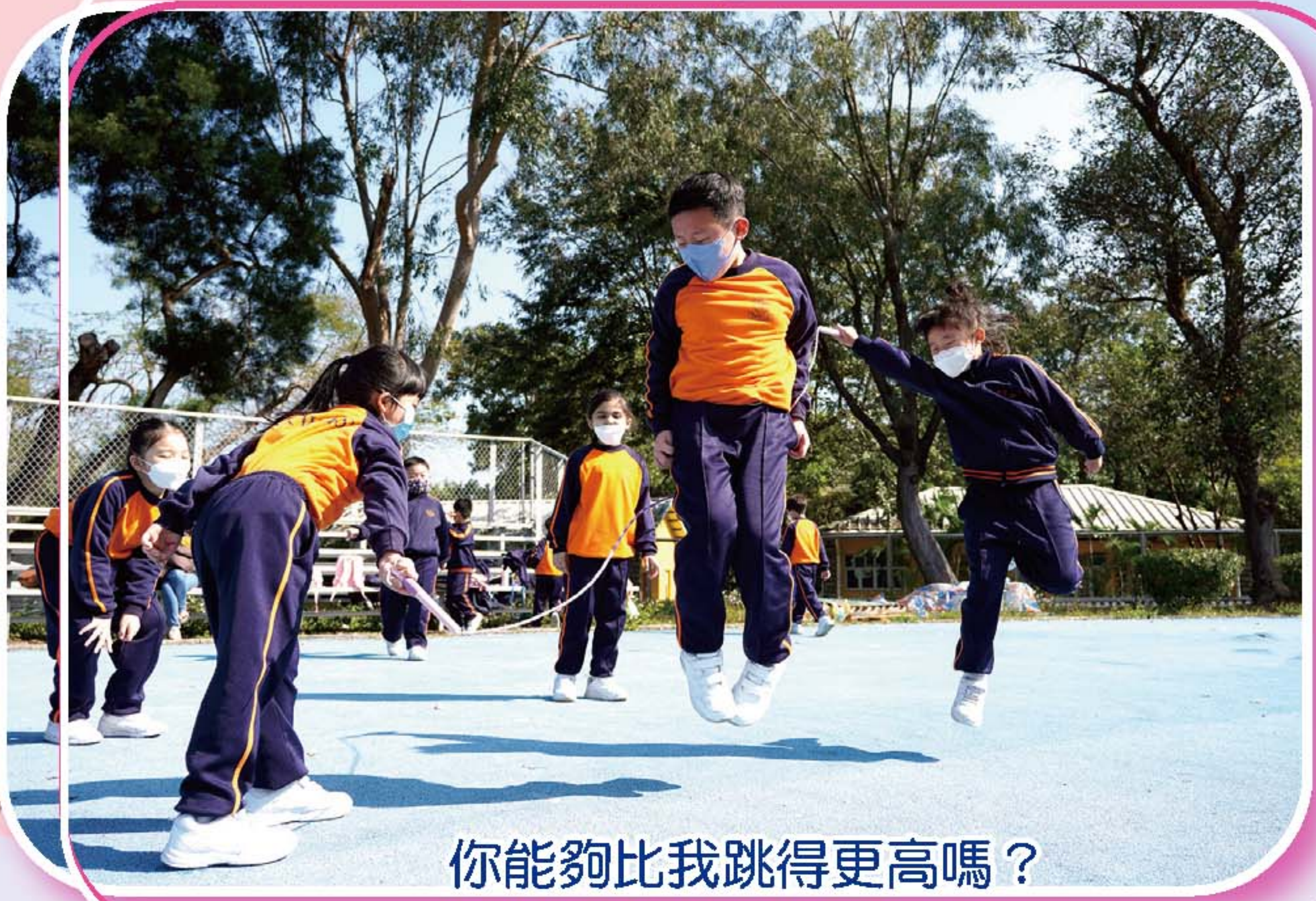
你能夠比我跳得更高嗎？

本校在2月17日舉行了疫情後的第一次學校旅行，全校師生、教職員及家長義工約五百二十人一同前往烏溪沙青年新村。一眾師生感到無比興奮和雀躍。當天學生既可以舒展身心、親親大自然，又可以放鬆平日緊張的學習情緒。