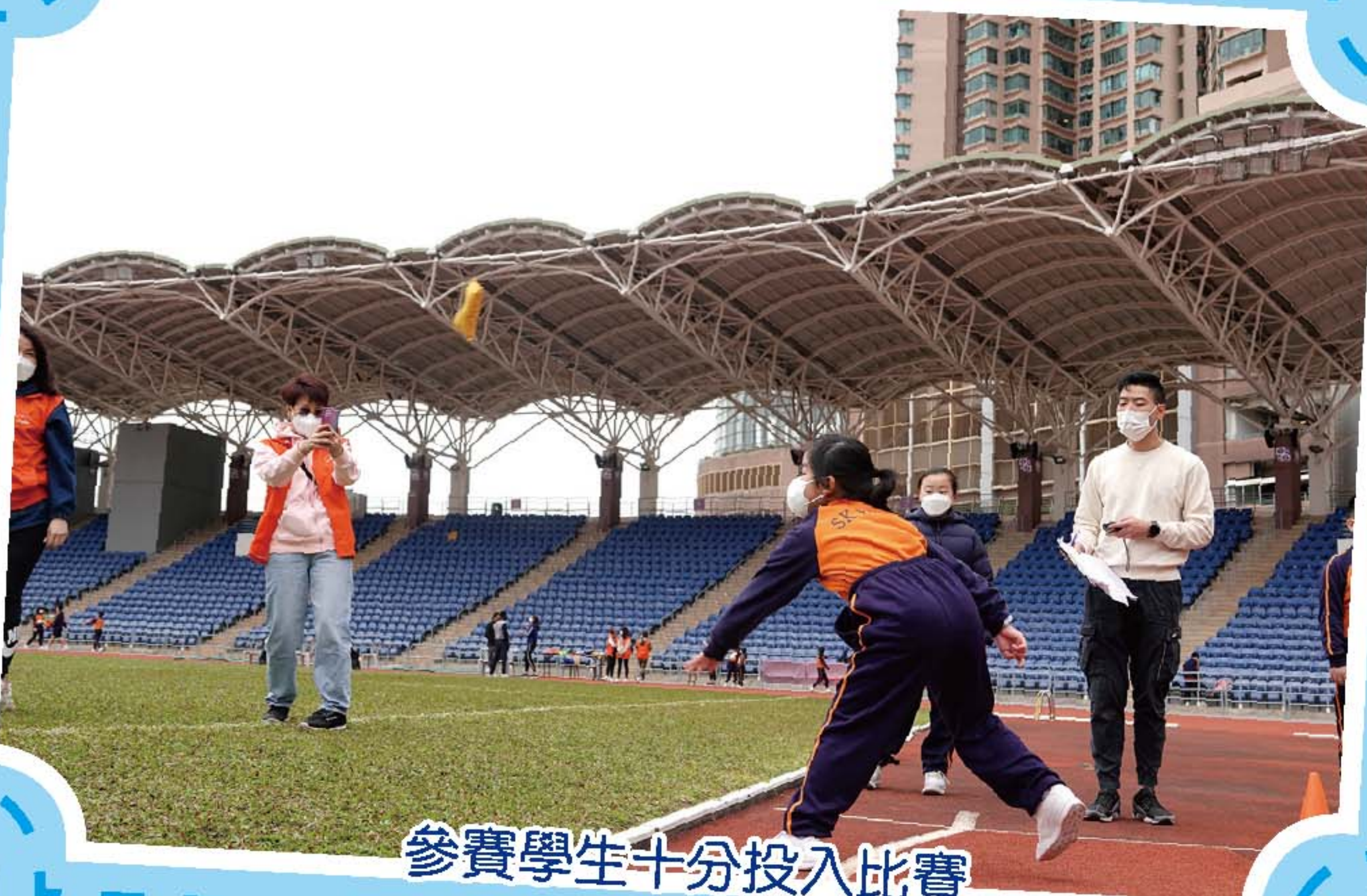
參賽學生十分投入比賽

於2月3日假小西灣運動場舉行運動會。自疫情後，同學與運動會闊別多年，能夠再次參加比賽，大家都感到無比興奮，積極訓練。當天本校邀請了羽毛球精英運動員袁倩滢小姐親自到場擔任主禮嘉賓，並為學生打氣，鼓勵學生在運動場上爭取好成績。除此之外，本校更邀請了聖公會主誕堂幼稚園的學生一起參與這個盛會。