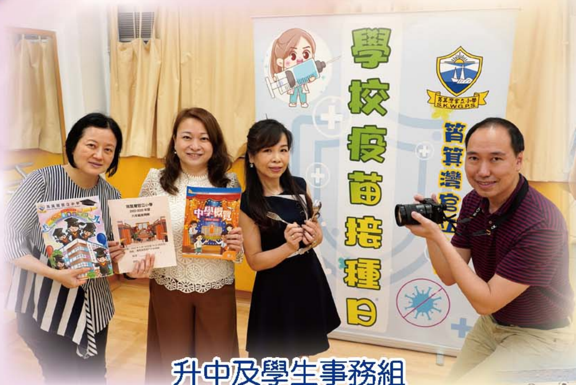
升中及學生事務組