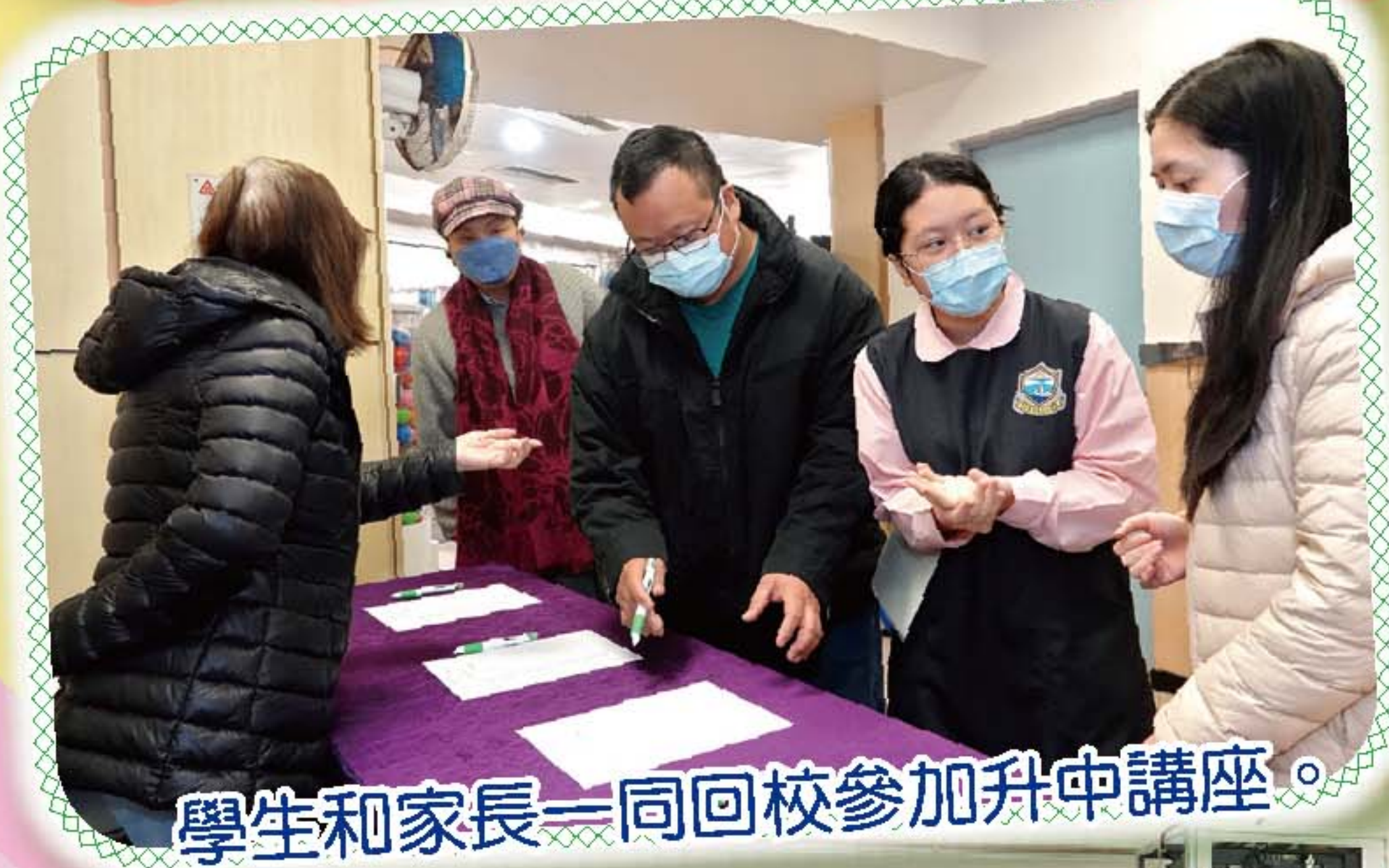
學生和家長一同回校參加升中講座。