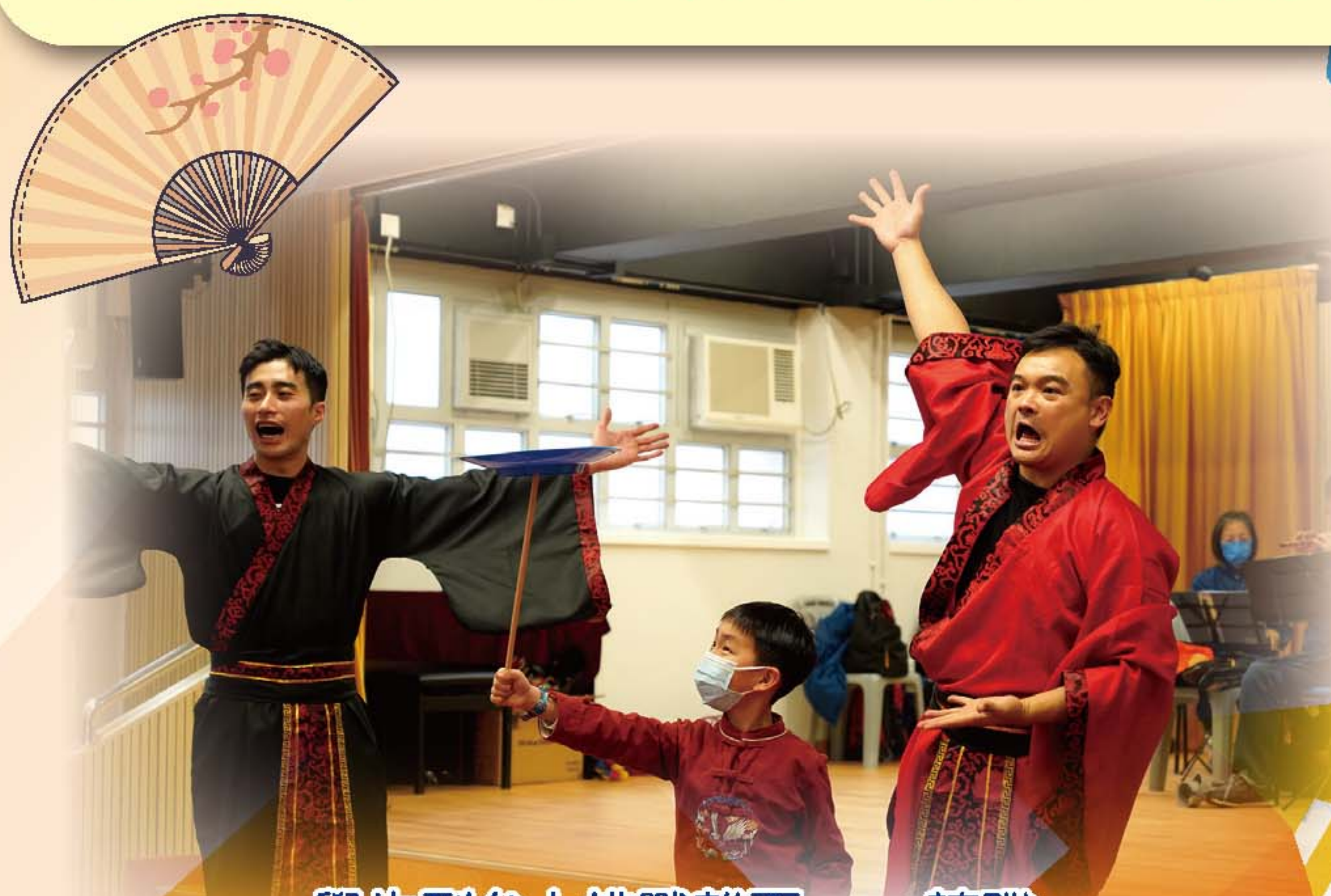
學生到台上挑戰雜耍——轉碟