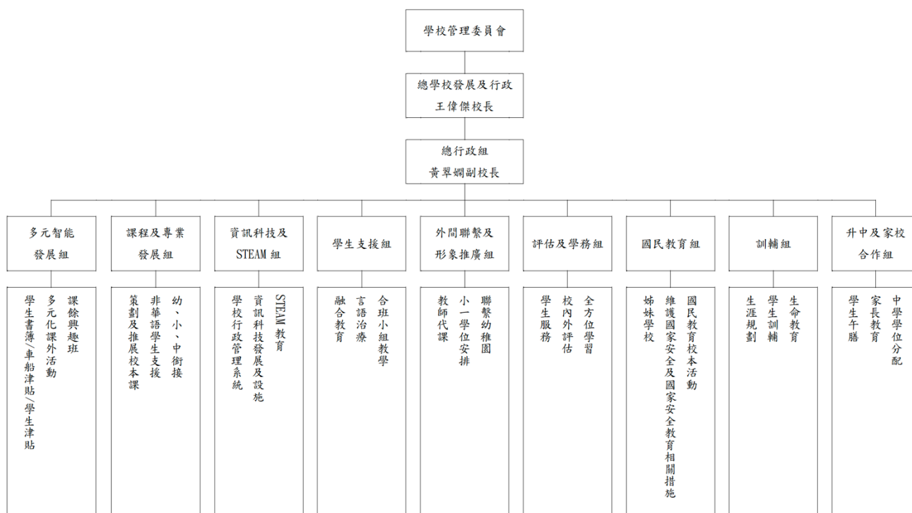
筲箕灣官立小學 2024-2025 年度行政架構